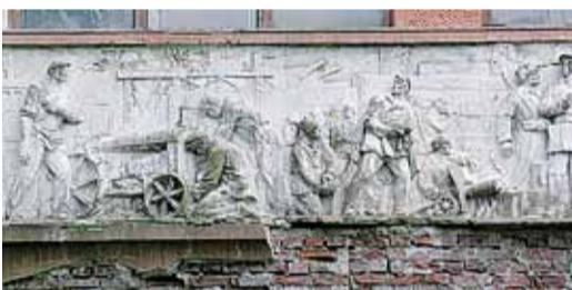
Элемент цементного фриза