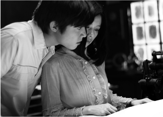
《茱麗葉》-〈該死的茱麗葉〉

許久不見的多段式電影這年又出現在臺灣影壇。《光陰的故事》（陶德辰、楊德昌、柯一正、張毅合導，1982）、《兒子的大玩偶》（侯孝賢、曾壯祥、萬仁合導，1983）曾是引領「臺灣新電影」的浪頭代表。2003年《三方通話》在臺灣電影最淒慘的歲月登場但慘遭遺忘。2010年的《茱麗葉》群集侯季然、沈可尚、陳玉勳，表面上好像要跟莎士比亞的「羅密歐與茱麗葉」互通聲息，但三段作品其實與原典漸行漸遠，反而是導演個別特色在對比下更為清晰。