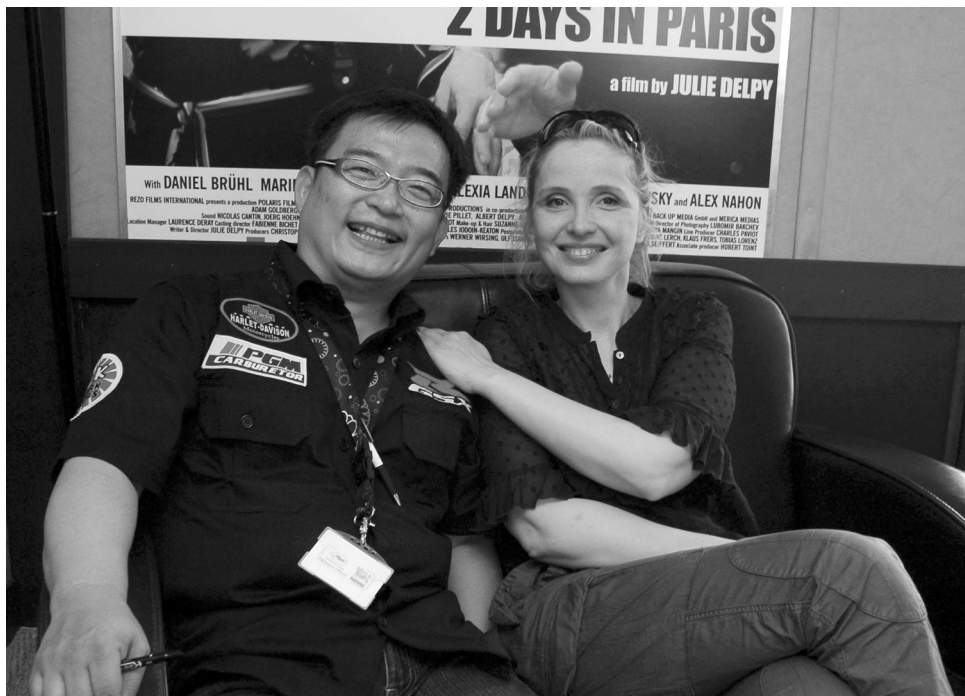
與演而優則導的茱莉蝶兒 (Julie Delpy) 合影。背景海報為茱莉蝶兒 2007 年的導演作品《巴黎 2 日情》，海鵬為該片之台灣發行。