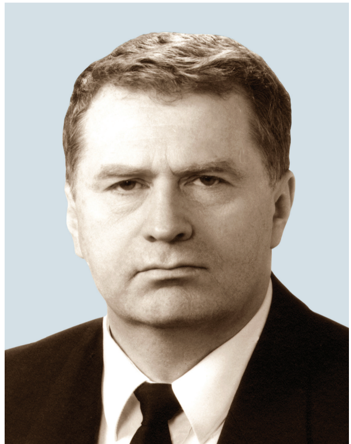
ЖИРИНОВСКИЙ Владимир Вольфович

ГРУДИНИН ПАВЕЛ НИКОЛАЕВИЧ Доходы: помимо указанного кандидата дохода установлено: 2011 год, Московская область Дума – 605 058 руб.; 2013 год, ООО «ТТ Девелопмент» – 81 506,86 руб. (сведения представлены ФНС России). Денежные средства и драгоценные металлы, находящиеся на счетах и во вкладах в банках: указаны кандидатами: ПАО «БАНК УРАЛСИБ» – 231 258,98 руб., ПАО Сбербанк – 655 978,13 руб.; по результатам проверки: ПАО «БАНК УРАЛСИБ» – 358 214,44 руб., ПАО Сбербанк – 2 079 041,13 руб. (сведения представлены банками). Помимо указанных счетов установлено наличие на 01.12.2017 счетов в иностранном банке, расположенном за пределами территории Российской Федерации: UBS SWITZERLAND AG, 2 счета (сведения представлены ФНС России), сумма остатков на 01.12.2017 кандидатом не представляется.