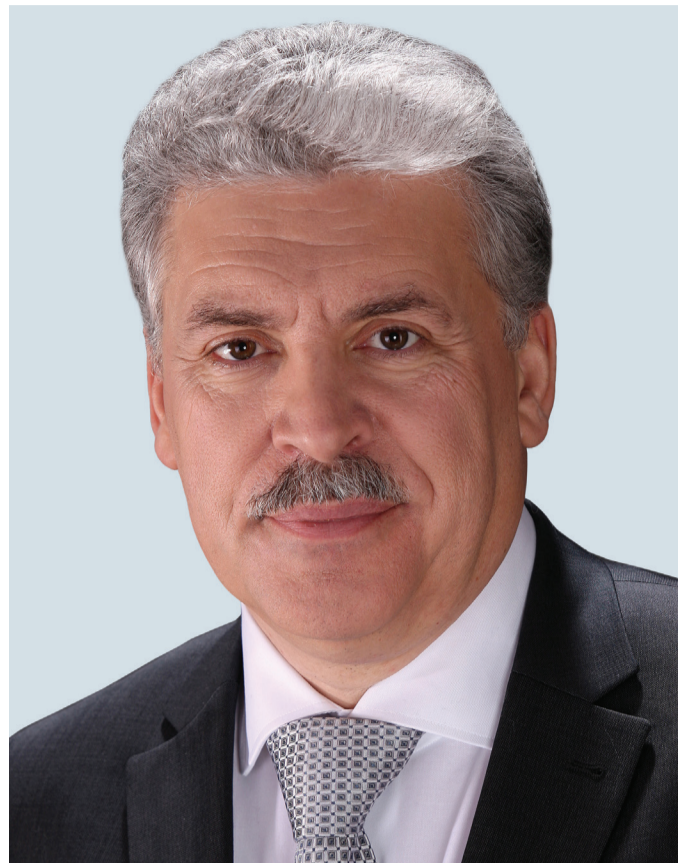
ГРУДИНИН Павел Николаевич

Денежные средства и драгоценные металлы, находящиеся на счетах и во вкладах в банках: помимо указанных кандидатов счетов установлено: ПАО ВТБ – 12 999,07 руб. (сведения представлены банком).