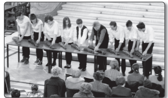
A Kispesti Citeraegyüttes

A változatosság gyö- nyörködtet jegyében harmadikként a Kispesti Citeraegyüttes lépett fel, többszörösen kitüntetett