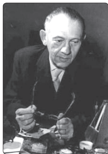
Lajtha László 1892. 06. 30.-1963. 02. 16.