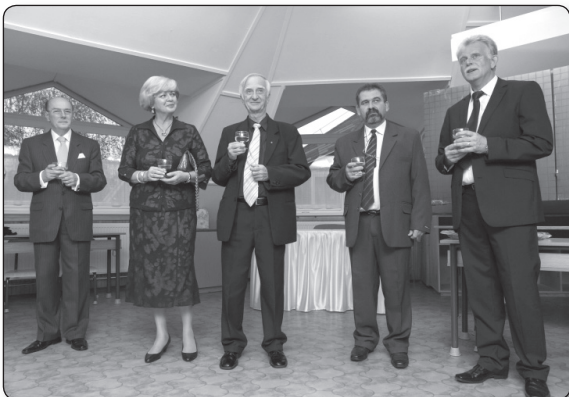
Marék Veronika meséjének a 70-es évek második felében készült 26 részes rajzfilmsorozata

Az adományozott hangszer kottatartójára egy kedves kabalát tettek, a kockásfüllű nyúl figurát.