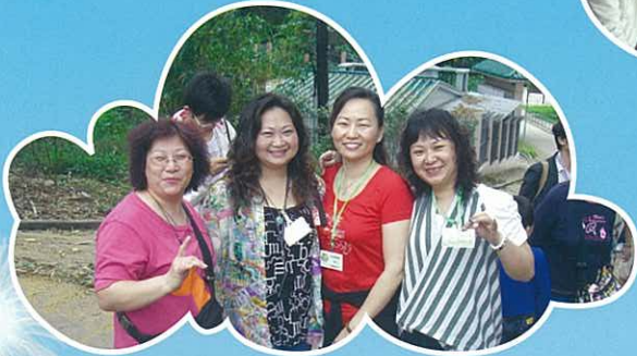
出外遊歷，增廣見聞。