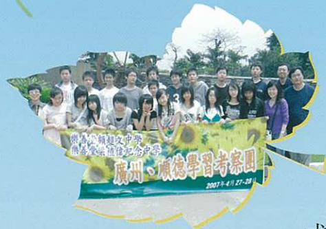
本校通識教育科學生 前往廣州、順德學習考察團。

甚或家長們會擔憂：通識科集眾科目於一身，會否使學生們的功課、溫習的範圍也變得繁多及複雜，考試的難度豈不是會大大提升？我們的同學則認為通識科是著重學生們的