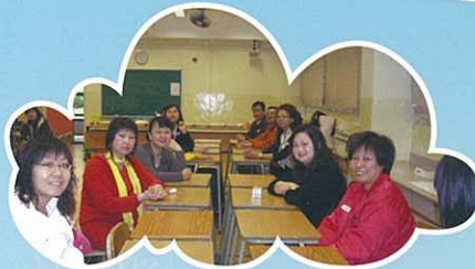
農曆新年團拜，家長教師互相祝福。