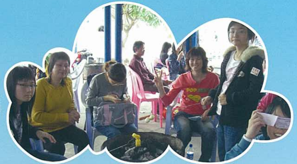
偷得浮生半日閒，親子燒烤享天倫。