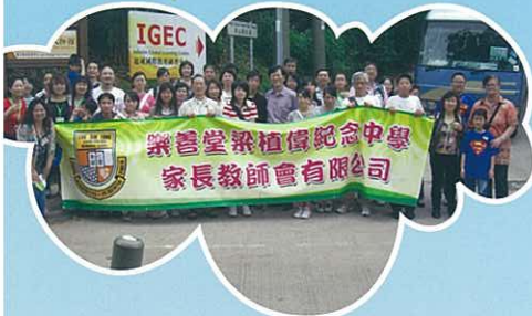
親子旅行，其樂無窮。