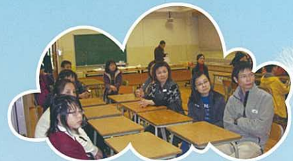
親子座談會，心聲互分享。