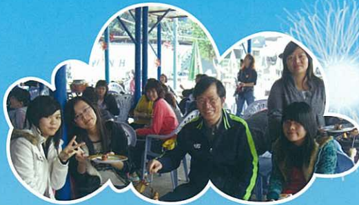
校長學生同用心，齊食雞翼好開心。