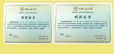
本校共有九位學生獲得由 中國人民大學所頒發的證書。