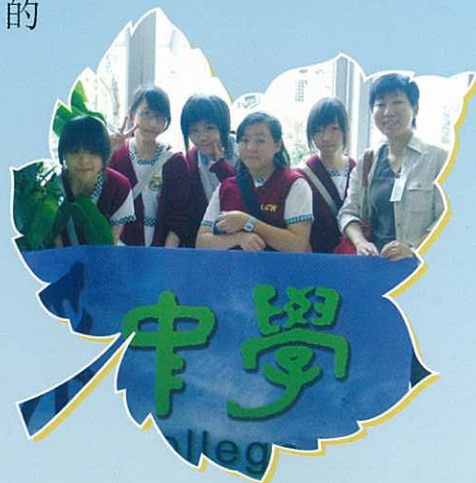
本校通識教育科學生 前往順德風采中學作學術交流。