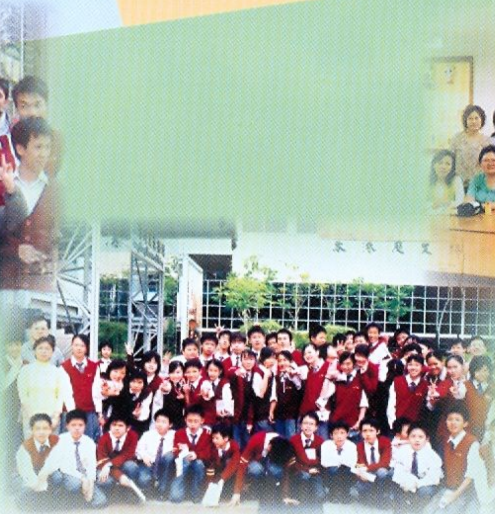
家長與老師一同到香港歷史博物館