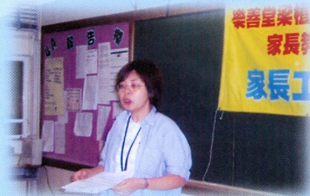
講員全情投入，與家長一同分享管教子女的心得