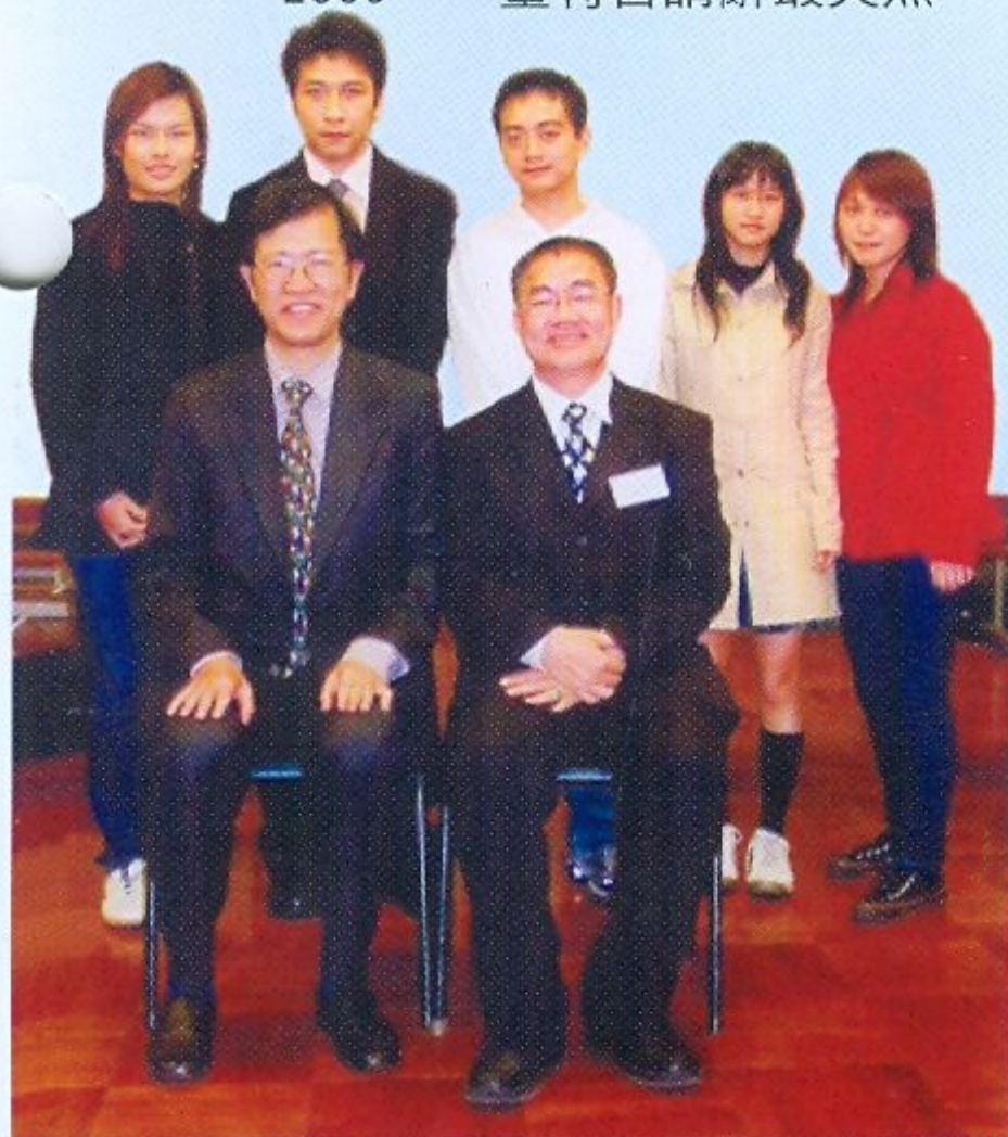
黃志坤校長及捐款人(前右)與中七畢業同學合照

2003 口罩的日子最難過。 2004 南亞海嘯最驚恐。 2005 董特首請辭最突然。