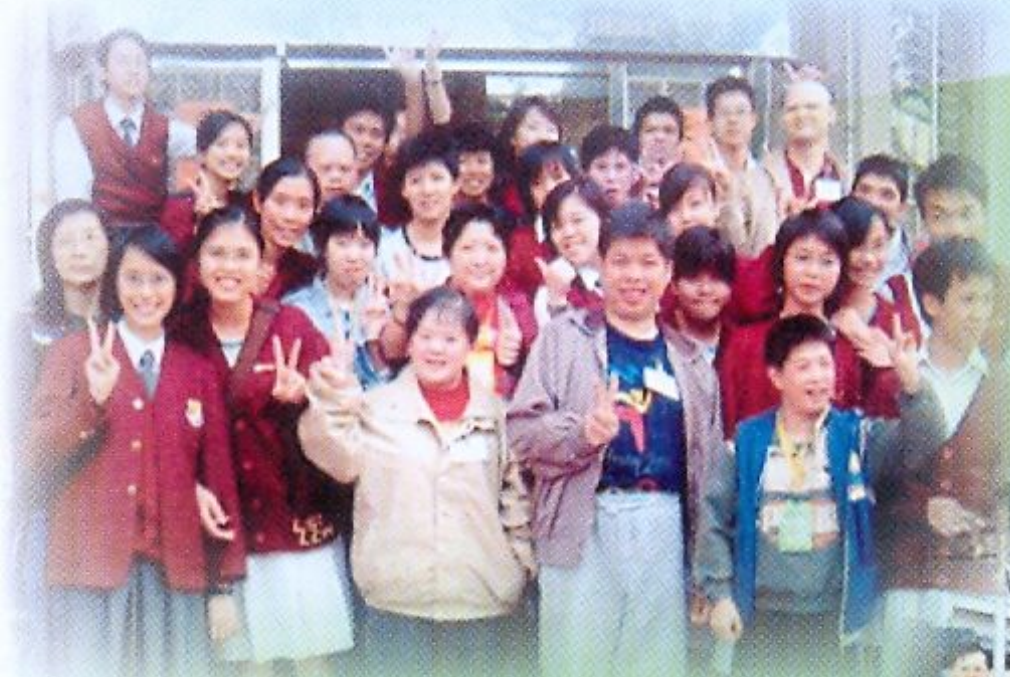
家長參予義工服務與工友合照