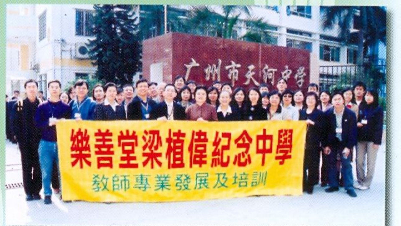
梁中考察團獲廣州市天河中學熱情招待