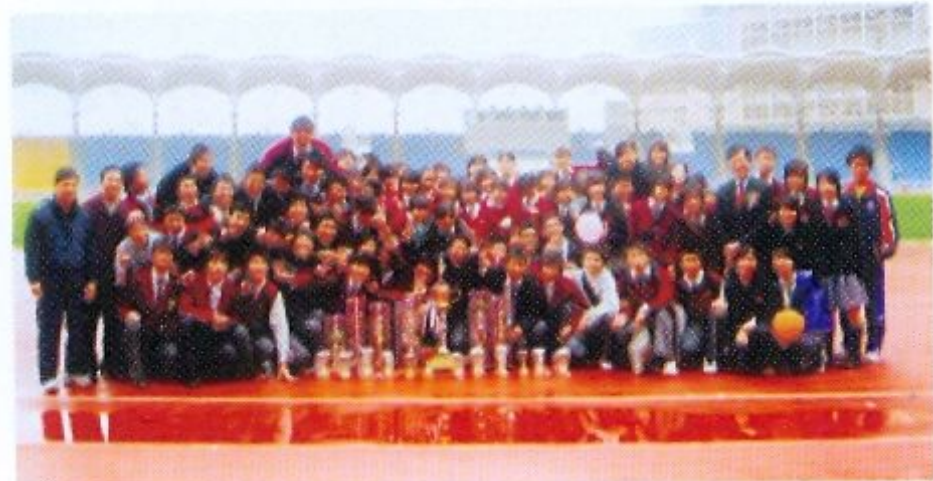
樂善堂聯校陸運會大豐收