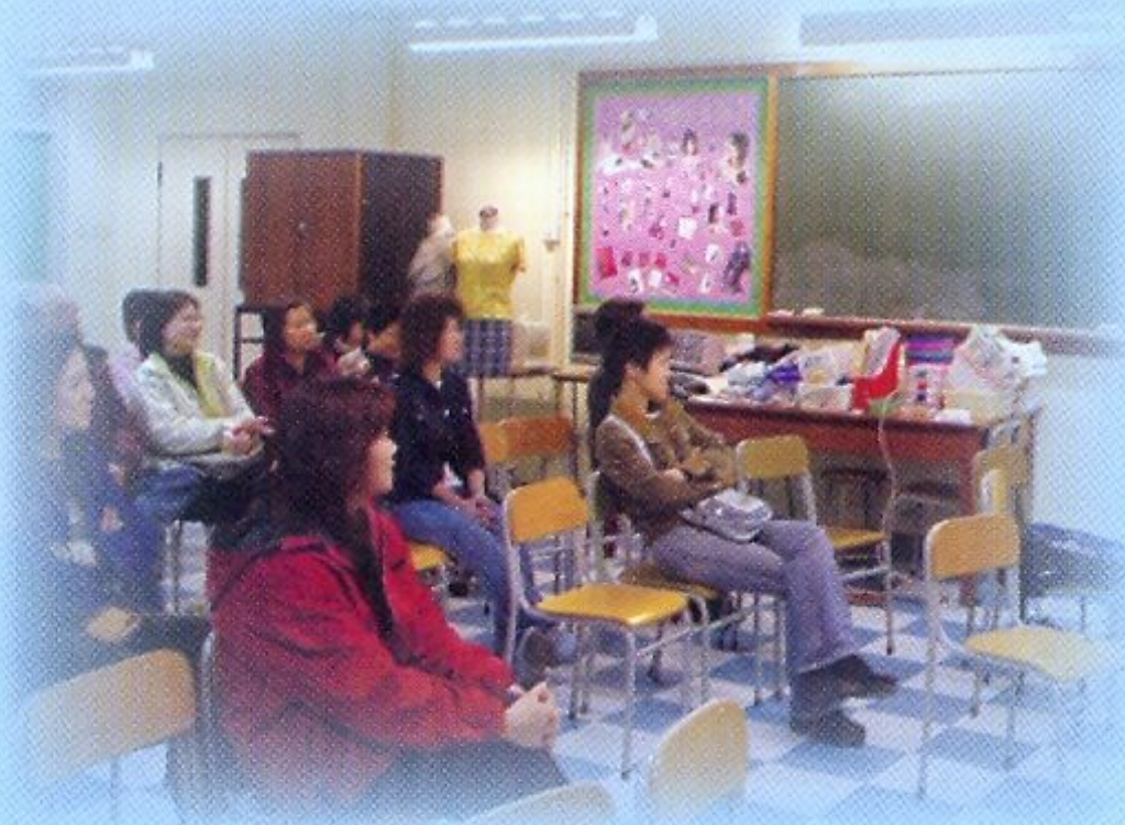
講者落力，家長專注