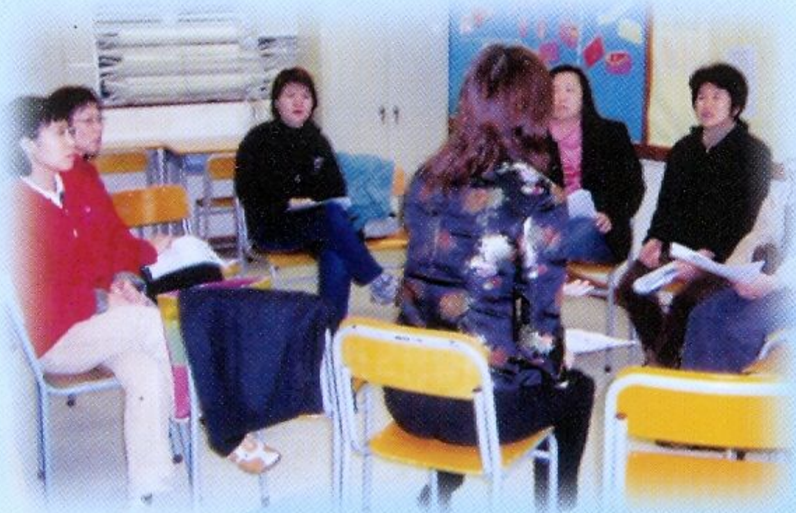
家長與老師積極回應講者的經驗分享

本校與家長聯繫緊密，各項活動均獲家長踴躍支持。家長教師會致力推廣「家長學堂」，經常舉辦不同主題的講座、工作坊、小組分享會、座談會、茶聚及日營等等，家長分享經驗，加強合作，促進溝通，共同培育子女。近年，本校推展「家長義工」計劃，邀請家長擔任義工，如教授「活動課」，管理「中一學生午膳」，帶領學生戶外參觀活動及監考，與學生一同參與校外義工服務等，讓家長積極投入參與學校事務，建立更和諧的校園生活，共同教育下一代。