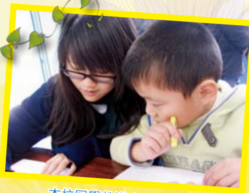
本校同學教導小學生繪畫