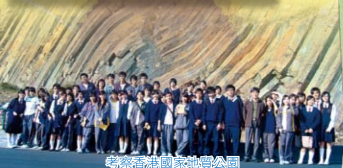
考察香港國家地質公園