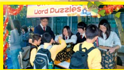
為小學主持學科攤位遊戲