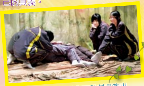
在樂施會氣候變化互動劇場演出

透過活動，可增加學習的趣味。本校多次舉辦主題教學活動，得到友校熱烈支持。本校師生亦多次應邀，協辦或主辦各種學術活動、遊戲及比賽。透過活動，同學可加深對學科的認識，學習待人接物的正確態度及體驗教學相長、助人助己的真義。