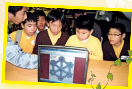
本校籌辦小學數理嘉年華比賽，同學全力以赴