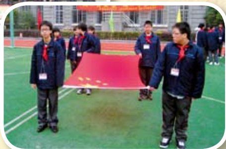
學習持國旗進場儀式