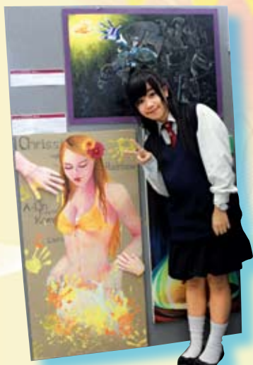
全港中學生視覺藝術展獲獎作品