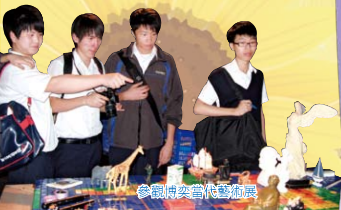
參觀博奕當代藝術展