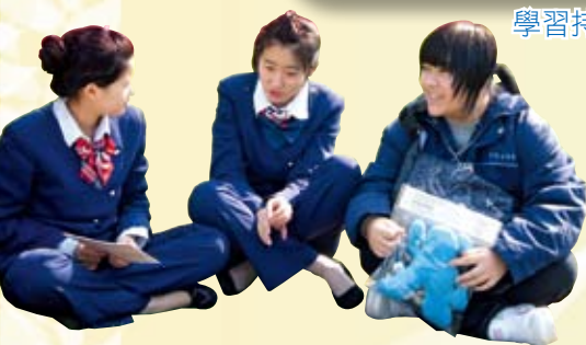
與上海專業旅遊學校同學交流

本校通識科為配合中二級議題——《上海與香港》及《旅遊樂無窮》，並為新高中「現代中國」及「今日香港」單元作好準備，安排中二級同學到上海進行學習，加深對國家發展的認識。