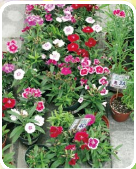
栽植石竹花班際比賽

本校實踐「綠色學校」精神，致力推動環保，為自然、為地球盡一分力。環保學會每月舉辦不同的班際環保比賽，讓全校同學，一同參與。