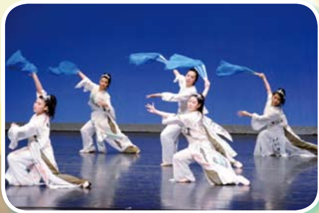
舞蹈組演出，舞姿優美，流暢自然