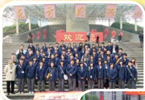
參觀上海東方明珠塔