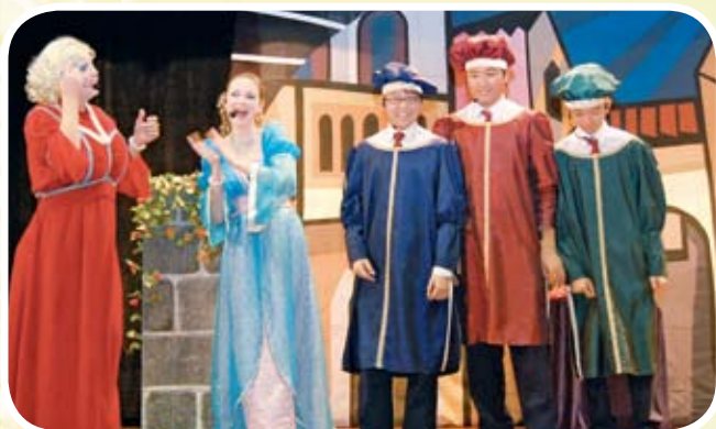
學生參與演出英語話劇