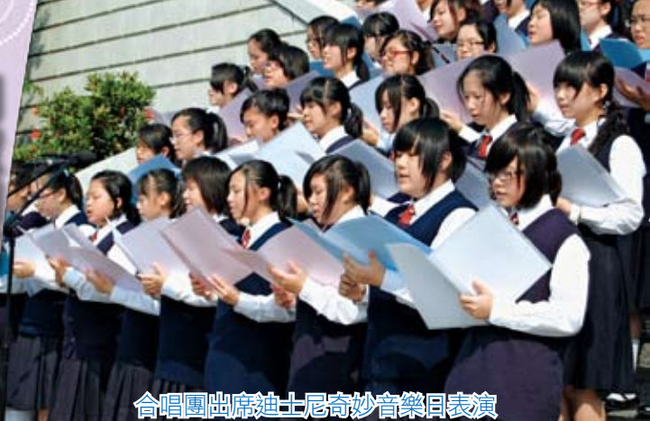
合唱團出席迪士尼奇妙音樂日表演