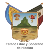
Estat. Estadística Básica Inicio de Cursos 2010-2011