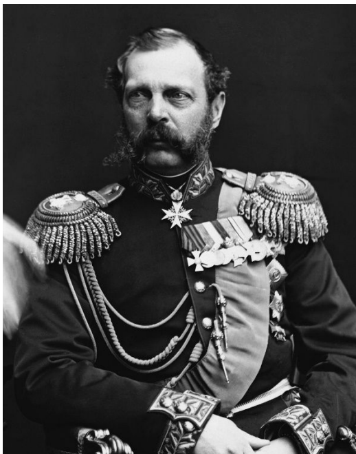
Царь Александр II

«Я буду рассматривать признание независимости Конфедеративных Штатов со стороны Франции и Великобритании в качестве casus belli ».