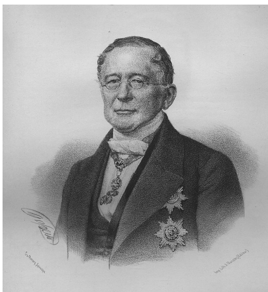
Российский министр иностранных дел А.М. Горчаков

Линкольн, в это самое тяжёлое время его президентства, послал срочное личное послание российскому министру иностранных дел Горчакову для передачи царю. Линкольн справедливо полагал, что Франция уже приняла решение о вмешательстве и ожидала только сигнала от Англии. У Линкольна не оставалось иллюзий, и он понимал, что если Соединенные Штаты будут спасены, то только Россией. И Россия пришла на помощь.