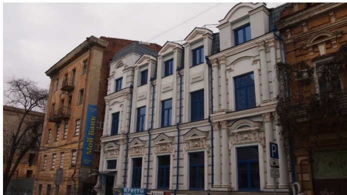
Улица Шаумяна, Дом купцов Яблоковых

сооружения. Были укреплены фундаменты, выполнены железобетонные перекрытия, восстановлен цокольный этаж, надстроен мансардный.