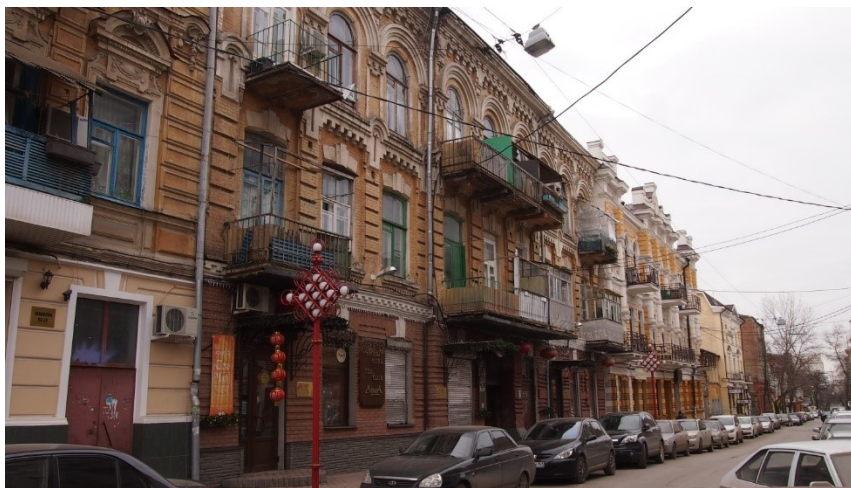
улица Шаумяна, перспектива улицы

Погрузиться в атмосферу этой улицы, представить, как по ней ходили обитатели крепости Дмитрия Ростовского и Солдатской слободы, как шли на церковную службу прихожане, чинно прохаживались купцы, как мчались по своим делам приказчики и шустро бегали гимназисты.