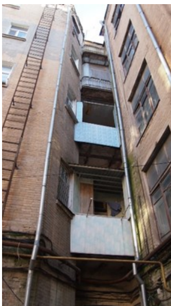
Дом-ковчег купца А.А. Леванидова, вид со двора

Оригинальную рельефную пластику фасадов формируют детали из светлого кирпича: подоконники и подоконные вставки, декоративные рустованные перемычки, замки проемов и таблички; на южном фасаде в простенках верхнего этажа неглубокие ниши с геометрическим орнаментом. Стены первого этажа оформлены штукатурной рустовкой. Выразительный облик здания подчеркивают и размещенные между лопатами балконы.