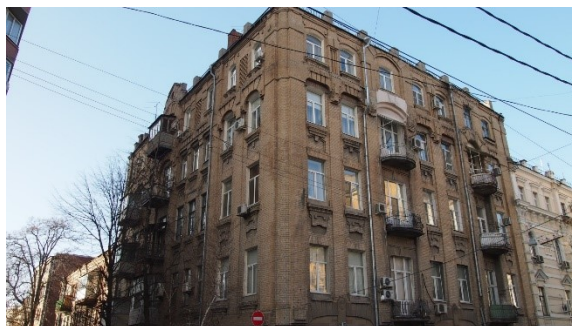
Дом-ковчег купца А.А. Леванидова

составляют тумбы, объединенные секциями металлического решетчатого ограждения.