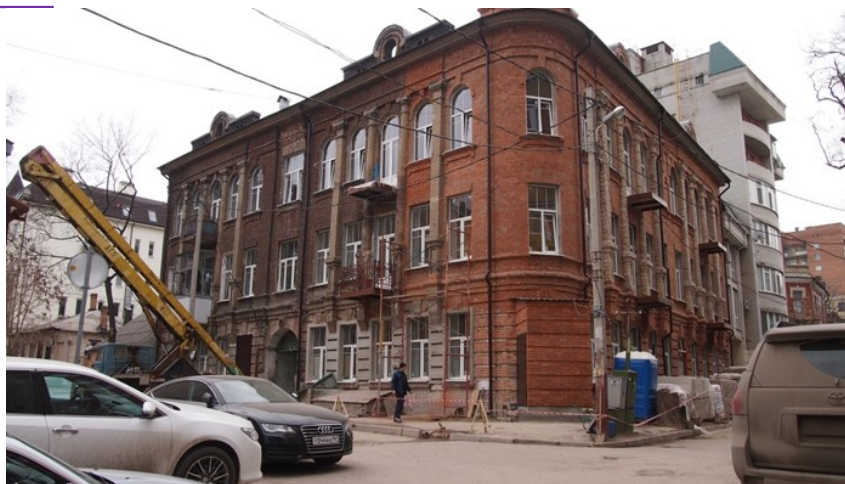
Дом Евдокима Гавриловича Лисицына

Почти квадратный в плане трехэтажный дом занимает угловое положение в квартале, имеет двор-колодец со въездом с улицы и двумя входами с парадных фасадов. Завершает угловую, дугообразную в плане часть здания невысокая ротонда с пологим куполом. Такое решение придает всему объему монументальную цельность, которую органично дополняют верхние полуциркульные окна с архивольтами и декоративными замками.