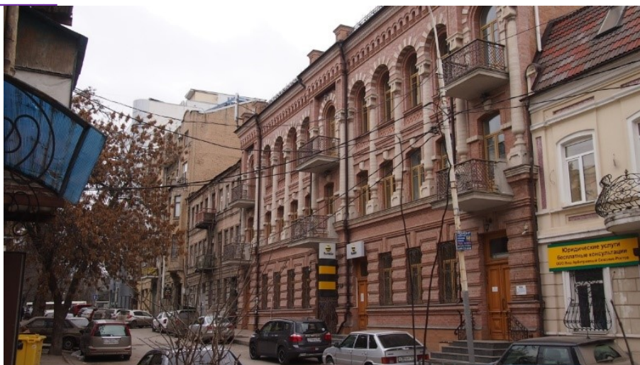
улица Шаумяна, перспектива улицы