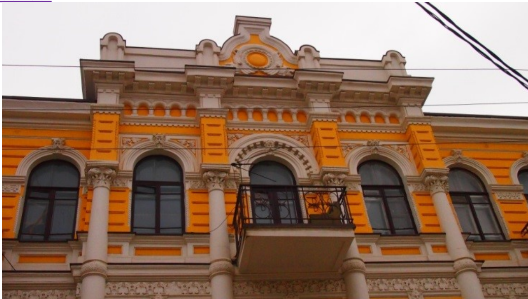
Лепной декор, улица Шаумяна

Архитектурные стили, в которых оформлялись фасады улицы, восходили к ретроспективному эклектизму второй половины 19 века. На ней можно было встретить классицизм, барокко, «восточные стили», ренессанс, неоклассику, и все эти стили умещались на одной улице! Конечно же, годы гражданской войны очень сильно изменили жизнь улицы. Большое количество разных магазинов, клубов, мастерских, располагавшихся на ней, закрылись. В 20-30 годы 20 века здания обретают новое общественное значение. В них вдыхают новую жизнь. В 1930-е годы утверждается также новое название улицы – имени Шаумяна.