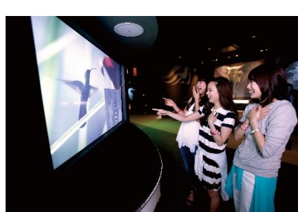
コマ数秒の世界 『タイムスライス』(1F)