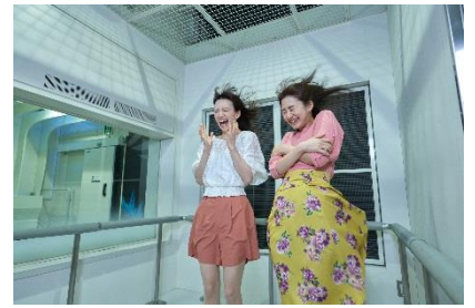
極寒体験『マウントケニア』(1F)