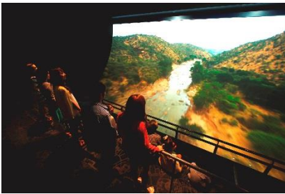
地球飛行『アースクルージング』(1F)