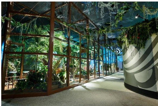
新エキシビション『アニマルガーデン』外観

新しいエキシビションとして「探求」をテーマにカピバラやアルマジロ、オノオオハシなどの珍しい動物たちが動き回る中を回遊できる『アニマルガーデン』や、「癒し」をテーマに12種20匹の猫とふれあえる『キャットパラダイス』が登場。小さなお子さまも安心して小動物たちと「仲よし」になることができ、さらに動物を囲んだ撮影もできるエキシビション『アニマルスタジオ』もさらにパワーアップいたします。