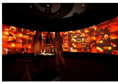
地球色見本『アースパレット』(1F)