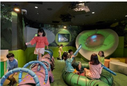
キッズプレイグラウンド『メガバグス』(1F)