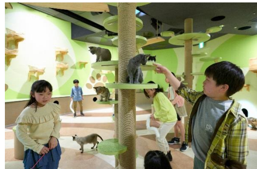
新エキシビション『キャットパラダイス』

また、より野生に近い動きを目の前で観察いただき、動物への理解を深めていただくために、フクロウやインコによる『フライトトレーニング』を新たに実施。さらに自然に関する企画の数々を期間限定で開催する『マルチスペース』では、第1弾として恐竜をテーマにした『恐竜ハンターキャンプ』(4月1日(日)～5月27日(日))を開催するなど、館内各所で様々な企画を実施いたします。