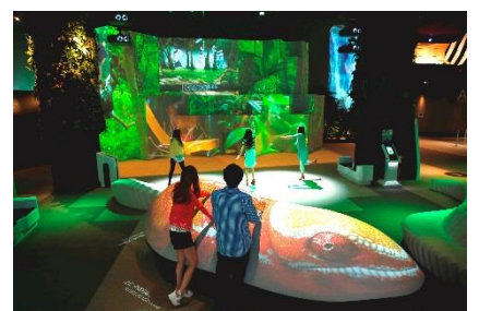
大自然マッピング『ベースキャンプ』(1F)