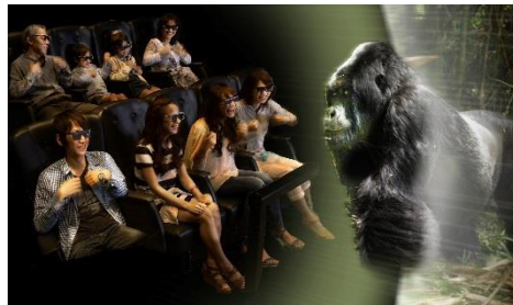
4D シアター『マウンテンゴリラ』(1F)