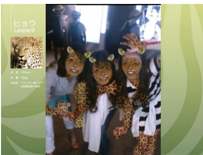
不思議な鏡『アニマルセルフィー』(1F)