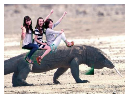
おもしろ写真館 『エクストリームフォトスポット』(1F)