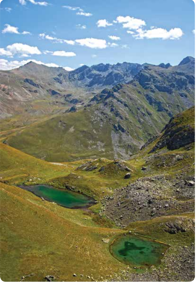
Sivrinin Gölleri, İkizdere