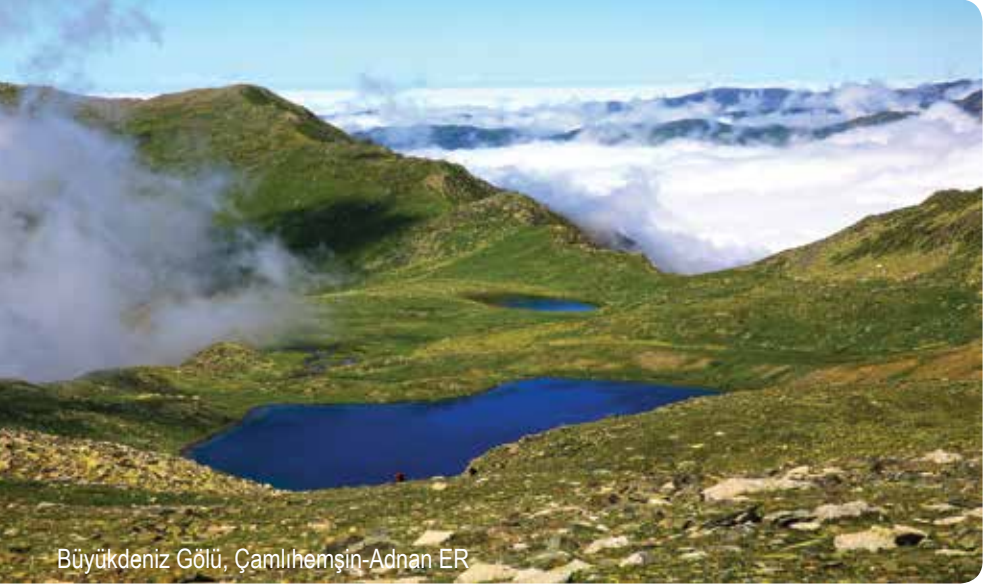
Büyükdeniz Gölü, Çamlıhemşin-Adnan ER

Rize, Türkiye'nin 'en fazla buzul gölüne ev sahipliği yapan kenti' unvanını haklı bir gururla taşıyor. Bu anlamda dünyadaki benzerleriyle yarışan Rize, 'Buzul Gölleri Kenti' sıfatını fazlasıyla hak ediyor. Mavi, lacivert, yeşil veya turkuaz renklere bürünen bu doğal güzellikler inci tanesi gibi yayılıyor dağların koyaklarına. İki yüze yaklaşan sayısıyla en çok buzul gölü Kaçkar Dağları'nda bulunuyor. Kaçkar Dağları bölgesinin milli park ilan edilmesinde önemli bir rol oynayan göller, doğu-batı doğrultusunda uzanan dağların doruk altlarındaki çanaklarda yer alıyor.