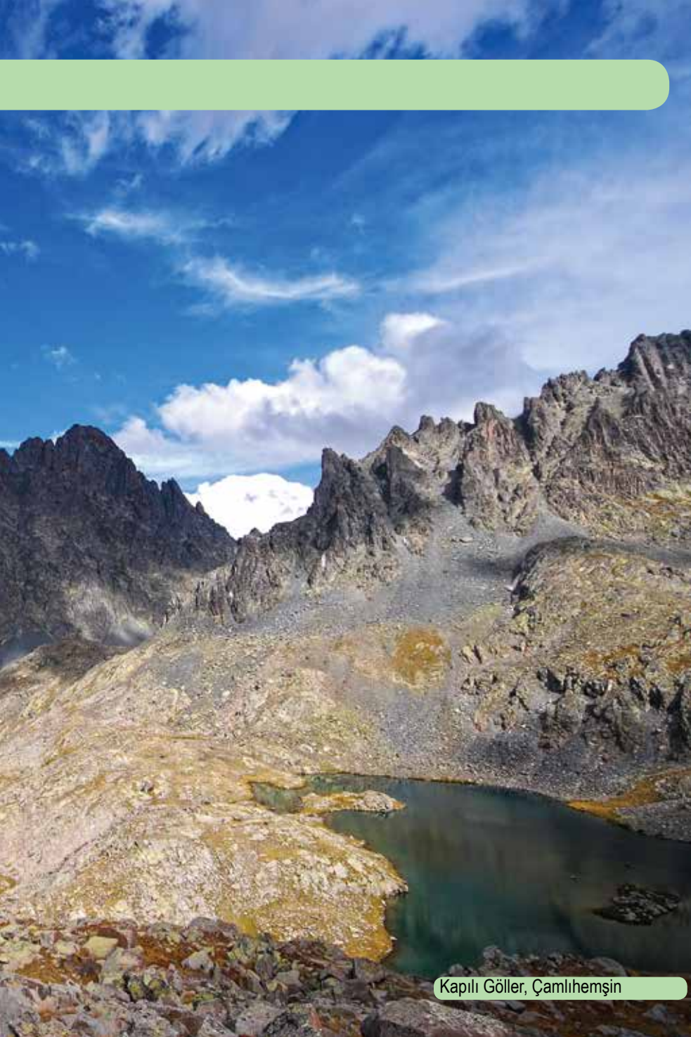
Kapılı G ller, amlıhemşin