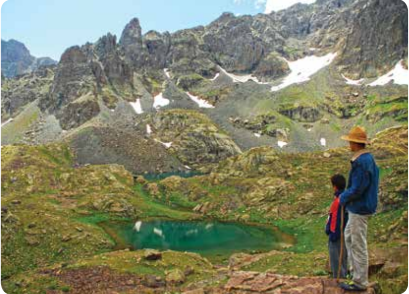
Kurban Düzü Gölleri, Çamlıhemşin-İspir

Yıldızlı Gölü'nün güneyindeki geniş bir çanağa toplanan altı küçük gölden oluşan Kurban Düzü gölleri 3125 metre yüksekliktedir. Altı gölden sadece At Gölü adlı küçük göl Rize il sınırında, diğerleri ise Erzurum il sınırında kalır. Göllere İspir Salaçur Vadisi'nden ulaşılabilirdiği gibi, Sulak Göller-Tatos Gediği-Derin Göl-Salaçur Vadisi güzergahındaki eski geç yolu izlenerek de varılabilir.