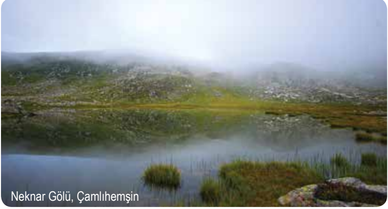
Neknar Gölü, Çamlıhemşin

Didingola Yaylası'na yaklaşık 1,5 saatlik mesafede yer alan Neknar Gölü 2783 metre yükseklikte. Kukmeka ile Miyagoz tepeleri arasındaki bir çanağa konumlanan gölün hemen üzerinde üç küçük göl daha bulunuyor. Açık havada dere boyunca ilerleyen patikayı izleyerek göl kenarına yürüebilirsiniz.