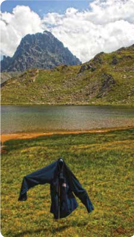
At Gölü, Çamlıhemşin

At Gölü'nün çok yakınında yer alan Kumlu Gölü 2864 metre yüksekliktedir. Bölgede Büyükyayla Deresi'nin oluşmasına katkı sağlayan göllerden biridir.