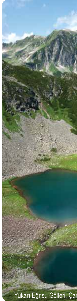
Yukarı Eğrisu Gölleri, Çamlıhemşin