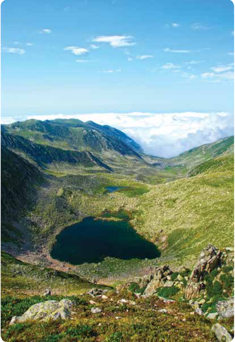
Kaçkar Gölü, Çamlıhemşin