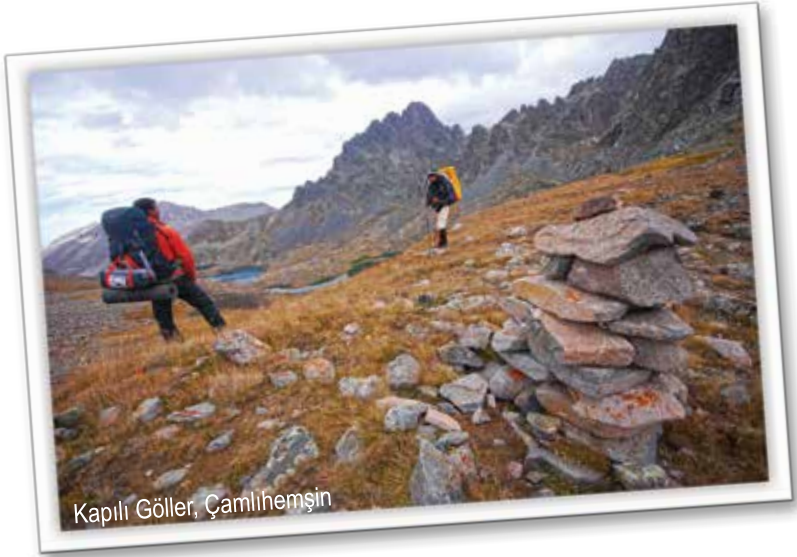
Kapılı Göller, Çamlıhemşin

Kuruyatak Yaylası, İkizdere'ye 27 kilometre uzaklıktaki Cimil Yaylası'nın 7 kilometre güneyine konumlanıyor. Yayla çıkışında dere yatağının solunu izleyerek güneydoğu istikametinde bulunan Çürük ve Şeytan göllerine çıkıyorsunuz. Dönüşte bu kez Çürük Göl'ün güneyinden dolaşarak yaylanın güneybatısında kalan Çitrik Gölü'ne yürüyeceksiniz. Bu gölün hemen üzerinde yer alan Derin Göl'e ulaşmak için fazladan gidiş-dönüş 2 kilometre yürümek zorundasınız. Dönüş yolunda bu kez derenin solundaki patikayı takip ederek yaylaya erişebilirsiniz.