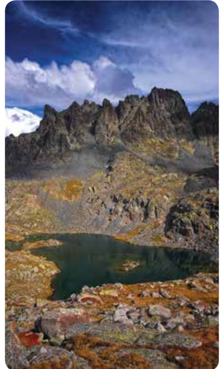
Kapılı Göller, Çamlıhemşin