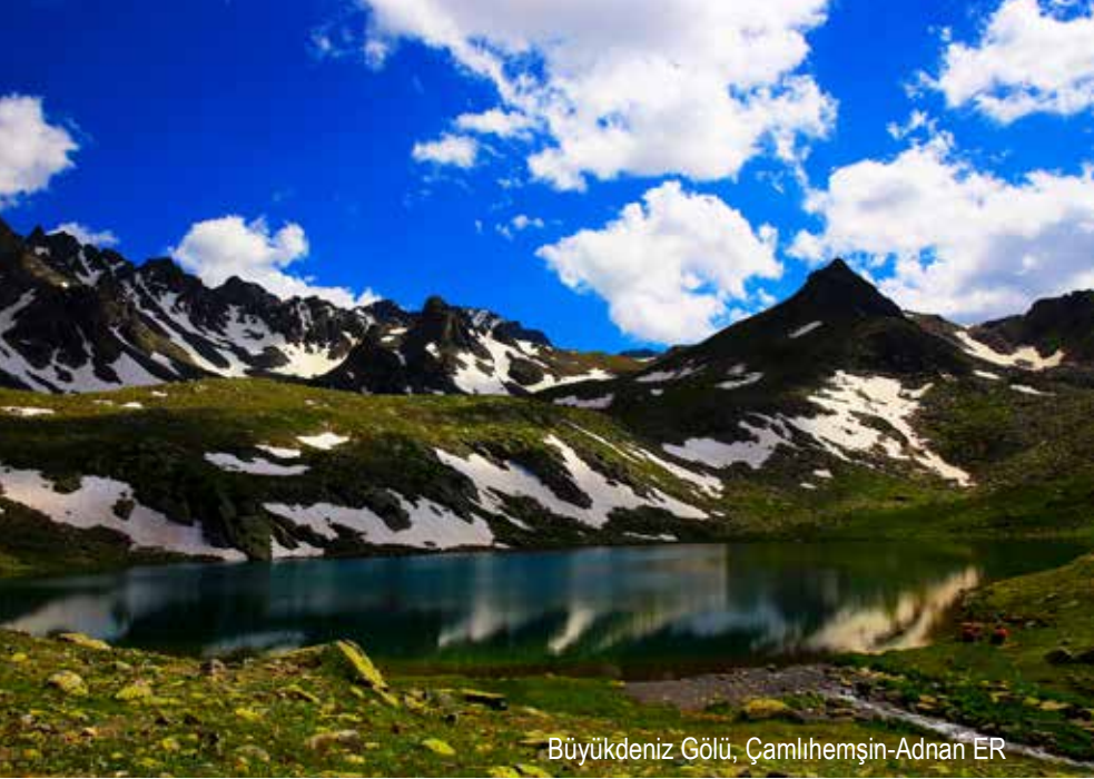
Büyükdeniz Gölü, Çamlıhemşin-Adnan ER