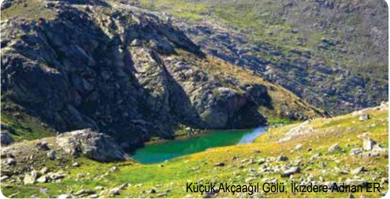
Küçük Akçaağıl Gölü, İkizdere-Adnan ER

Anzer Yaylası'na 10, Koşmer Yaylası'na ise yaklaşık 5 kilometre mesafedeki göl, Anzerdağı'nın doruklarına yakın bir yere konumlanıyor. 3027 metre yükseklikteki göle ulaşımın hayli zor olduğunu belirtelim. Koyun Gölü, Anzer Vadisi'nin sonunda, Akçaağıl Gölü'nün karşısındaki küçük vadinin içerisinde bulunuyor.