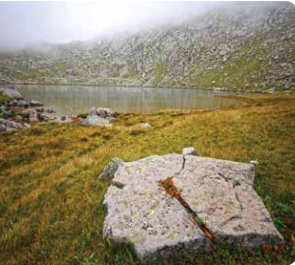
Şeytan Gölü, İkizdere

Çürük Göl'ün doğusunda yer alan Şeytan Gölü 2964 metre yükseklikte. Gölün kuzeyindeki Karaçağıl