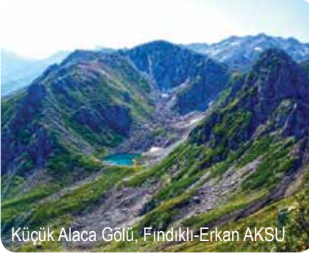
Küçük Alaca Gölü, Fındıklı-Erkan AKSU