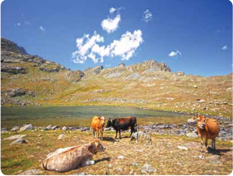
Ovit Dağbaşı Gölü, İkizdere