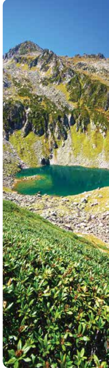
Göleteği Gölü, Ardeşen

Elinizdeki rehber kitap, ayrıntılı haritalar ve bölgede yaklaşık 9 yıllık bir yürüyüş deneyiminin yardımıyla hazırlanmıştır. Takdir edileceği üzere tüm göllere ulaşmak neredeyse olanaksızdır. Listede yer alan isimsiz göller ile takım gölleri hesaba katıldığında, Rize il sınırları içerisindeki buzul gölü sayısı 215'e yaklaşmaktadır.