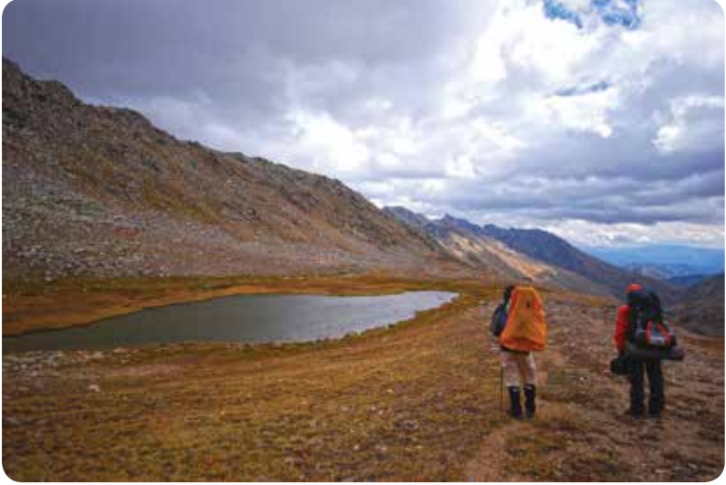
Atmeydanı Geçidi Gölü, İkizdere