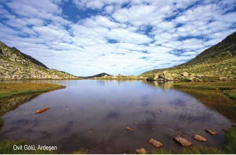
Ovit Gölü, Ardeően