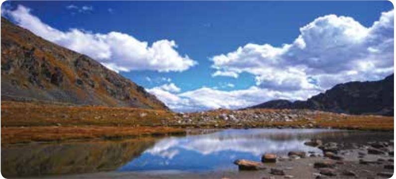
Korhuni Aşağı Göl, Çamlıhemşin

Mal Gölü'nün batısında kalan Deli Göl 3136 metre yüksekliktedir. Mal Gölü'nü ziyaret eden deneyimli dağcılar yürüyerek Deli Göl'e ulaşabilirler.