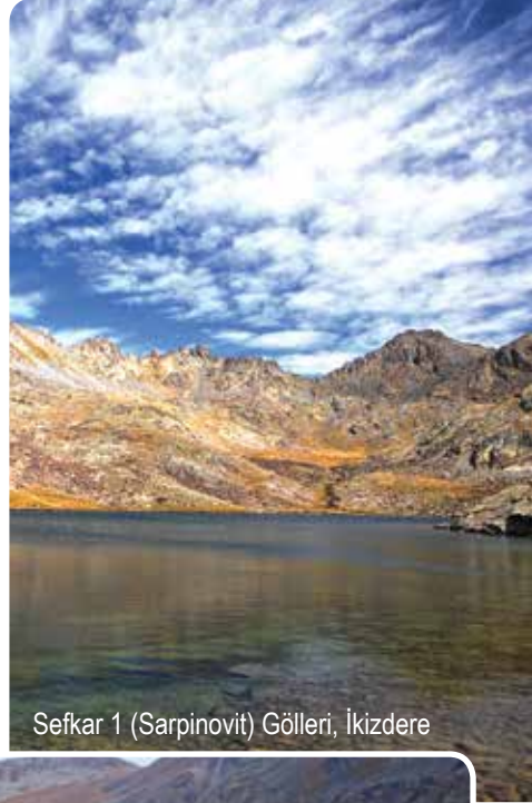
Sefkar 1 (Sarpinovit) Gölleri, İkizdere

Aksu Vadisi'nin kuzeyine konumlanan Sefkar Gölleri, Sarpinovit Vadisi'nde yer alıyor. Çapans Dağları'nın binlerce yıl önceki buzul döneminde oluşturduğu göller, ikisi üst biri alt düzlükte olmak üzere toplam üç adet. Suları Sarpinovit Deresi aracılığıyla önce Salar daha sonra da Cimil Deresi'ne karışır. 3137 metre yükseklikteki göllere ulaşmak için en kolay yöntem önce İkizdere ilçe merkezine 27 kilometre mesafedeki Cimil Yaylası'na gelmek. Yayla çıkışından sonra 4 kilometre kadar araçla devam edip Sarpinovit Vadisi'nin karşısında inerek göllere doğru yürümelisiniz. Aynı adlı yayladan geçen rota toplam 8 kilometre olduğundan, bu aktivite ancak kamplı olarak yapılabilir.