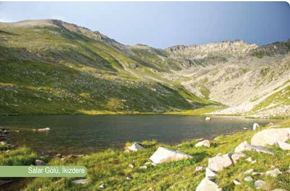
Salar Gölü, İkizdere

Cimil Yaylası'na yaklaşık 8 kilometrede mesafedeki Çermaniman Yaylası'nda yer alan göl 2844 metre yüksekliktedir. Bir zamanlar yaylacıların her yaz şenlendirdiği Çermaniman, ne yazık ki son yıllarda terk edilmiş durumda. Yaylanın kuzeyine konumlanan göle 45 dakikalık kolay bir yürüyüşle ulaşılabilir.