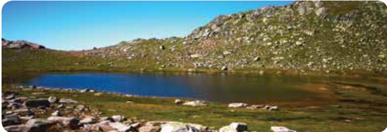
Üçgöller 3, Fındıklı