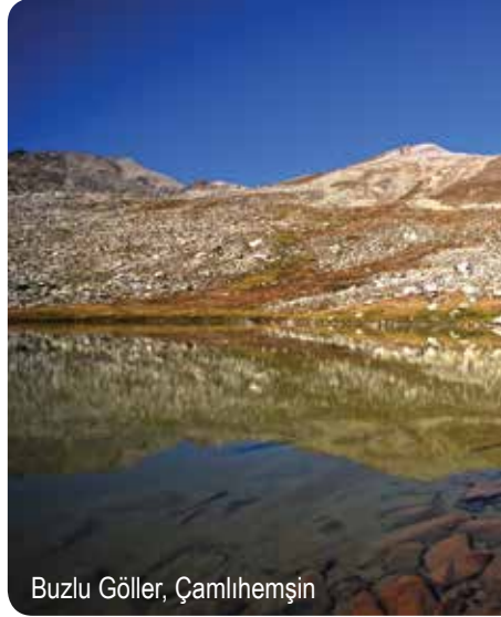
Buzlu Göller, Çamlıhemşin

Rize'nin en güzel göllerinden biri olan Çermeşk, yeşil-lacivert rengiyle görünenleri büyüler. Başköy Ortaklar Yaylası'na 3 kilometre mesafedeki Çermeşk Yaylası'ndan yürünerek ulaşılabilir. 2795 metre yükseklikteki göl, Çermeşk Yaylası-Çermeşk Gölü-Kevut Yaylası-Cimil Yaylası rotasını izleyen eski göç yolu üzerindedir. Çermeşk Gölü'nün güneyinde Karagöl ile birlikte üç göl daha görülebilir.