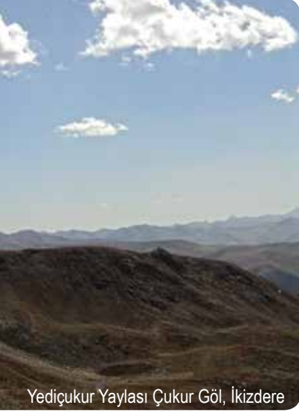
Yediçukur Yaylası Çukur Göl, İkizdere