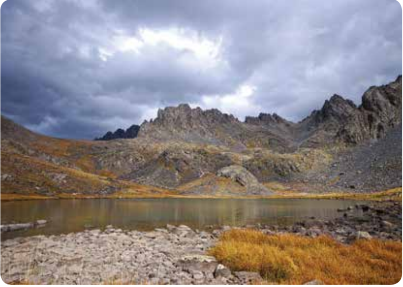
Korhuni Yukarı Göl, Çamlıhemşin