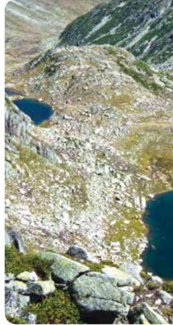
Dikdurg Gölü, Ardeşen

Tunca Vadisi'nin en sonunda yer alan İntor Yaylası'ndan ulaşılabilen bu büyük göl 2880 metre yükseklikte. Yaylaya yaklaşık 3 kilometre mesafedeki Hevek, sularını Kumlu Dere'ye aktararak Tunca Deresi'ni oluşturan akarsulardan biri aynı zamanda. Göle İntor Yaylası'ndan 3 kilometrelik bir yürüyüşle ulaşılabilir.