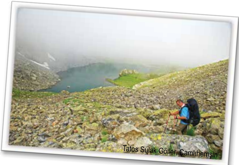
Tatos Sulak Göller, Çamlıhemşin

Çamlıhemşin ilçesine 48 kilometre mesafedeki Verçenik Yaylası bir buzul gölleri cenneti. Yayla çıkışlı yürüyüş güzergahları, farklı noktalarda yer alan saklı göllere uzanan serüven dolu bir yolculuk vadediyor konuklarına. Yaylaya 2 kilometre kala, araç yoluna sağdan gelen dere yatağı bu yürüyüş etkinliğinin başlangıç noktası olacak. Patikayı takip ederek 1,5 saatlik bir tırmanış sonrasında, dağların kuytu-luklarındaki Buzlu Göller'e ulaşacaksınız. Göllerden sonra, batıdaki aşığı geçerek Çermeşk Gölü'ne ve yaylasına kadar yürüyüşü uzatabilirsiniz.