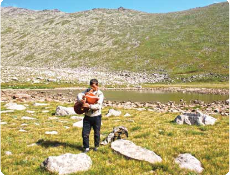
Çiçekli Göl, Çamlıhemşin