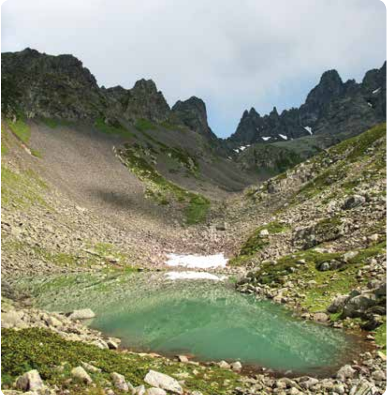
Soğanlı (Alaca) Gölleri, Ardeşen-Cografika Arşivi

Golezana Yaylası'ndan 2 saatlik bir yürüyüşle ulaşılabilen göller, Altıparmak Dağları'nın eteğine ardı ardına sıralanıyor. 2536 metre yükseklikteki göllerin bulunduğu yerden, Marselavat Vadisi'nin büyük bir bölümünü ve aşağıda yer alan Eğrisu (Ergiş) Gölü'nü fotoğraflamak mümkün.