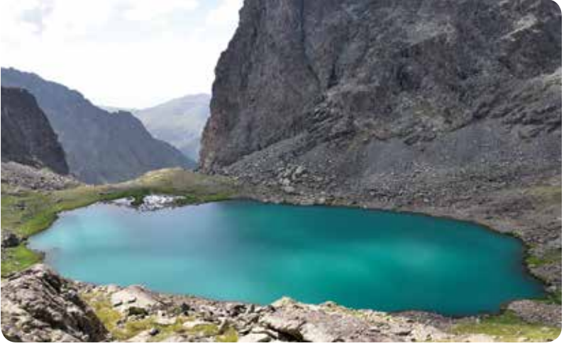
Deli Göl, Çamlıhemşin-Cografika Arşivi