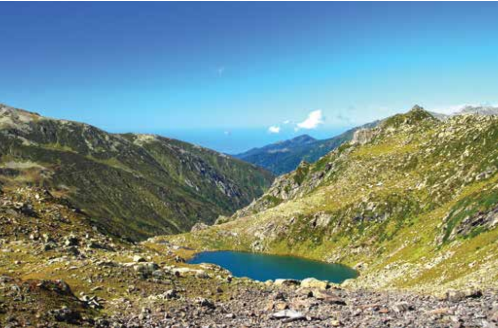
Ortasırsağ Gölü, ArdeŐen