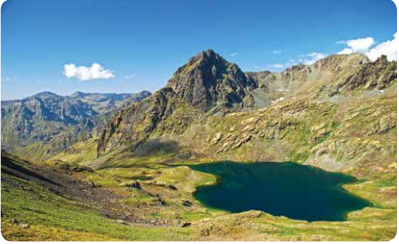
Mal Gölü, Çamlıhemşin