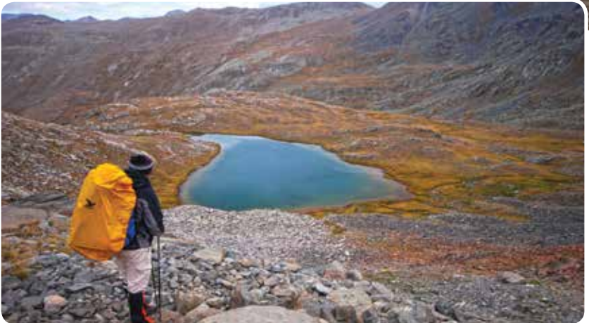
Sefkar 3 (Sarpinovit) Gölleri, İkizdere