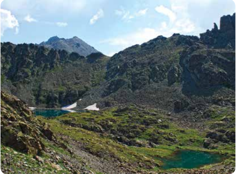
Tatos Derin Göl ve Tatos Gediği Gölü Çamlıhemşin

Çinaçor Gölleri'nin batısında yer alan Tatos Anadağ Gölü 3181 metre yükseklikte, Tatos zirvesine yakın bir noktadadır. Ulaşmak oldukça zordur.