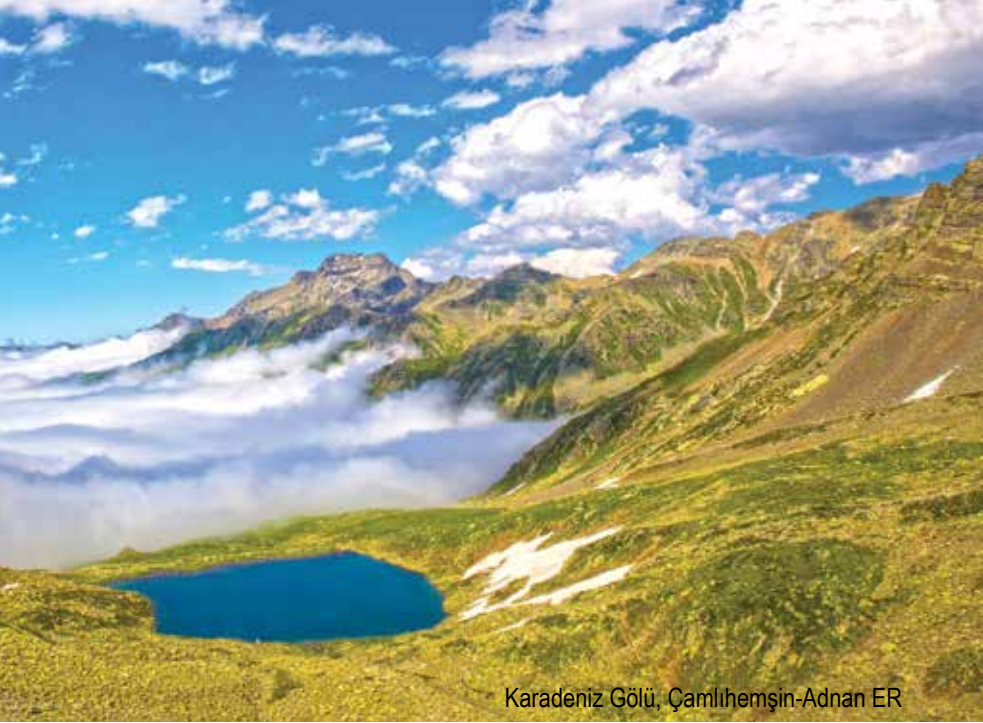
Karadeniz Gölü, Çamlıhemşin-Adnan ER