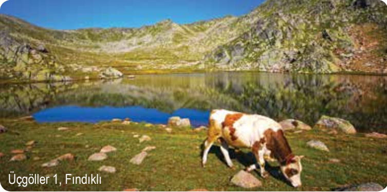
Üçgöller 1, Fındıklı

Sultan Yaylası'na yaklaşık 8 kilometre uzaklıktaki göl Alacayayla yakınlarında yer alıyor. 2848 metrelik Alacatepe'nin hemen altındaki gölün suları, İrmakbaşı Deresi aracılığıyla Çağlayan Vadisi'ne akıyor. Büyük Alaca, deniz seviyesinden 2674 metre yükseklikte.