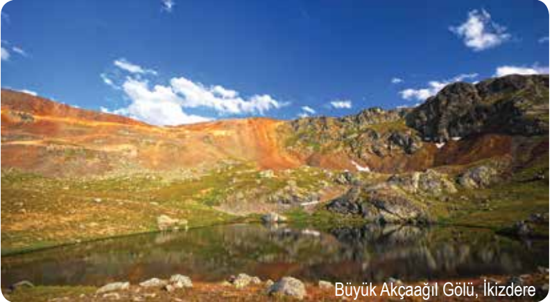
Büyük Akçaağıl Gölü, İkizdere

Anzer Yaylası'na 4 kilometre mesafedeki Koşmer Yaylası'ndan yürünerek ulaşılabilen göller 2800 metre yükseklikte. Bir kısmı taş merdiven döşeli bir patikadan çıkılan göllerin bulunduğu noktadan, önünüze serilen muhteşem manzarayı seyredebilirsiniz. Gölün suları, Kürdün Yurdu Yaylası'nın bulunduğu vadideki Kül-yurdu Deresi'ne akıyor.