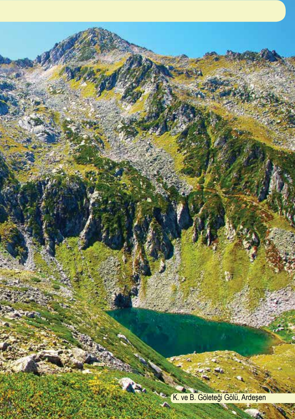
K. ve B. Göleteği Gölü, Ardeşen