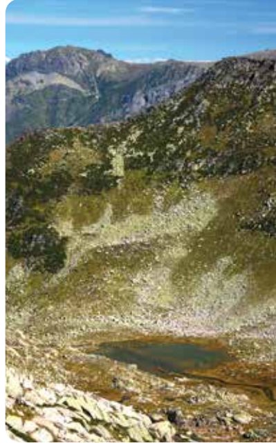
Şorak Gölü, Ardeşen

Kente göçten fazlasıyla etkilenen Şorak Yaylası, ne yazık ki terk edilmişliğin hüznünü yaşıyor şimdilerde. Kayadibi ve İntor yaylalarından eski patikalarla ulaşılan bu yaylanın hemen üzerinde aynı adlı göl bulunuyor. 1721 metre yükseklikte yer alan Şorak Gölü'nün yakınlarında birkaç minik gölcük daha var. Yayladan göle kolaylıkla yürüebilirsiniz.