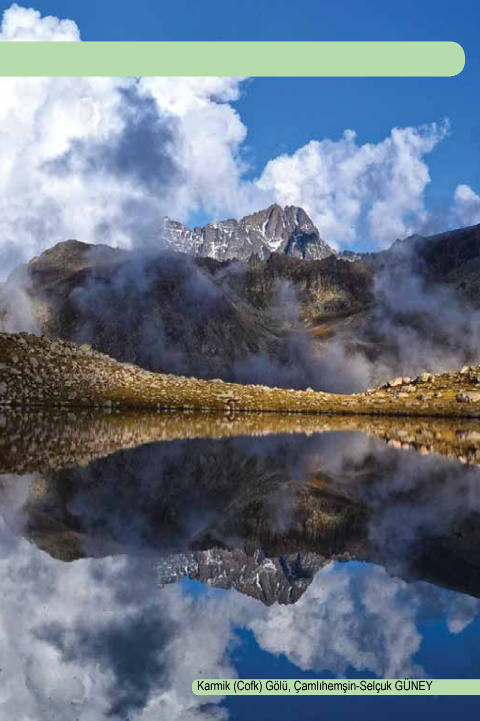
Karmik (Cofk) Gölü, Çamlıhemşin-Selçuk GÜNEY