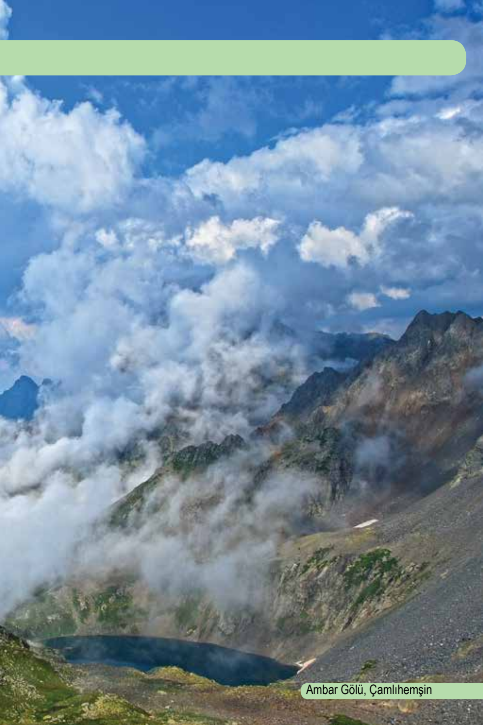
Ambar Gölü, Çamlıhemşin