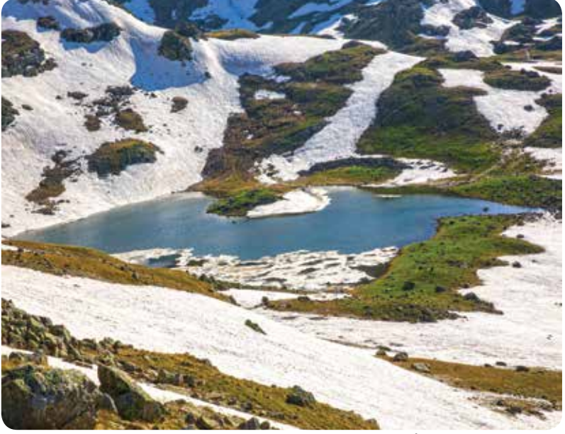
Ovit Dağbaşı Gölü, İkizdere-Adnan ER