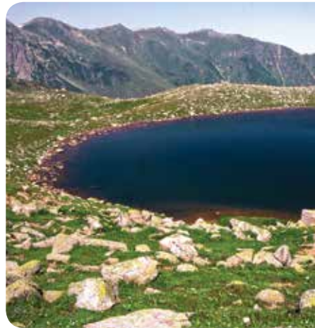
Kavron Adsız Göl, Çamlıhemşin

Çamlıhemşin ilçesine 31 kilometre mesafede bulunan Kavron Yaylası, doğaseverlerin outdoor aktiviteleri için tercih ettikleri bir yerleşim yeri. Bunun en önemli nedeni yaylanın etrafında pek çok buzul gölü ve trekking rotasının bulunması. 2907 metre yükseklikte yer alan Adsız Göl, Kavron Yaylası'na yaklaşık 3 kilometre mesafede.