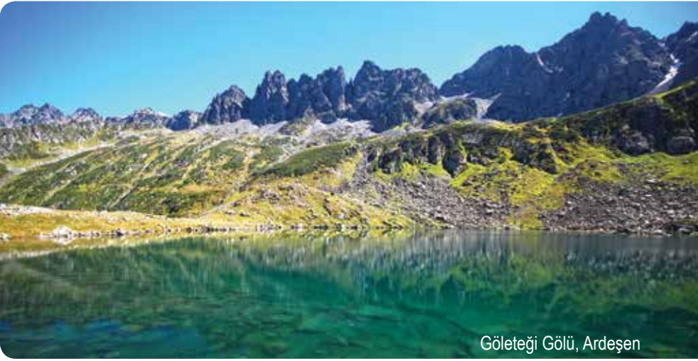
Göleteği Gölü, Ardeşen