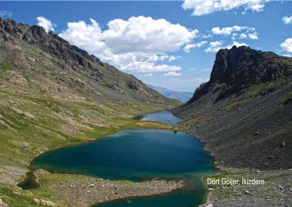
Dört Göller, İnkizdere

Yedigöller platosunun kuzeyine konumlanan bu iki göl 3078 metre yükseklikte. Yürüyüşçülerin sık sık uğradığı göller, Aksu Gölleri-Dört Göller-Yedigöller rotası üzerinde yer almasından dolayı önem taşıyor.