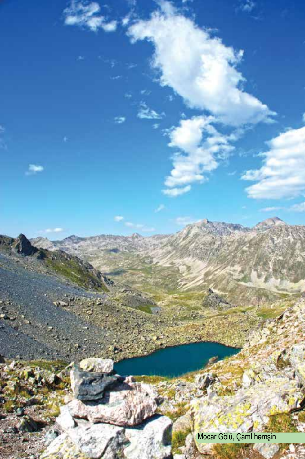
Mocar Gölü, Çamlıhemşin