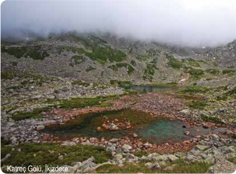
Katreç Gölü, İkizdere

Garzavan yakınlarındaki bir başka göl olan Katreç, 2717 metre yükseklikte yer alıyor. Suları Kireçli Deresi üzerinden Meles Çayı'na akıyor. Yayladan başlayıp dere boyunca güneye doğru ilerleyen toprak bir yol, göl yakınlarına kadar uzanıyor. Bu yolun aynı zamanda Soğanlı Gölü'ne ulaşmak için de kullanıldığını hatırlatalım. Yolun bittiği yerde başlayan belirgin patika 3 kilometrelik keyifli bir yürüyüş sonrasında konuklarını masmavi gölle buluşturuyor. Sarp dağların çevrelediği çanakta yer alan kocaman gölün etkileyici bir görüntüsü var.