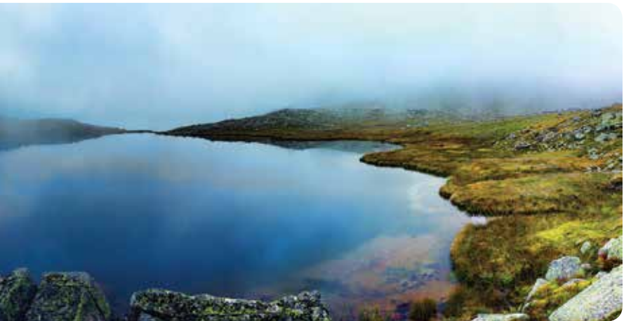
Tobamzga Gölü, Ardeşen Hüseyin ÇAĞLAYAN

Ardeşen ilçesine 46 kilometre mesafede, aynı adlı yaylanın yanı başındaki göl 2622 metre yükseklikte yer alıyor. Tobamzga Gölü Tunca Vadisi'ni yukardan seyreden bir manzaraya sahip. Rize'nin araçla ulaşılabilen göllerinden biri.