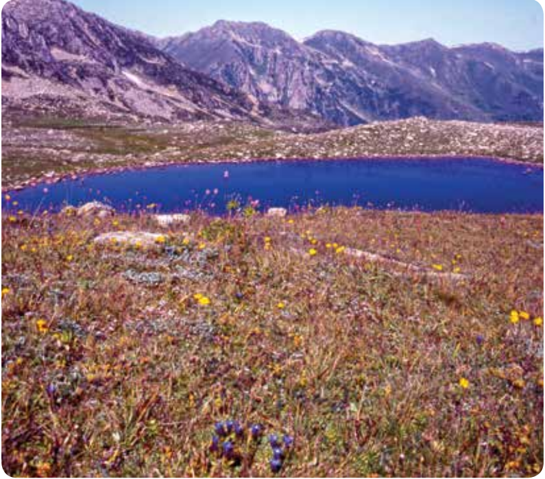
Kavron Adsız Göl, Çamlıhemşin