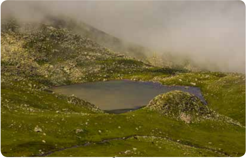
Öküzyatağı Gölü, Çamlıhemşin-Adnan ER