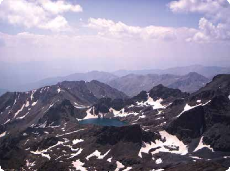
Deniz Gölü, Çamlıhemşin-Selçuk GÜNEY