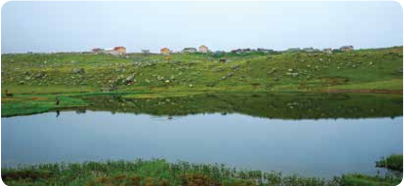
Koçdüzü Büyük Göl, Çamlıhemşin

Çamlıhemşin ilçe merkezine 42 kilometre uzaklıktaki Koçdüzü Yaylası, gölün neredeyse kıyısına kurulmuş durumda. 2382 metre yüksekliğindeki göl, Samayile Tepesi'nin eteklerindeki bir düzlüğe konumlanıyor. Yanından Koçdüzü-Didingola yolu geçiyor.