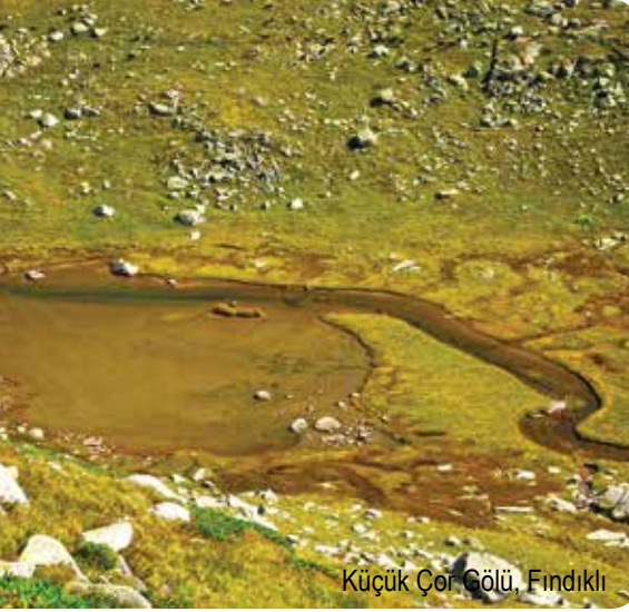
Küçük Çor Gölü, Fındıklı