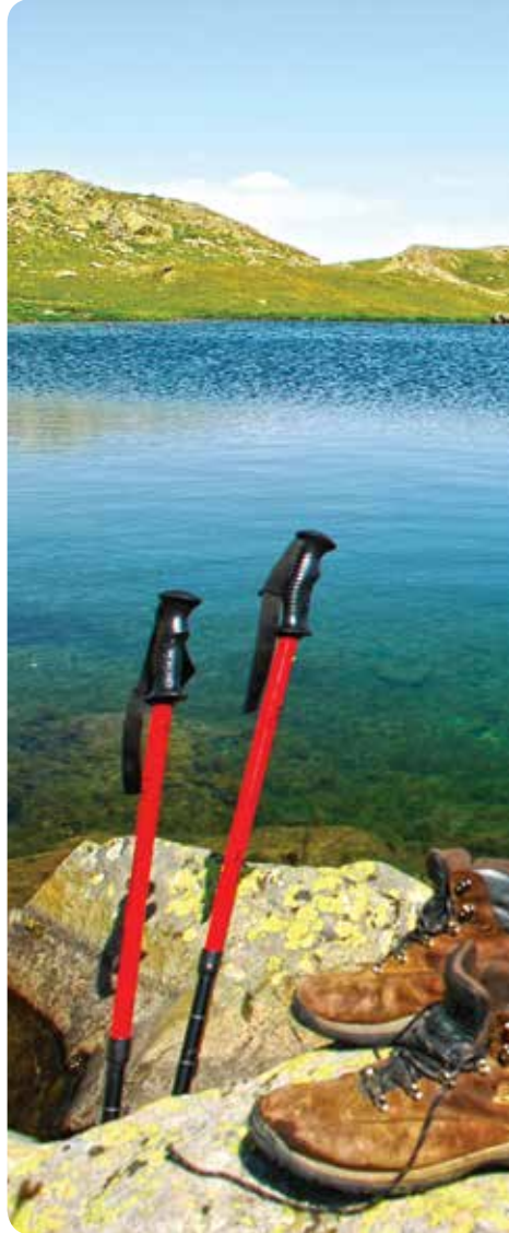
Balıklı Göl, Çamlıhemşin

Balıklı Göl'ün doğusunda yer alan göl, aynı adlı dağın yamaçlarına konumlanır. Fırtına Vadisi'ne bakan gölün suları, Varyemez ve Hemşin Dereleri aracılığıyla Fırtına Deresi'ne karışır. 2833 metre yüksekliğindeki Akçar, Çat-Kaleköy yolundaki Sebekdüzü mevkinin hemen üzerindedir.