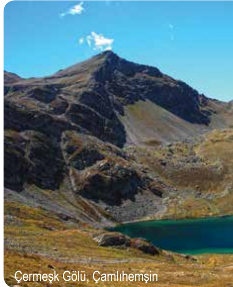
Çermeşk Gölü, Çamlıhemşin