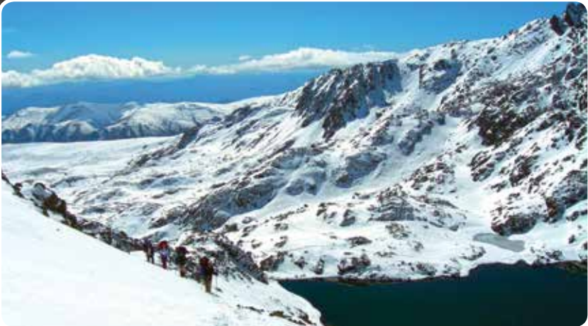
Sefkar 2 (Sarpinovit) Gölleri, İkizdere Selçuk GÜNEY

Kuruyatak Gölü'nün bulunduğu aynı adlı vadinin sonunda yer alan Çapans Dağları'nın düzlüklerinde, dört adet buzul gölü daha var. En batıda yer alan Derin Göl 3108 metre yüksekliğe konumlanıyor. Kuruyatak Yaylası'ndan açık bir havada 2 saatlik bir yürüyüşle göle ulaşılabilir.