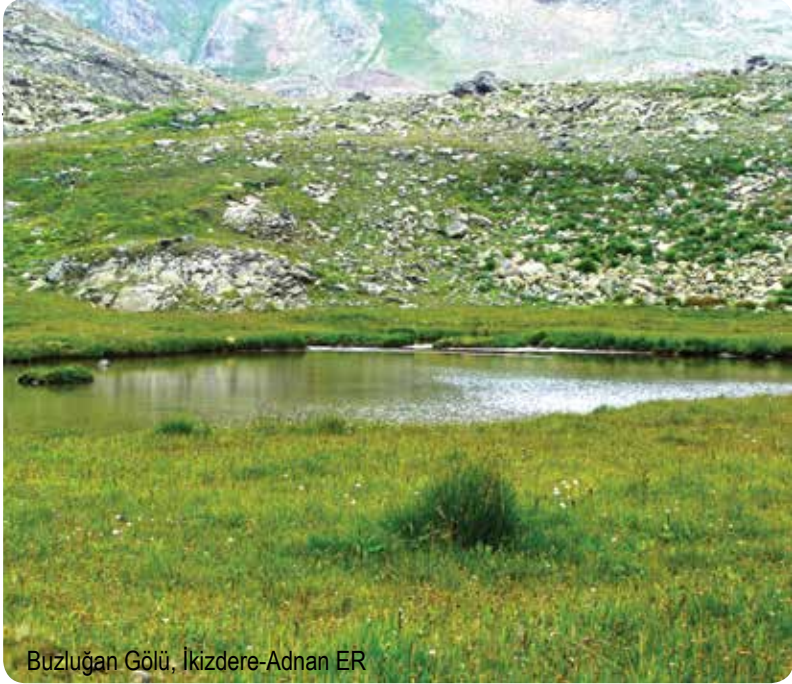
Buzluğan Gölü, İkizdere-Adnan ER

Anzer Yaylası-Yoncalı Köyü (Bayburt) arasındaki yolun kenarına konumlanan Büyük Akçaağıl Gölü, Rize'nin kolay ulaşılabilen doğal mekanlarından biri. 2947 metre yükseklikteki göl, Hakosorbaşı Tepesi'nin altında yer alıyor.