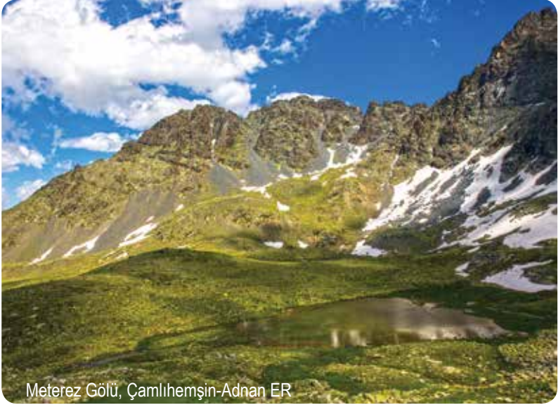
Meterez Gölü, Çamlıhemşin

Büyükdeniz Gölü'nün güneyinde yer alan Meterez Gölü, aslında biri büyük diğeri küçük iki gölden oluşuyor. Sularını Büyükdeniz Gölü'ne yollayan Meterez, 3150 metre yüksekliğe konumlanıyor. Açık havalarda sıkı bir yürüyüşle, Öküzyatağı Gölü'nün yanından geçip Kavron Yaylası üzerinden göle ulaşabilirsiniz.