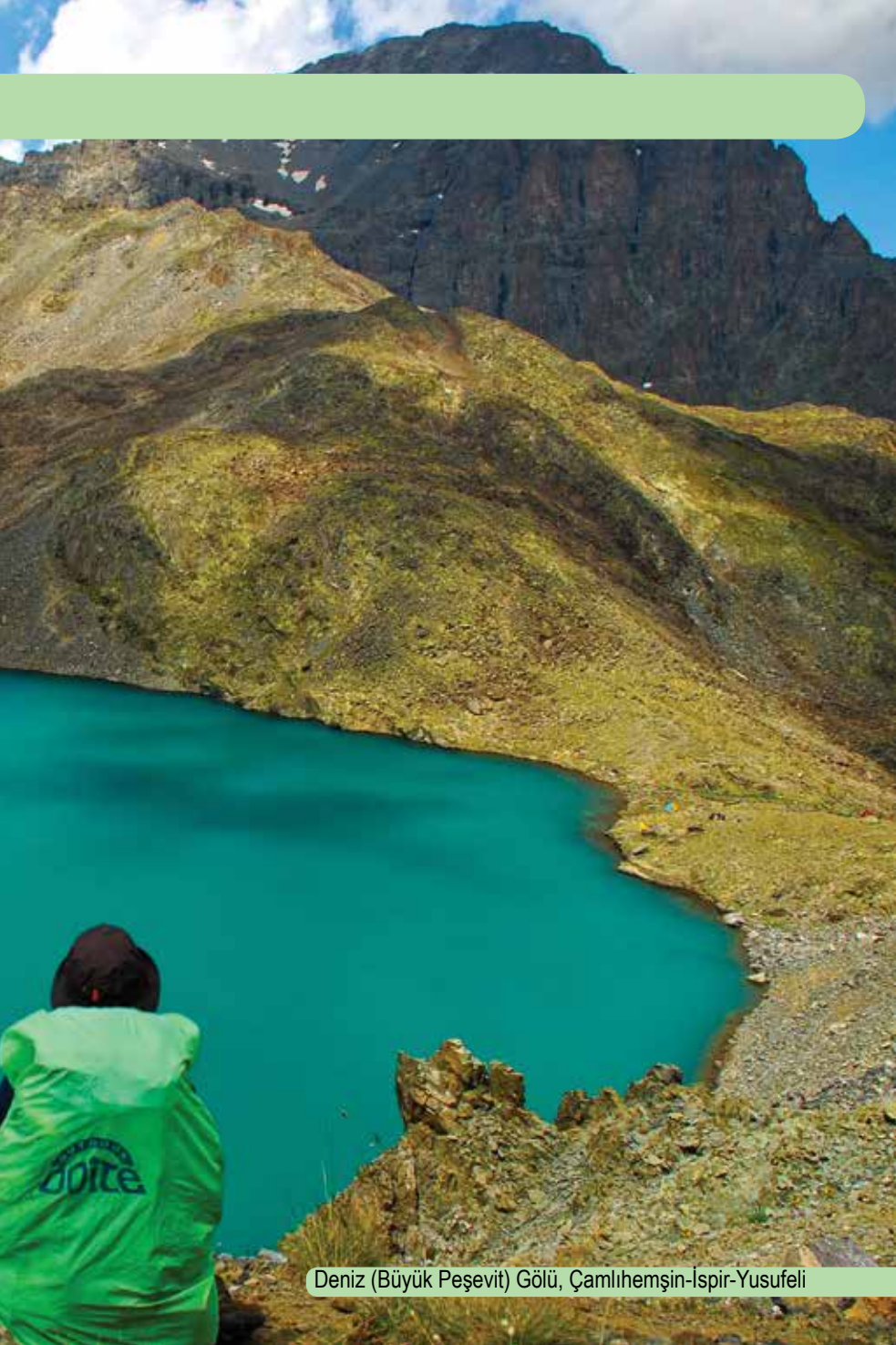
Deniz (Büyük Peşevit) Gölü, Çamlıhemşin-İspir-Yusufeli