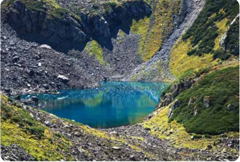
Küçük Göleteđi Gölü, Ardeően