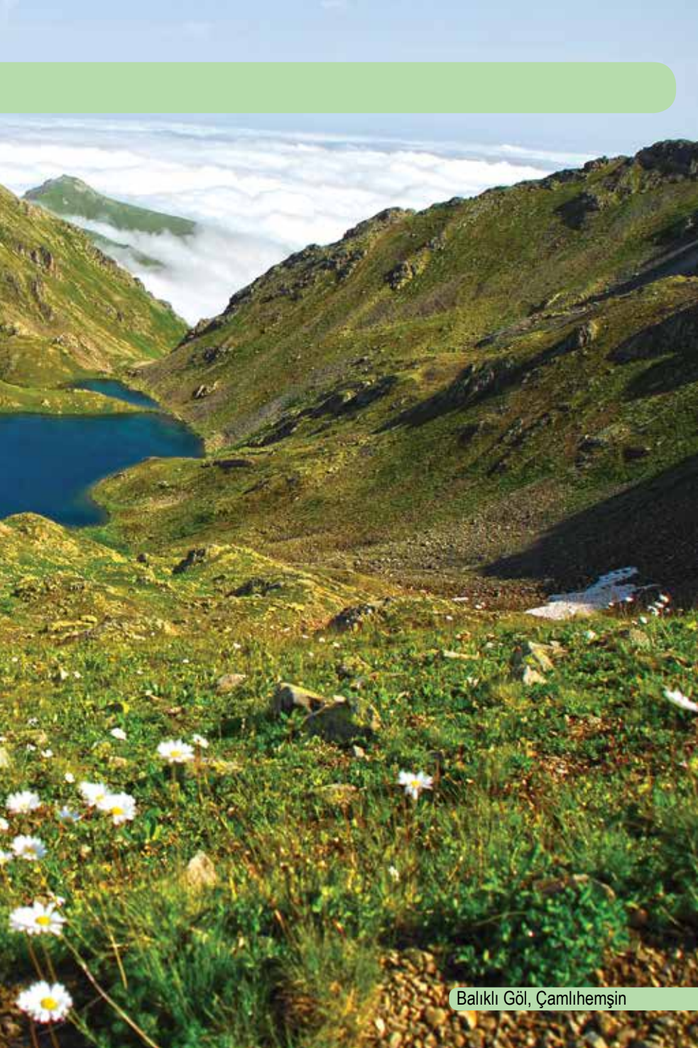
Balıklı Göl, Çamlıhemşin