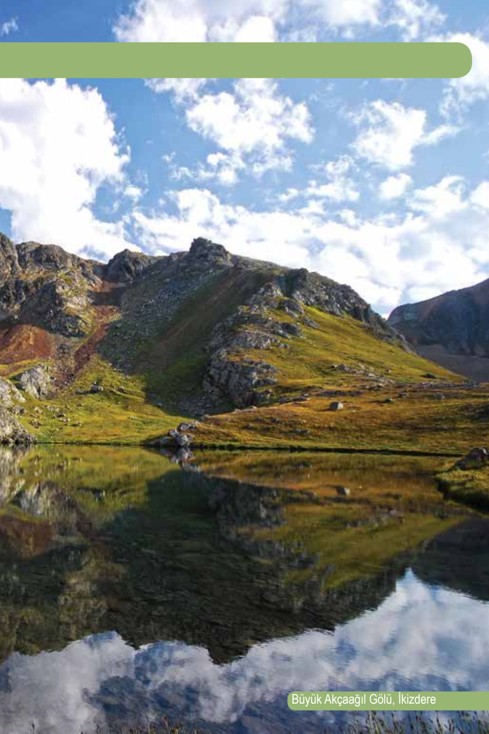
Büyük Akçaağılı Gölü, İkizdere