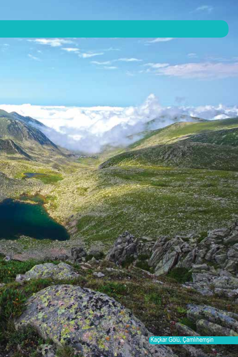
Kaçkar Gölü, Çamlıhemşin