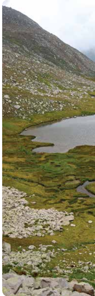
Cimil Çürük Göl, İkizdere