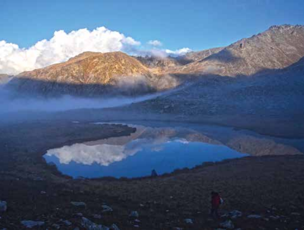
Zincirli Göl, Çamlıhemşin-Selçuk GÜNEY

Çamlıhemşin ilçesine 45 kilometre uzaklıktaki Başköy Yaylası yakınlarında yer alan göl, 3459 metre yüksekliğindeki Yaz Dağı'nın doruklarına konumlanıyor. 3060 metre rakımdaki gölün suları Hacıvanak Vadisi'ndeki aynı adlı dereye karışıyor. Ulaşılması oldukça zor göllerden biridir.