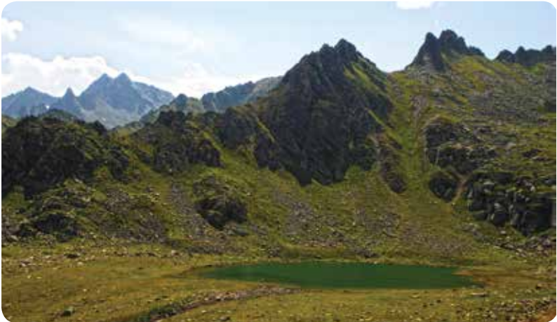
Micovit (Mezovit) Gölü, Çamlıhemşin

Çiçekli Yayla Ortasirt mahallesinin yakınlarındaki göl, vadinin sağ yamacına konumlanıyor. Dilek ile Tatos dağları arasında bulunan Yıldız Gölü 2837 metre yüksekliktedir. Yaylaya yaklaşık 5 kilometre mesafede, sarp yamaçlarla çevrili bir mevkiye yer alan gölün suları Çiçekli Deresi'ne akıyor.