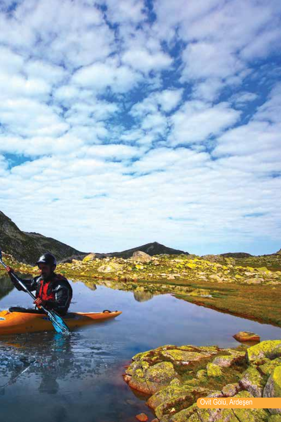
Ovit Gölü, Ardeşen