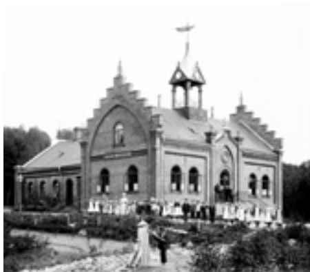
Skolan på 1890-talet

Denna första skolbyggnad bestod av två lärosalar och två lärarbostäder. Barnantalet steg emellertid. Skolan utöka-