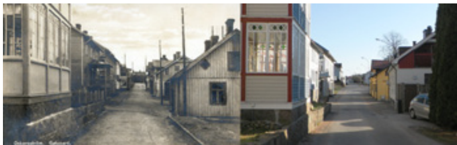
Köpmansgatan i riktning syd. Vänstra bilden är ifrån början av 1900-talet, huset närmast till höger var ett bryggeri. Högra bilden tagen från samma plats 2011.

Under första halvan av 1900-talet fanns här pappershandel, livsmedelsbutik, charkuterier, skomakare, manufaktur, mjölkbutik, bageri, frisör, bryggeri, klädesbutik m.m. Några av fastigheterna är rivna, en del ersatta av andra byggnader.