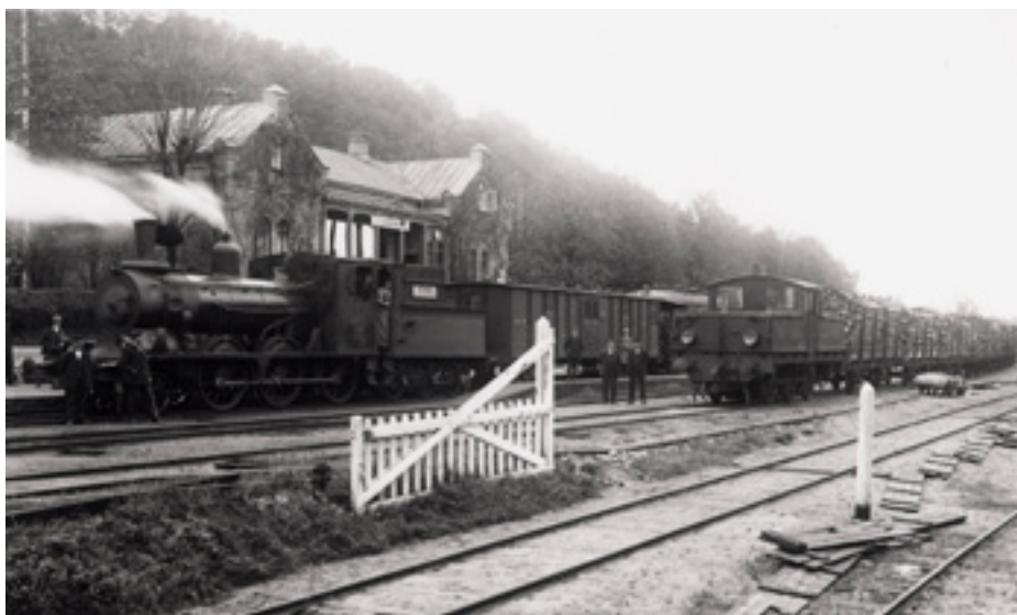
Sulfitens lilla lok drar massaved till fabriken.