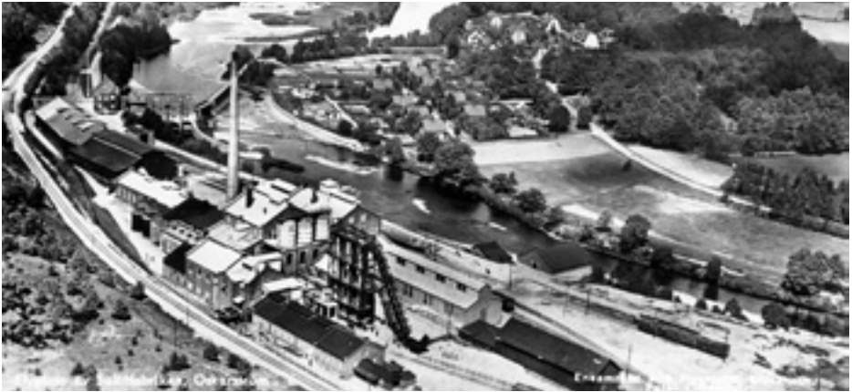
Fabriken och kraftverket

1958 var uppe i 30 000 ton lättblekande sulfitmassa per år. Ca 90% gick på export. Sulfitfabriken hade eget ellok, som drog järnvägsvagnar till och från järnvägsstationen och skötte också transporter åt Jutefabriken. Längs Sveagatan syns rester av banvallen. I början av 1966 lades produktionen ner och redan efter ett halvår var Ry AB igång med spånskivetillverkning. 40% av produktionen gick på export. Spånskivetillverkningen varade till 1984. 1987 flyttade Sprinter Pack AB in i lokalerna. Sprinter Pack tillverkade förpackningsmaskiner. Redan efter ett par år var det kris och Sprinter Pack köptes av ett norskt bolag som fortsatte driften under namnet Printer Emballage fram till i början av 1990-talet. Idag finns här bl. a. snickeriverkstad, bilbingo! m.m.