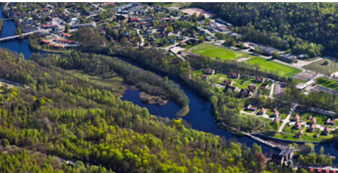
Södra delen av Oskarström med nedre kraftverket till höger i bild.

Denna guide är framtagen som en del av projektet Industrihistoria i Nissadalen. Detta projekt syftar till att stärka området som turistmål och skapa fler arbetstillfällen för bygden genom att ta tillvara på och synliggöra den unika industrihistoria som finns i området och utveckla paket kring besöksmål och företeelser med denna industrihistoria som bas.