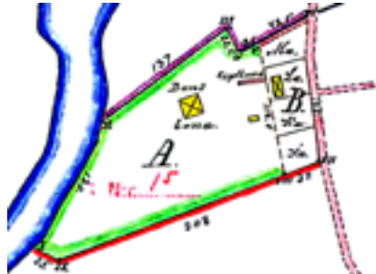
Karta öfver lägenheter afsöndrade från 3/8 mantal Espered N:o 1, upprättad år 1901