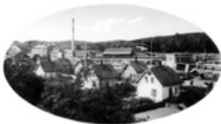
De äldsta bostäderna med fabriken i bakgrunden.

Småvillorna, som ligger närmast Nissan, byggdes redan 1905-1906, alltså samtidigt eller före fabriken. Husen hade från början 4 lägenheter var om ett rum och kök men byggdes sedan om till 2 lägenheter per hus. Två större arbetarbostäder uppfördes under åren 1908 – 1910 och hade på bottenvåningen 4 lägenheter om ett rum och kök och på övervåningen 2 st tvårumslägenheter. Dessa två hus fick i folkmun namn efter de beryktade fångvårdsanstalterna "Långholmen" och "Svartsjö".