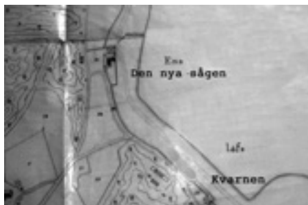
Kvarnen i södra delen och sågverket i norra delen

Fabriken flyttades redan 1888 till Dragvägen i Halmstad. 1889-90 byggdes kanalen och jutefabriken. Byggnaderna användes under ett antal år som personalbostäder och bageri.