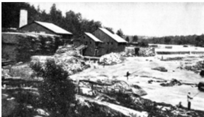
Sågen och det senare byggda svarveriet. Snett upp till höger skymtar skibordsdammen.