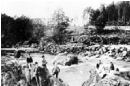
Resterna av kvarnen 1890- talet. Höljen nedanför till vänster.