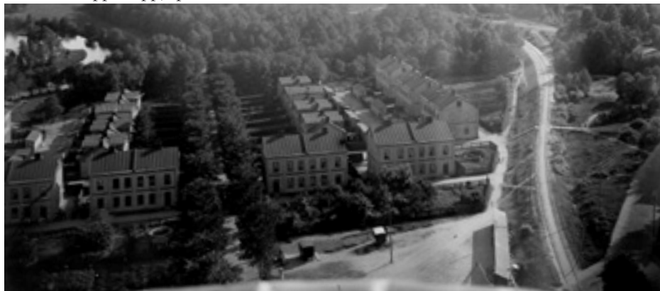
"Lågkasernerna" närmast Allégatan (Kolgatan). De fyra sist byggda utmed Brogatan är ej byggda när denna bild togs.