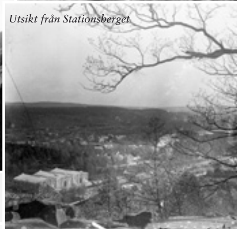
Utsikt från Stationsberget