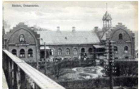
Här har den norra flygeln byggts till, några år in på 1900-talet

Maredsskolan användes som skola fram till 1977, därefter har byggnaden använts som fritidsgård. Under de senaste åren har skolan stått oanvänd på grund av skador.