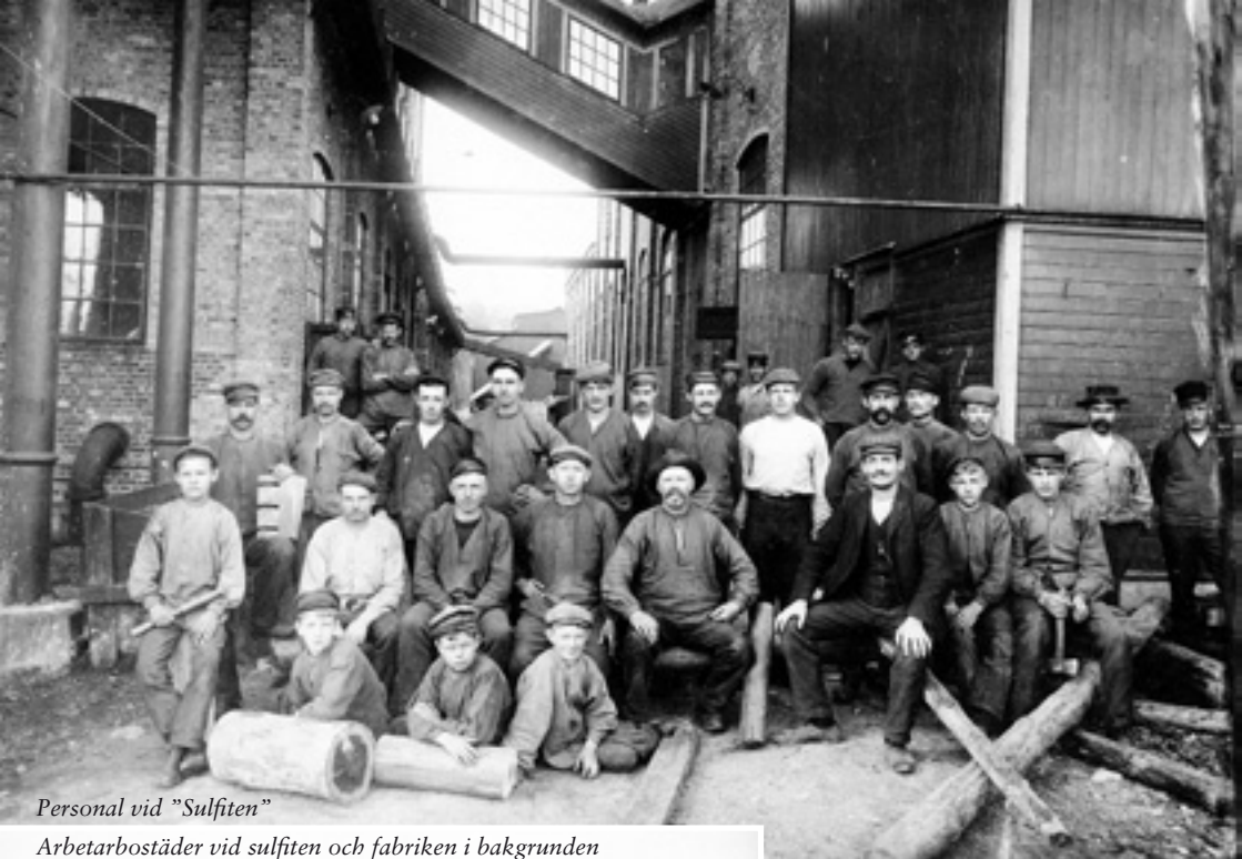
Personal vid "Sulfiten"