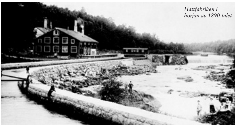
Hattfabriken i början av 1890-talet