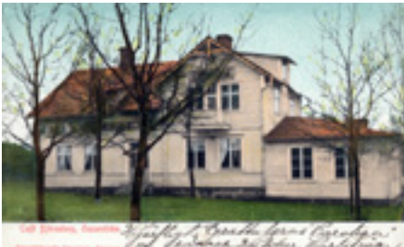
Björnstorp någon gång under första hälften av 1900-talet.