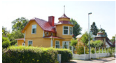
Arkadiegatan med de två tornhusen