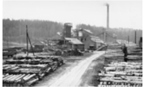
Massavedsupplaget, bilden tagen söderifrån

1958 var uppe i 30 000 ton lättblekande sulfitmassa per år. Ca 90% gick på export. Sulfitfabriken hade eget ellok, som drog järnvägsvagnar till och från järnvägsstationen och skötte också transporter åt Jutefabriken. Längs Sveagatan syns rester av banvallen. I början av 1966 lades produktionen ner och redan efter ett halvår var Ry AB igång med spånskivetillverkning. 40% av produktionen gick på export. Spånskivetillverkningen varade till 1984. 1987 flyttade Sprinter Pack AB in i lokalerna. Sprinter Pack tillverkade förpackningsmaskiner. Redan efter ett par år var det kris och Sprinter Pack köptes av ett norskt bolag som fortsatte driften under namnet Printer Emballage fram till i början av 1990-talet. Idag finns här bl. a. snickeriverkstad, bilbingo! m.m.