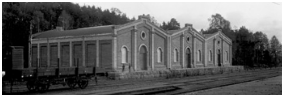
De tre äldsta magasinerna från 1894 och 1896. De yngre magasinerna från 1938 byggdes bakom järnvägsvagnen.

nationen om man upplät utrymmen för lagring av viktiga råvaror. Här förvarades under krigsåren bl a rågummi.