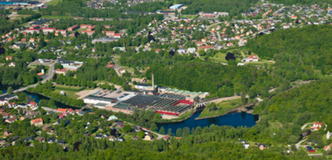
Johns Manville fd. Skandinaviska Jutefabriken, Oskarström