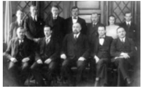
Tjänstemän vid Sulfiten