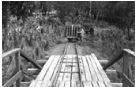
Industrispåret, med vars hjälp man fraktade rötat lin över Nissan. Lintillverknigen startade 1896.

vid, t.ex. jutefilt och juteväv för linoleum-mattor. Mot slutet av 1950 kom jutetape-terna, som sedan blev en stor framgång.