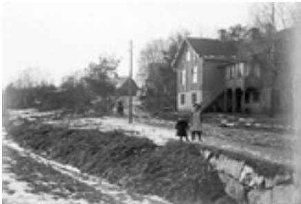
Bruksgatan. Längst upp skimtar diversehandeln. Byggnaden till höger innehöll ett wienerbageri.