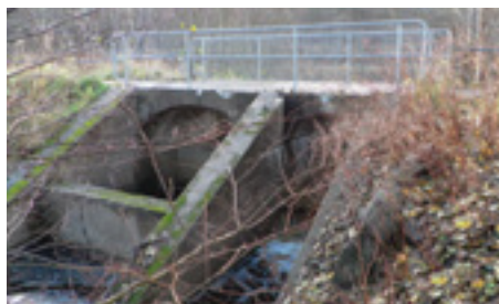
Laxtrappan som bolaget ålades att bygga.

tenfylld på grund av uppdämningen vid kraftverket. Här betade förr kor från närbelägna gårdar. När isen hade lagt sig på den vattenfyllda Ängen blev den en livligt frekventerad skridskobana.