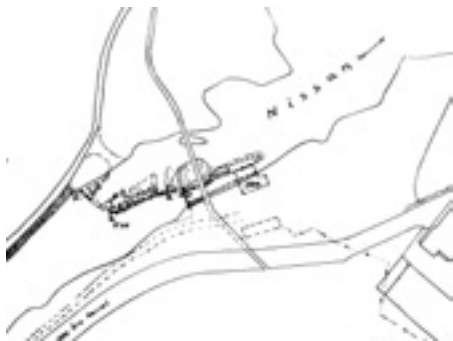
Mareds tullkvarn. Höljen upp till höger på kartan