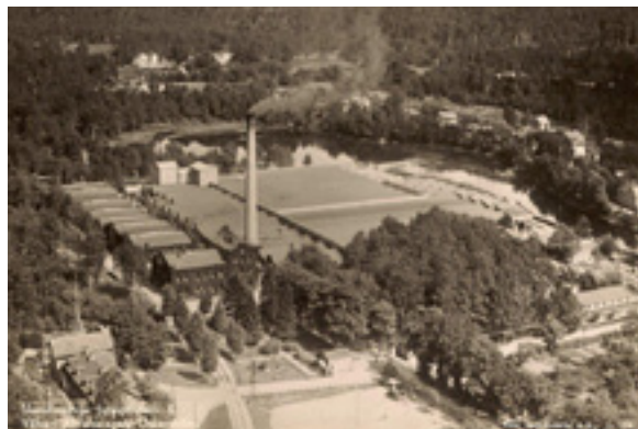
Flygbild tagen från sydväst med Nissan och Höljen i bakgrunden, 1930-talet.

1916 fick man svårigheter att importera jute från Indien. Då använde man sig under några år av kraftpapper som råvara och började spinna pappersgarn och framställa pappersvävnader. Under åren 1919-1921 låg juteproduktionen i huvudsak nere på grund hård tysk konkurrens. Man sysselsatte arbetarna med bl a skogsplantering och skogsröjning i de egna skogarna. Även under andra världskriget kunde man inte importera jute, varför man fick övergå till att spinna och väva papper. Under 1950-talet minskade säckväven i betydelse och andra produkter tog