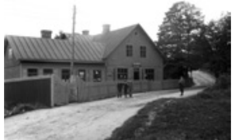
Fabrikens diversehandel / brukshandel

En del av lönen erhöles i form av någon slags livsmedelscheckar, med vilka man kunde betala sina varor. 1925 övertogs affären av Oskarströms kooperativa han-