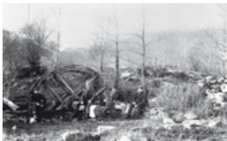
Resterna av kvarnen omkring 1890