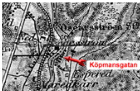
Generalstabskarta, tryckt år 1903

När Jutfabriken startade 1890 uppstod ett stort behov av byggnation av såväl bostäder som affärer, byggnader för hantverkare och annan serviceverksamhet. Från Esperedsgården avstyckades den ena tomten efter den andra. De flesta husen på Köpmansgatan byggdes på 1890-talet. Som framgår av generalstabskartan, tryckt 1903, var de flesta tomterna bebyggda vid denna tidpunkt.