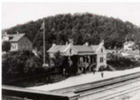
1903 - Unionsflaggan är hissad

Nuvarande järnvägsstationen uppfördes på 1880-talet. I samband med Jutfabrikens byggnation 1888-1889 byggdes stickspår ner till fabriken, 1907 var spår också byggt ner till Sulfitfabriken. Med den omgivande bebyggelsen uppstod ett stationssamhälle, som dock var delat på de två socknarna Slättåkra och Enslöv.