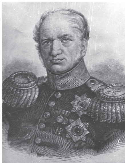
Е.Ф. Канкрин ( 1774—1845)