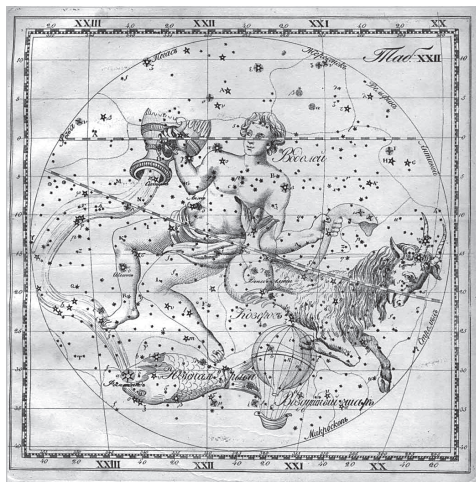
Рейссиг К.Х. Атлас звездного неба. Фрагмент