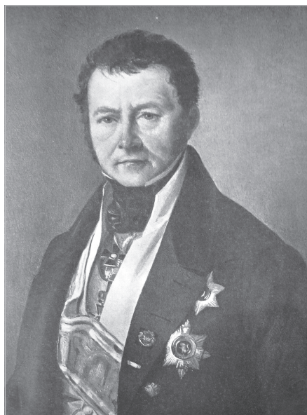
К.Х. Рейссиг (1781—1860)