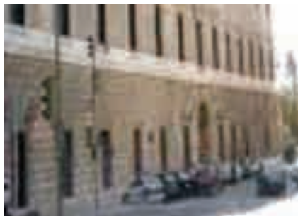
Palacio Legislativo de la Aduana (Casas Consistoriales) Plaza de la Paz s/n.