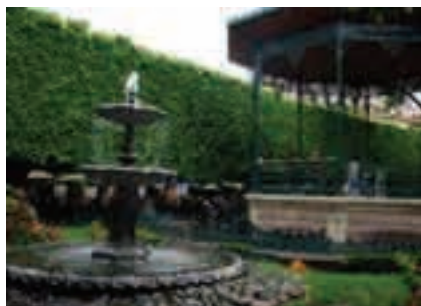
Jardín de la Unión Av. Cantarranas esquina Sopeña.

La traza urbana de la ciudad le da a este jardín una inusual forma triangular, que le ha valido la comparación con una rebanada de queso. Desde mediados del siglo XVIII es uno de los puntos de reunión predilectos de los guanajuatenses, que también la usaron en el pasado como plaza del mercado y para los bailes populares.