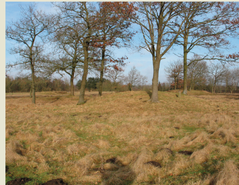
Kongehøjene i Bramming.