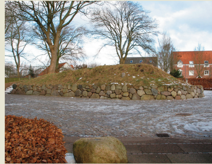
Gravhøj i Bramming. 3 sogneskel mødes ved denne gravhøj.

Projektet er støttet af EU under Interreg IIIB.