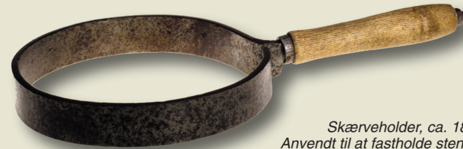
Skærveholder, ca. 1890-1920. Anvendt til at fastholde sten, der med hammer knustes til skærver til vejbelægning. Brugt på Bramming-egnen.