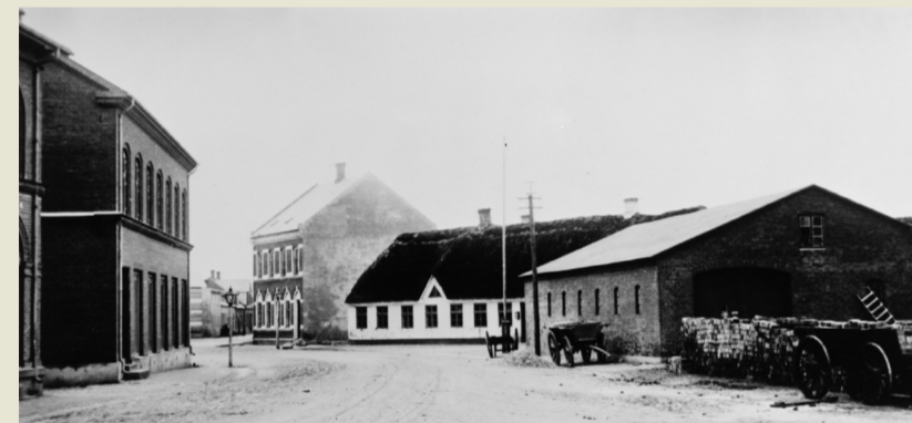
Kikkenborg Kro med nyere rejsestald, ca. 1895.