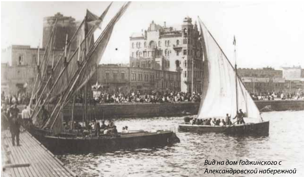
Вид на дом Гаджинского с Александровской набережной