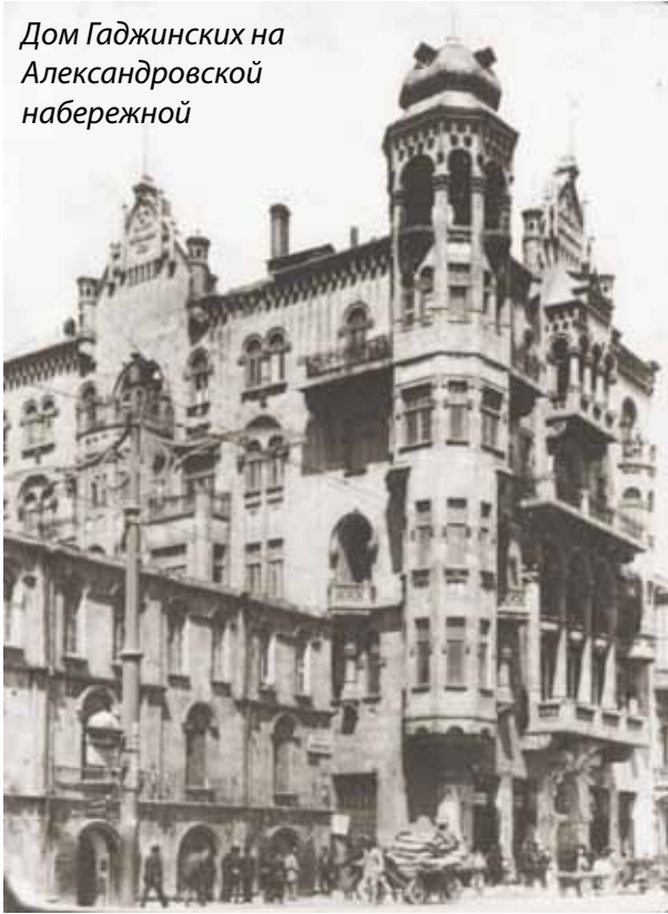
Дом Гаджинских на Александровской набережной

чатление и словно переносят нас в некий сказочный мир. Неуемная фантазия владельца, тонкий вкус архитектора и добротность исполнения создали подлинный шедевр чисто бакинской архитектуры, сумевшей вобрать в себя и органично синтезировать влияния самых различных культур.