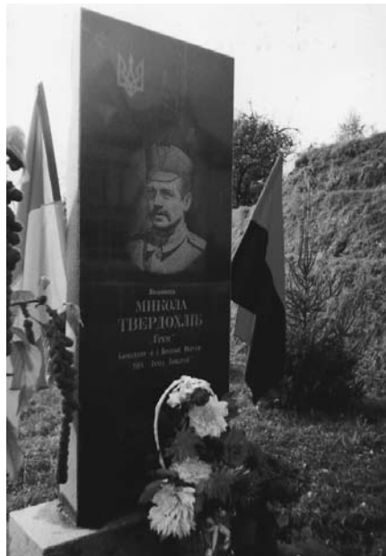
Пам'ятник М. Твердохлібу – «Грому» у с. Петрилів.