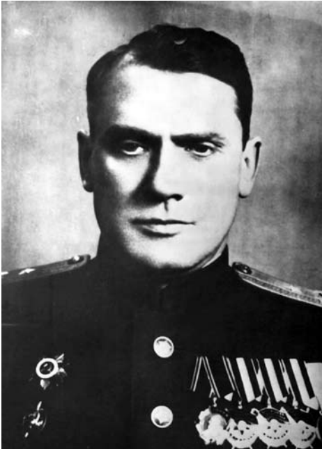
Полковник МГБ Арсеній Костенко, начальник управління 2-Н УМГБ у Станіславівській області.