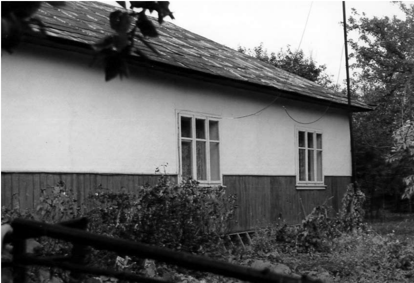
Родинна хата Твердохлібів у с. Петрилів.