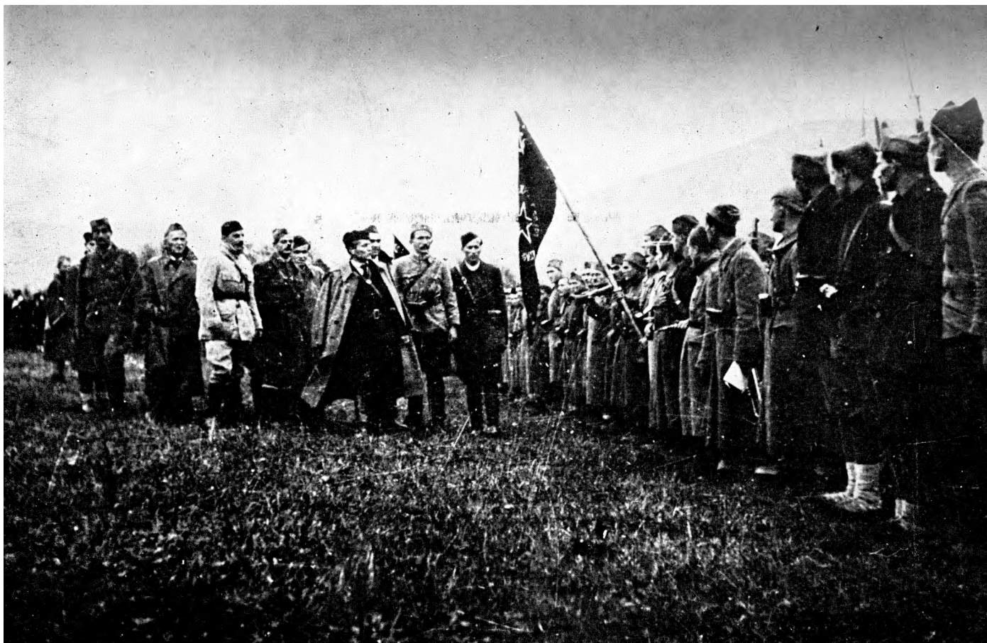
Drug Tito vrši smotru Prve proleterske bigade, prilikom predaje zastave ovoj proslavljenoj brigadi u Bosanskom Petrovcu 7. novembra 1942. godine