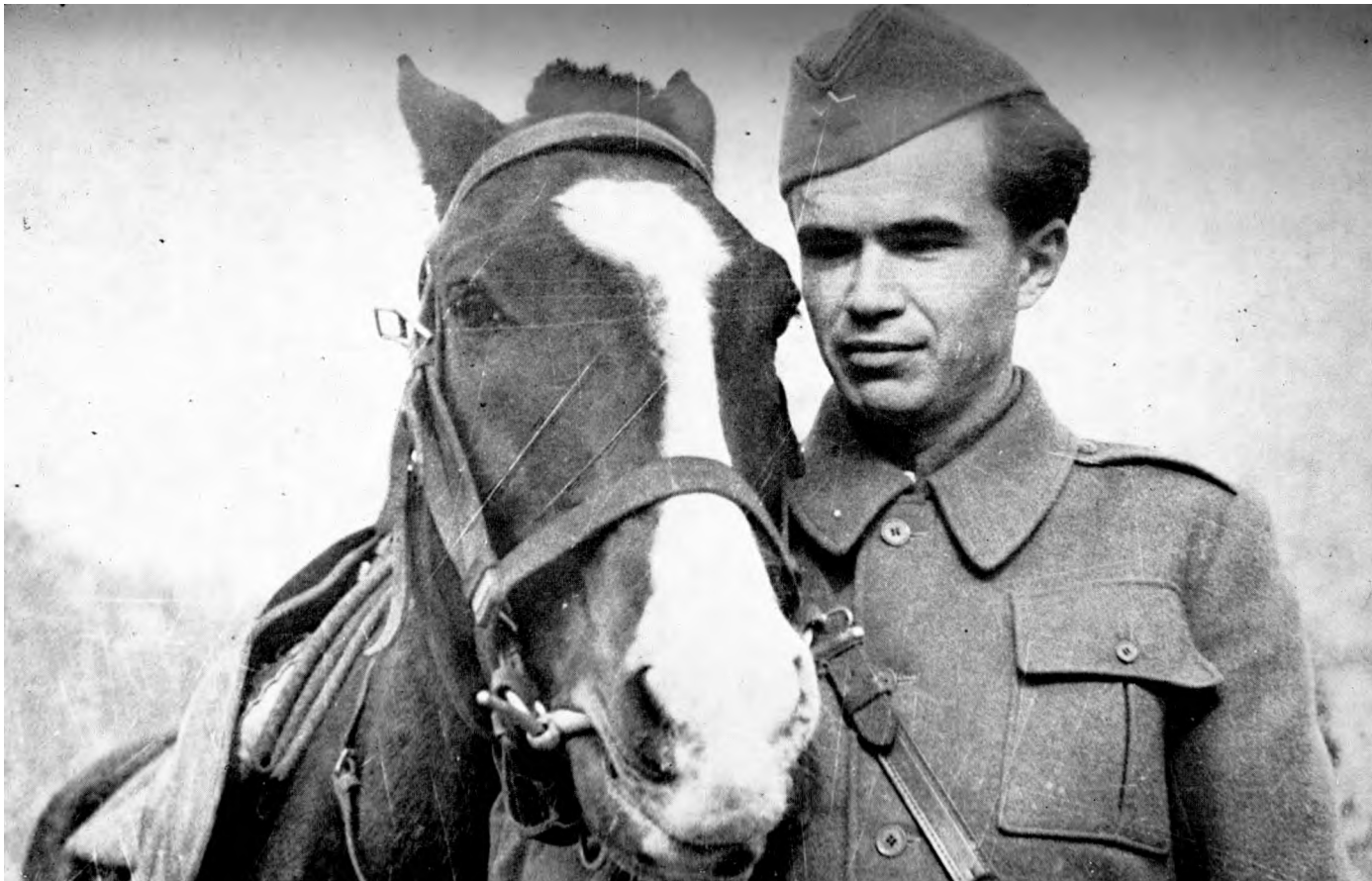
Ivo Lola Ribar, novembra 1943. godine