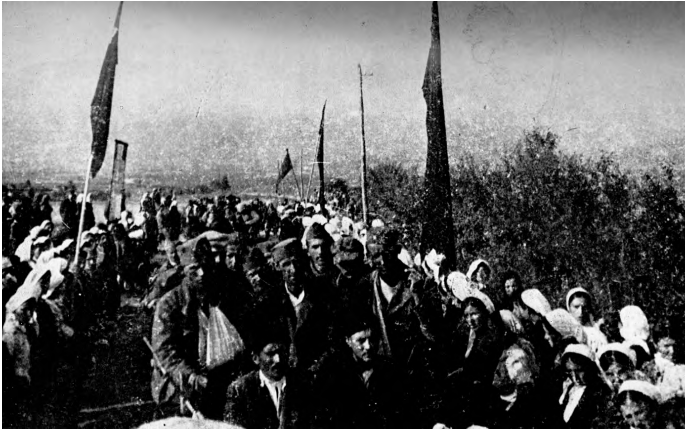
Narod dočekuje ranjenike iz proleterskih jedinica u Bosanskom Petrovcu