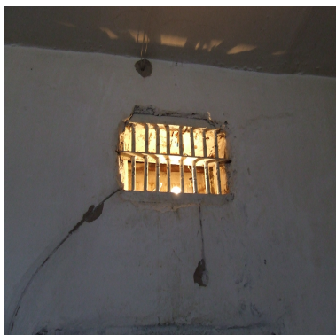
ОВ-156/3 мекемесінің АИ, Өскемен қ.

ғасырдың ортасында, немесе одан да ерте салынған, бір бөлігі жөндеу жұмыстарын қажет ететін, сондай-ақ апатты жағдайдағы ғимараттар мен үйжайлар болып табылады. Мысалы, Шығыс Қазақстан (ОВ-156/19), Қарағанды (АК-159/1), Алматы (ЛА-155/16) облыстарындағы, Астана қ. тергеу изоляторлары, ЛА-155/6, ОВ-156/22, ГМ-172/1, ГМ-172/8 түзеу мекемелері. Санитарлық-гигиеналық нормалар мен талаптарды сақтамау, санитарлық тораптардың, кәріздердің қанағаттанарлықсыз жағдайы, төсек орын құралдарының лайықсыз күйі Шығыс Қазақстан, Қарағанды, Қостанай, Ақтөбе облыстарының тергеу изоляторларында және Солтүстік Қазақстан, Шығыс Қазақстан, Қостанай, Қызылорда облыстарының, Алматы және Астана қалаларының жекелеген түзеу мекемелерінде байқалады.