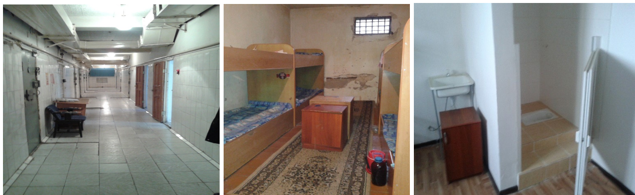
Алматы облысының Қарасай ауданы ІІД уақытша ұстау изоляторы, Қаскелен қ.

Осындай ұсыныстарды (ұсынымдарды) облыстар бойынша жинақтауды прокуратура органдары қызметкерлері заңда көзделген прокурорлық жауап қайтару шарасын қолдану үшін бақылауға алуы тиіс деп көрінеді, себебі осындай сәйкессіздіктер тікелей немесе жанама түрде ҚР ІІМ мекемелерінде қамауда орналасқан тұлғалардың адами ар-қасиеті мәселелерін қозғайды.