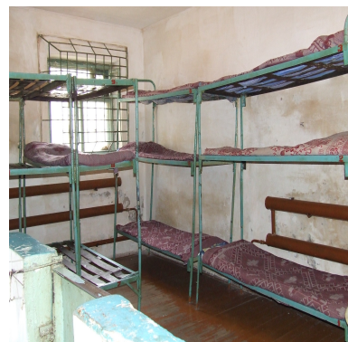
Семей қ. ТИ камерасы

Ұсынылған есептерді талдау қамауда ұстау және бостандығынан айыру орындарында медициналық және медикаментоздық қамтамасыз ету жеткіліксіздігі, медициналық мамандардың кадрлық тапшылығы сияқты проблемалар шешілмей қалғанын көрсетіп отыр. Мекеме аумағында сотталушы мүгедектердің жүріп қозғалуы, соның ішінде қыдыру проблемасы бар, мүгедектерге арналған арбалардың тозуы Солтүстік Қазақстан және Шығыс Қазақстан облыстарының түзеу мекемелерінде белгіленген, Павлодар облысының тергеу изоляторларында стандартты үйжайлар жағдайында мүгедектерді орналастыру үшін құрылғылардың болмауы белгіленген.