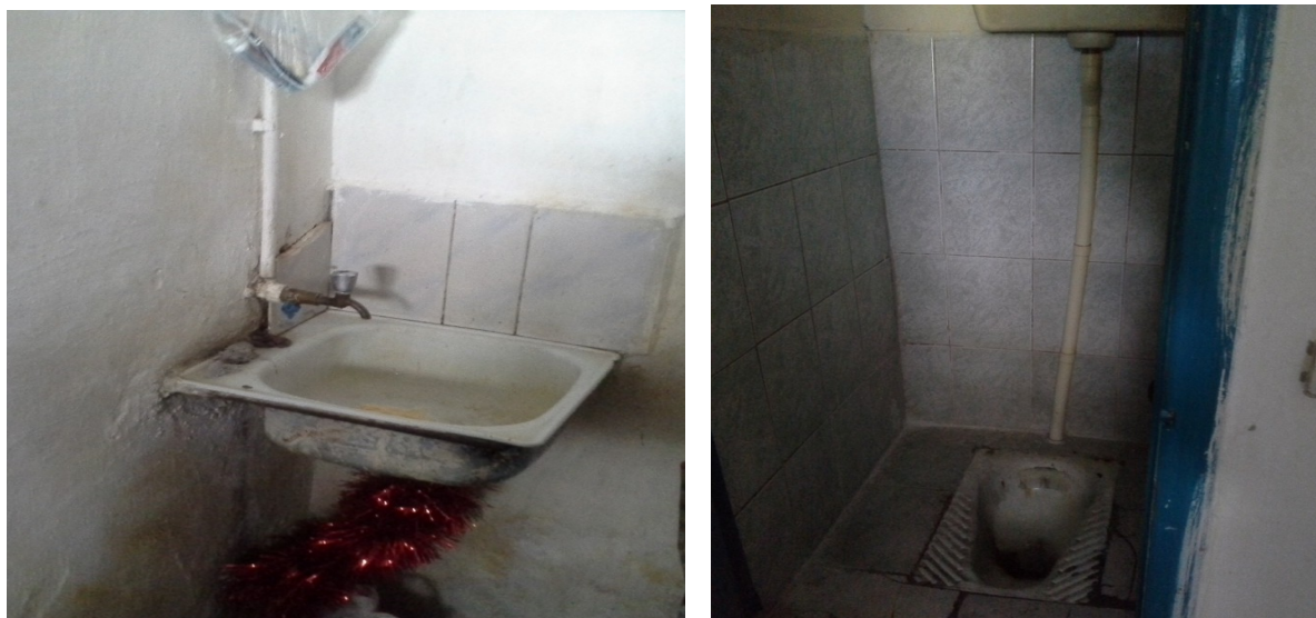
Алматы қ. ІІД қабылдау-тарату орны

Көптеген мекемелерде негізгі орналасу жағдайларының жоқтығы, орналасу нормаларын (лық толған немесе орналасқан тұлғаларды әркелкі бөлу) және санитарлық алаңды сақтамауы белгіленді. Көп жағдайда уақытша ұстау мекемелерінде табиғи жарықтандырудың жеткіліксіздігі мен камераларда тәулік бойы реттелетін жарықтандырудың болмауы, табиғи вентиляцияға және оны реттеуге шектеулі қолжетімділік орын алуда.