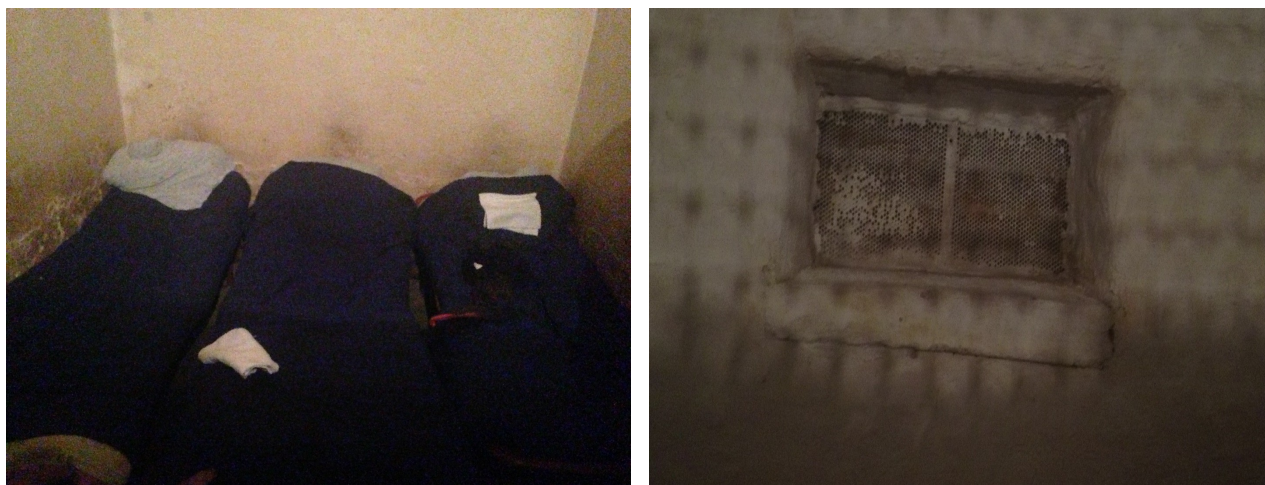
Семей қ. уақытша ұстау изоляторы

Көптеген мекемелерде негізгі орналасу жағдайларының жоқтығы, орналасу нормаларын (лық толған немесе орналасқан тұлғаларды әркелкі бөлу) және санитарлық алаңды сақтамауы белгіленді. Көп жағдайда уақытша ұстау мекемелерінде табиғи жарықтандырудың жеткіліксіздігі мен камераларда тәулік бойы реттелетін жарықтандырудың болмауы, табиғи вентиляцияға және оны реттеуге шектеулі қолжетімділік орын алуда.