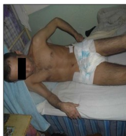
ЕС-164/4 мекемесі, Горный ауылы, СҚО