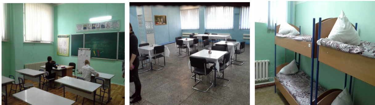
Алматы қ. Әумесерлік мінез-құлқы бар балаларға арналған арнаулы білім беру ұйымы

Жамбыл облысының ҰАТ қатысушылары «Балалар мен жасөспірімдерге арналған арнаулы мектеп» КММ (Тараз қ.) оң жұмысын атап өтті, мекеменің басшылығы нәтижесінде мекемеде әумесерлік мінез-құлқы бар жасөспірімдерді дұрыс тәрбиелеуге жақсы әсерін тигізетін әмбебап атмосфераны қалыптастыратындай кадрларды іріктеу, балалармен жұмыс жасау саясатын жүзеге асырады. Одан әрі, тәрбиеленушілердің жеке сауалнамасы мекемеде орналасқан балалар мен жасөспірімдерді тәрбиелеу үшін шын мәнісінде де достық және жағымды атмосфераның қалыптасқанын көрсетіп отыр.