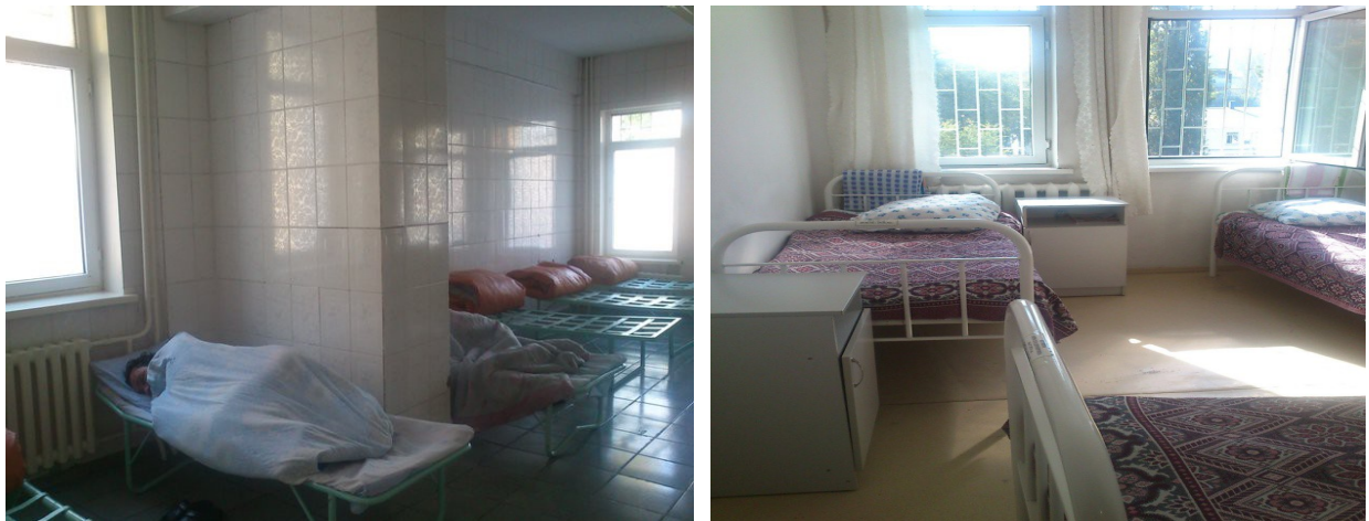
Алматы қалалық медициналық-әлеуметтік коррекция наркологиялық орталығы

Жалпы мекеменің аталған үлгідегі медициналық қызмет көрсетумен қалыптасқан жағдай оң деп бағаланады, тек жекелеген мекемелерде медициналық персоналдың жеткіліксіздігі байқалуда. Осылайша, Солтүстік Қазақстан облысының Благовещенка аулындағы мәжбүрлеп емдеуге арналған наркологиялық ұйымдар медициналық персонал жеткіліксіз, дәрігер-психотерапевт, дәрігер-наркологтар мен терапевттердің айрықша жетіспейді; Оңтүстік Қазақстан облысының облыстық наркологиялық ауруханада психолог пен психотерапевт бос орындары бар.