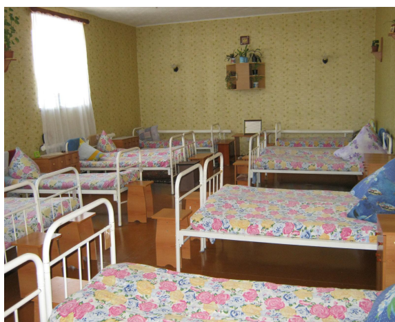
УК-161/2 жататын үйжайы, Қостанай қ.

ҰАТ қатысушыларының есептерінде сыртқы дүниемен байланыстың шектілігі (мекемелерде кезеңдік баспасөз басылымдарының, кітаптардың, радионүктелердің жоқтығы немесе аз болуы, туысқандармен телефон арқылы сөйлесулерді уақытын ерікті азайту) белгіленген. Уақытша оқшаулау және ұзақ мерзімге бостандықтан айыру орындарында азаптауды және қатыгез іс-әрекеттерді алдын алудағы маңызды фактор осындай мекемелерде орналасқан тұлғалардың шағымдарды беру тетіктеріне қолжетімділігі болып табылады. Көптеген есептерде тергеудегі- қамауға алынғандар, сотталушылардың заңды құқықтары мен мүдделері, олардың мемлекеттік органдарға және құқық қорғау ұйымдарына жүгіну тәртібі мен процедурасы туралы ақпараттың жоқтығы немесе жеткіліксіз қол жетімділігі, шағымдарды берудің тиісті каналдарының жоқтығы белгіленген.