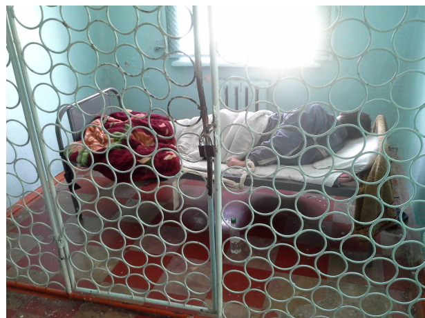
Алматы облысының Ақтас аулының Интенсивті қадағалаумен мамандандырылған үлгідегі Республикалық психиатриялық ауруханасы

Одан басқа, ҰАТ қатысушылары бұл мекеменің науқастарының жеке заттарына қатысы жоқ бөтен заттарды алу үшін науқастардың жеке қаражатын пайдалану фактілері анықтады. Аталған факт бойынша қадағалау органының құқықтық бағасы қажет, осыған орай Алматы қ. мен Алматы облысының ҰАТ