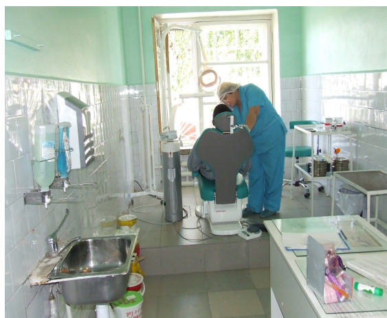
ОВ-156/3 мекемесінің медсанбөлімі, Өскемен қ.

Әрине, уәкілетті органның жазалауды орындау, сотталушыларды ұстау және жазалауды өтеу тәртібінің жағдайларын жақсарту, азаматтық қоғамдастықтың пенитенциарлық мекемелерінің қызметіне қатысуы жүйесін жетілдіру үшін жүргізіп отырған жұмысын атап өту қажет.