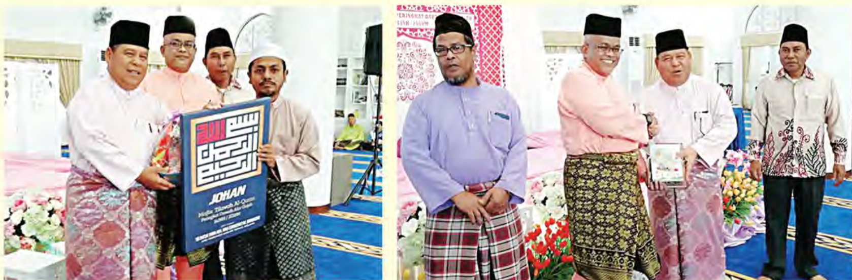
AHLI Dewan Undangan Negeri (ADUN) kawasan Asahan, Datuk Seri Abdul Ghafaar Atan menyampaikan hadiah kepada salah seorang peserta yang menyertai Majlis Tilawah Al-Quran Peringkat Daerah Alor Gajah yang telah diadakan di Masjid Salmah Khamis.

Sehubungan dengan itu, masyarakat bukan Islam juga turut diminta mematuhi etika berpakaian di tempat awam kerana ia turut tertakluk di bawah beberapa undang-undang termasuk di bawah Seksyen 268 Kanun Keseksan iaitu satu kesalahan yang menyebabkan kegusaran am kepada orang awam dan ia juga tertakluk di bawah Rukun Negara yang kelima iaitu Kesopanan dan Kesusilaan agar masyarakat berbilang kaum dapat hidup dalam suasana aman dan harmoni.