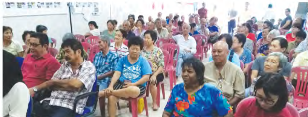
SEBAHAGIAN penerima sumbangan yang hadir di Pusat Khidmat BN & myPPP DUN Kota Laksamana di Kampung Lapan, Rabu lalu.