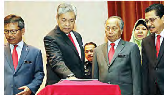
AHMAD Zahid ketika menyempurnakan gimik pelancaran Manual dan Sistem Pemprofilan Rekrutmen (SPIER) dalam majlis itu.

"Berita palsu akan ada dalam strategi kempen saat-saat akhir...itu saya