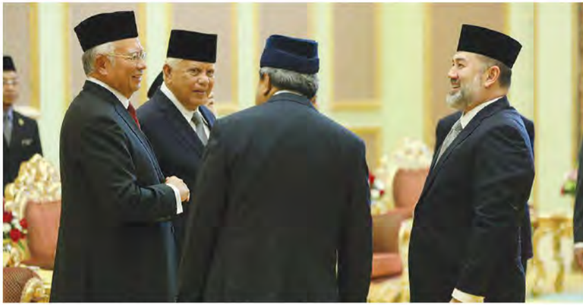
YANG di-Pertuan Agong, Sultan Muhammad V beramah mesra bersama Perdana Menteri, Datuk Seri Utama Mohd Najib Tun Razak serta Yang di-Pertua Negeri Melaka, Tun Dr. Mohd Khalil Yaakob di Istana Negara, semalam.