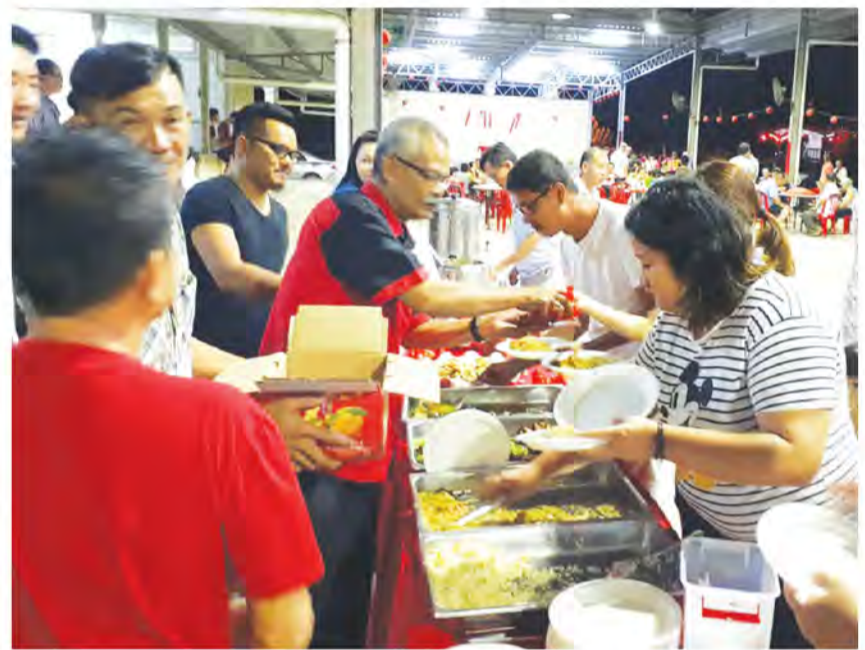
GHAZALE menyantuni penduduk menikmati hidangan jamuan makan malam.