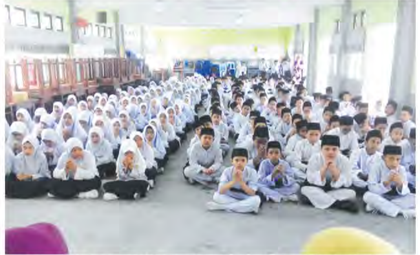
PELAJAR -pelajar lain yang tidak dilantik menjadi pemimpin pelajar turut hadir dalam program tersebut.

Sementara itu, Guru Pengawas sekolah terbabit, Norlizah Karim berkata, pelajar yang dilantik sebagai pengawas perlu sentiasa peka terhadap apa yang berlaku dan mem-