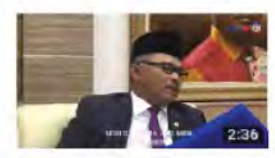
BAJET 2018 MELAKA MOHON 3 PERKARA 221 views

IKUTI PERKEMBANGAN BERITA SEMASA DALAM NEGERI DI WWW.YOUTUBE.COM/MELAKATV