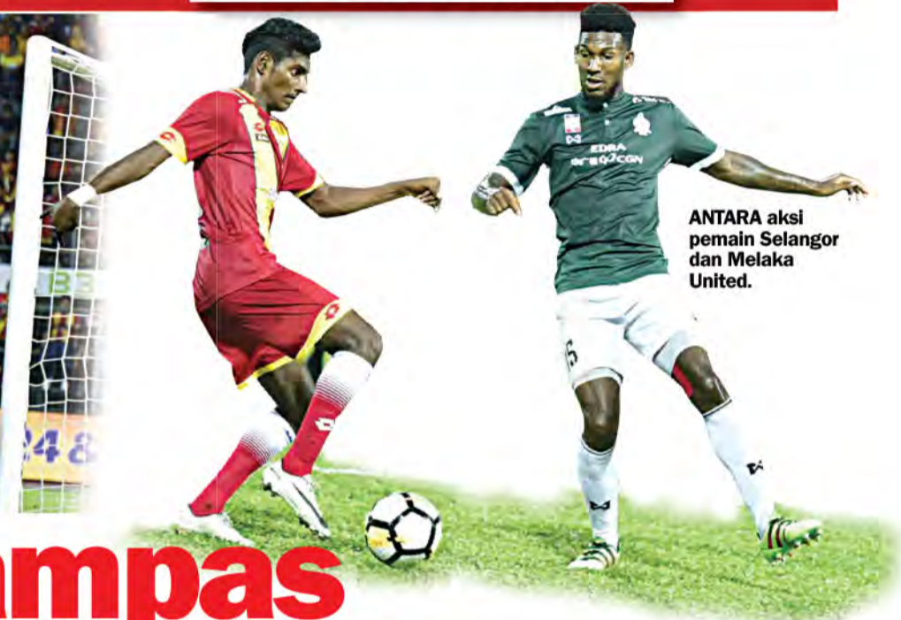
ANTARA aksi pemain Selangor dan Melaka United.