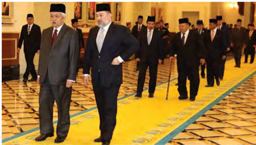
YANG di-Pertuan Agong, Sultan Muhammad V bersama Yang Dipertuan Besar Negeri Sembilan, Tuanku Muhriz Almarhum Tuanku Munawir serta barisan Raja-Raja Melayu ketika memasuki ruang Istana Negara.

Pada mesyuarat itu, Raja-Raja Melayu diiringi menteri besar masing-masing manakala Yang Di-pertua Negeri Pulau Pinang, Sarawak, Sabah dan Melaka diiringi oleh ketua menteri masing-masing. - BERNAMA