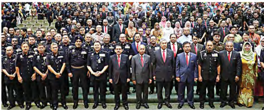
AHMAD Zahid bergambar kenangan bersama warga KDN, semalam.

Ahmad Zahid yang juga Menteri Dalam Negeri mengulas gesaan anggota-anggota PPBM yang mahu ROS mempercepatkan siasatan dan mengambil tindakan kerana mereka