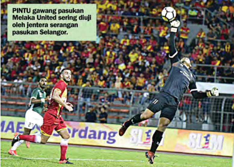
PINTU gawang pasukan Melaka United sering diuji oleh jentera serangan pasukan Selangor.