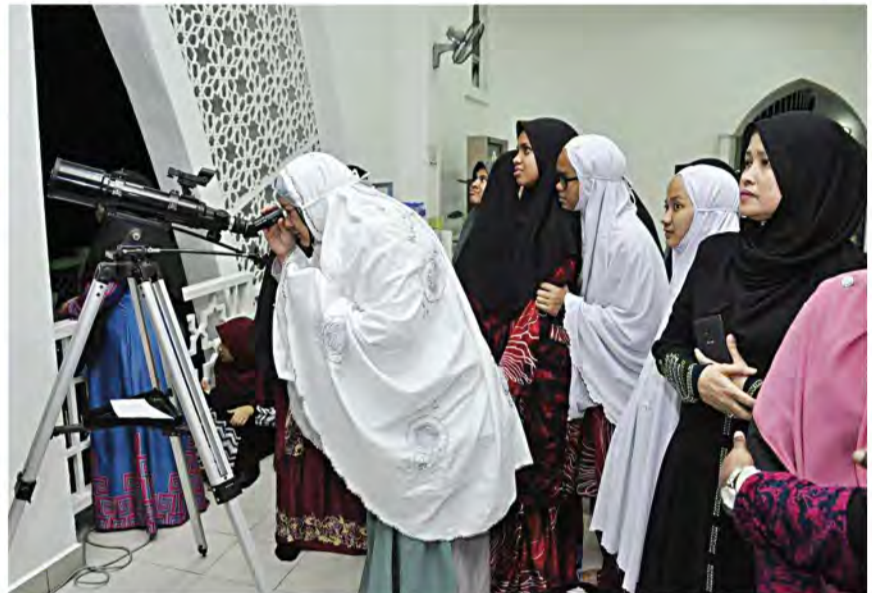
SEBAHAGIAN jemaah yang hadir tidak melepaskan peluang melihat fenomena berkenaan.