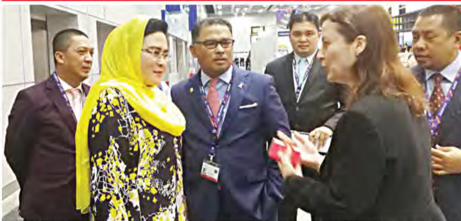
KETUA Menteri, Datuk Seri Utama Idris Haron bersama Timbalan Menteri Kesejahteraan Bandar, Perumahan dan Kerajaan Tempatan, Datuk Halimah Mohamed Sadique ketika melawat sekitar kawasan pameran WUF9 di Pusat Konvensyen Kuala Lumpur (KLCC), semalam.