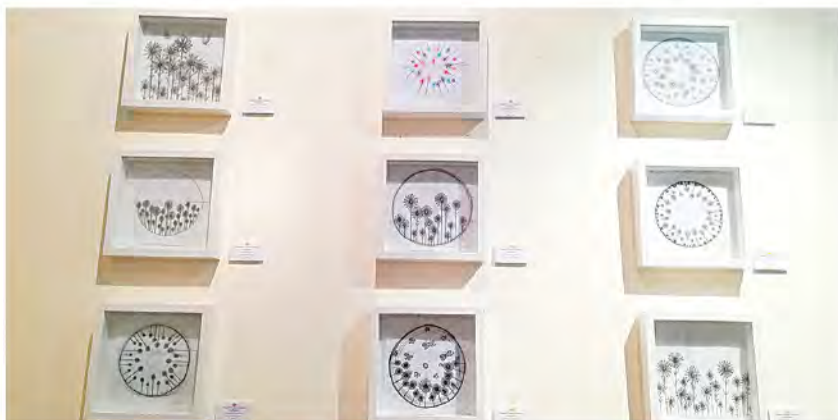
ANTARA karya seni yang dipamerkan.