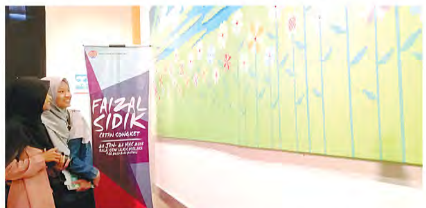
ANTARA pengunjung yang sempat melihat karya seni songket yang dipamerkan.