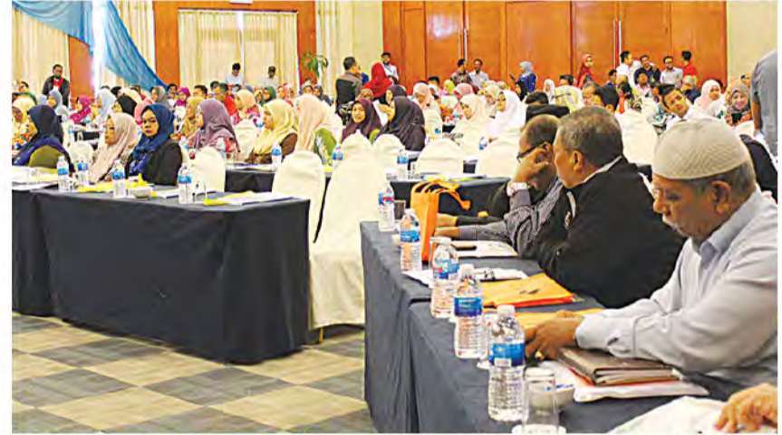
PARA peserta yang hadir pada perasmian penutup Program Lestari Modal Insan Koperasi 2018 di Gold Coast International Resort, semalam.

sanya sektor koperasi lebih kreatif, berinovasi, menceburi bidang perniagaan secara berskala besar," katanya.