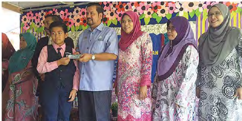
ANTARA murid yang menerima Bantuan Awal Persekolahan di SK Cheng, kelmarin.