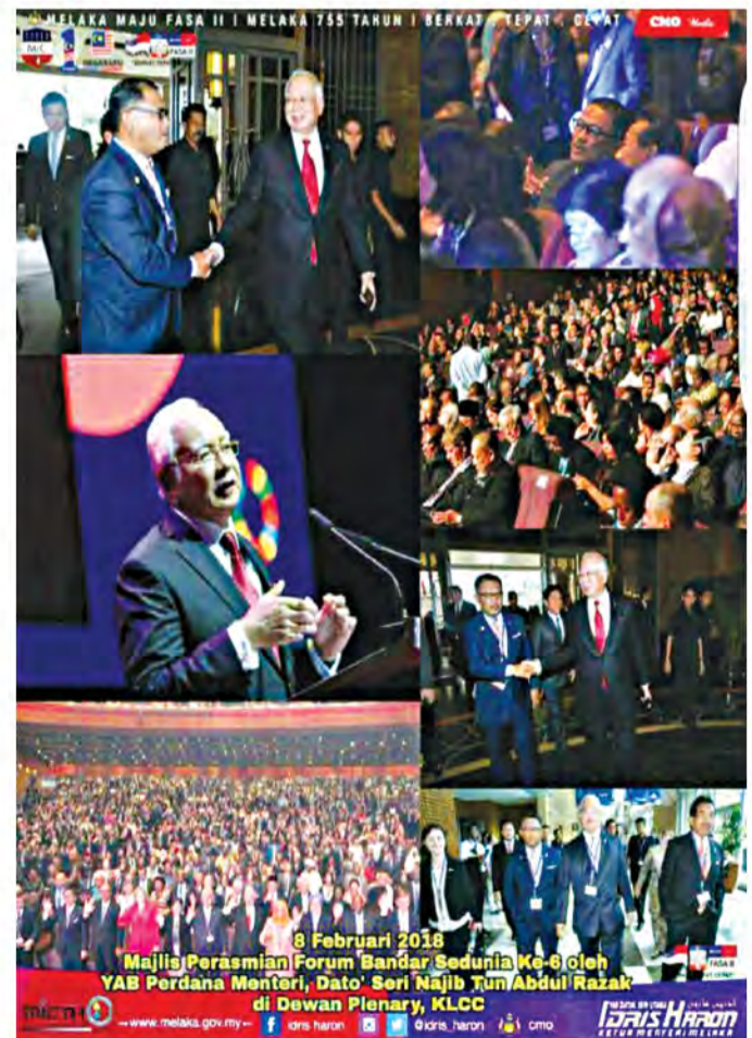
8 Februari 2018 Majlis Perasmian Forum Bandar Sedunia Ke-6 oleh YAB Perdana Menteri, Dato' Seri Najib Tun Abdul Razak di Dewan Plenary, KLCC