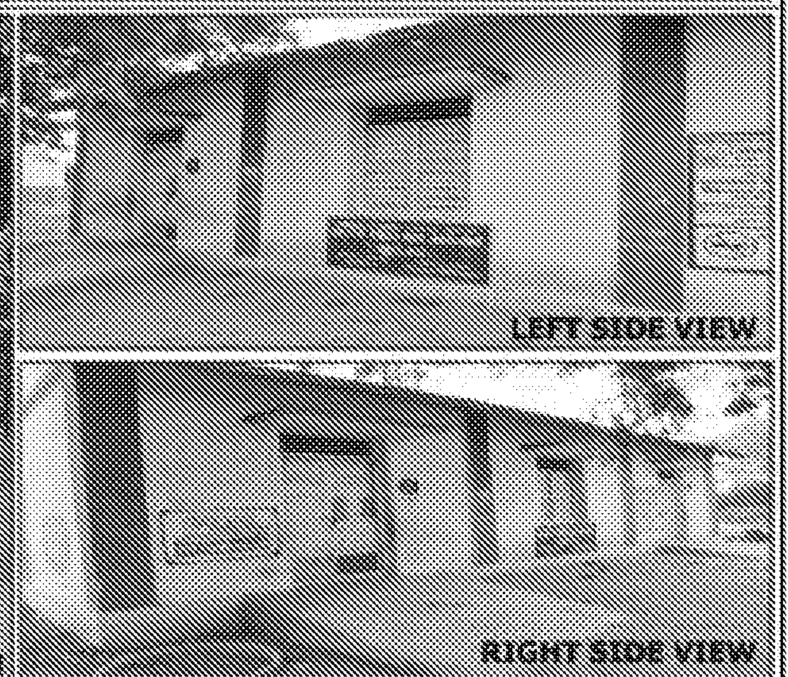
LEFT SIDE VIEW