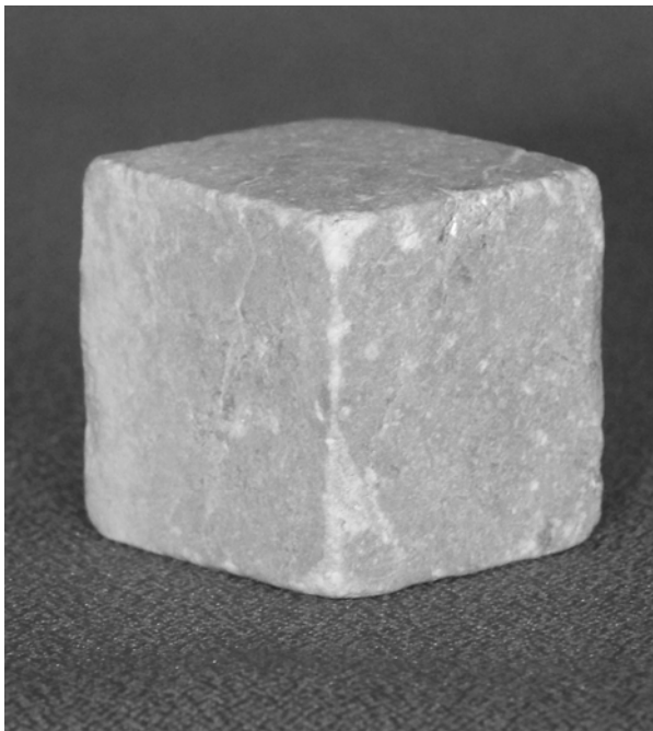
Рис. 5. Мармуровий куб з Ольвії

І.К. Суручана, які потрапили до Херсонського музею старожитностей [13]. Аналіз цього списку дозволяє стверджувати, що найцінніші матеріали музею І.К. Суручана не зникли безслідно, що, як ми зауважували вище, стверджувалося у вітчизняній літературі, а донині зберігаються в археологічних фондах Херсонського обласного краєзнавчого музею та можуть бути ідентифіковані.