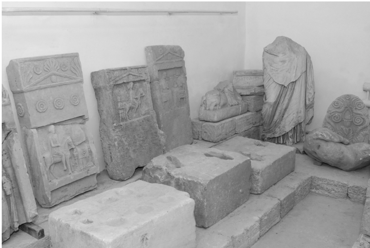
Рис. 8. Епіграфічні пам'ятки з Північного Причорномор'я