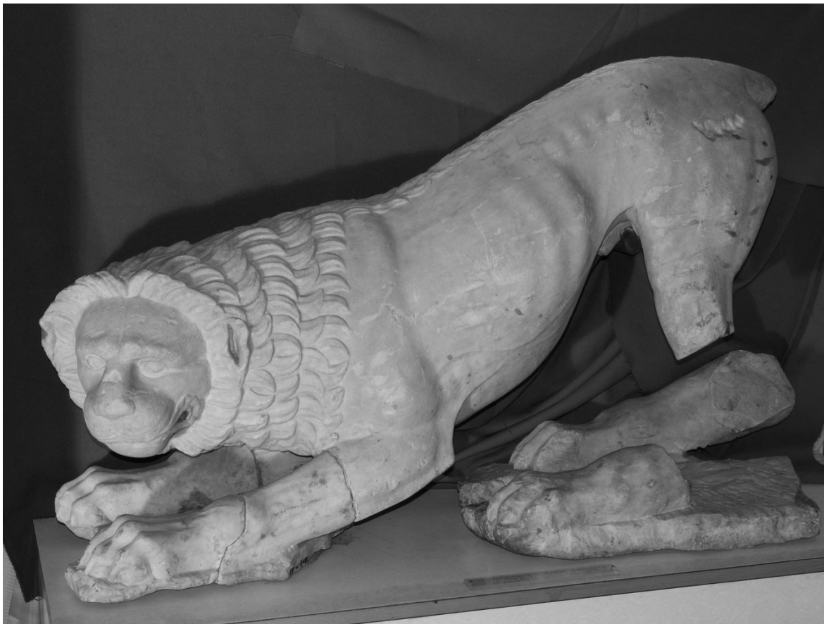
Рис. 7. Мармурова скульптура лева з Ольвії.

14. Лежух І., Черняков І. Перший молдавський археолог навчався і копав в Україні (до 150-річчя з дня народження І.К. Суручана) / Іван Лежух, Іван Черняков // Археологія . – 2001. – № 4. – С. 148.