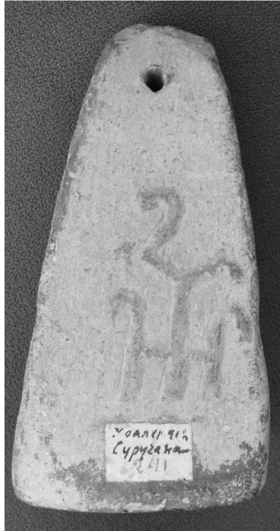
Рис. 4. Грузило усічено-пірамідальної форми I-II ст. н.е. з Ольвії

сучасного Відкритого археологічного фондосховища «Лапідарій – Амфорний зал», де лапідарні пам'ятки з античної колекції І.К. Суручана (окрім залучених до основної оглядової експозиції вищеназваних унікальних предметів) стали легкодоступними та зацікавленим дослідникам і пересічним відвідувачам музею.