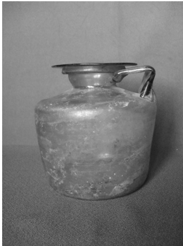
Рис. 3. Скляна посудина з Пантикапею

почувшись про його поповнення, він не міг не зацікавитися можливістю придбати частину колекцій Музею старожитностей Понту Скіфського, попри вкрай несприятливий час – почалася Перша світова війна, а слідом і Лютнева революція.