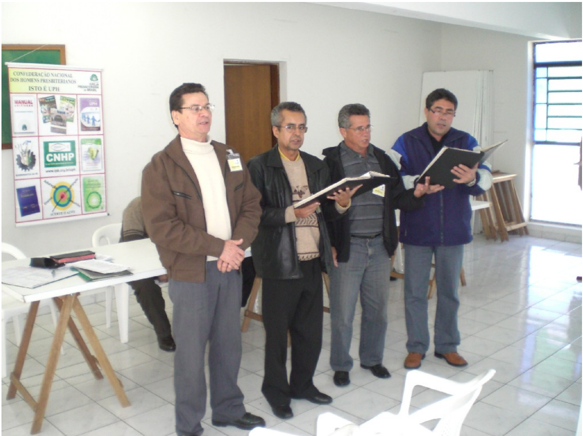
O quarteto abrilhantou o Congresso com o cântico de 2 hinos