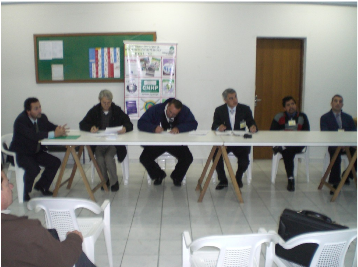
A nova Diretoria da CSTM – Sínodo de Curitiba toma assento