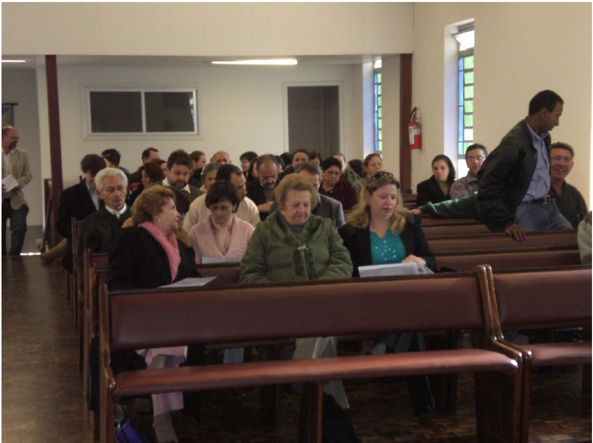
Vista do Plenário