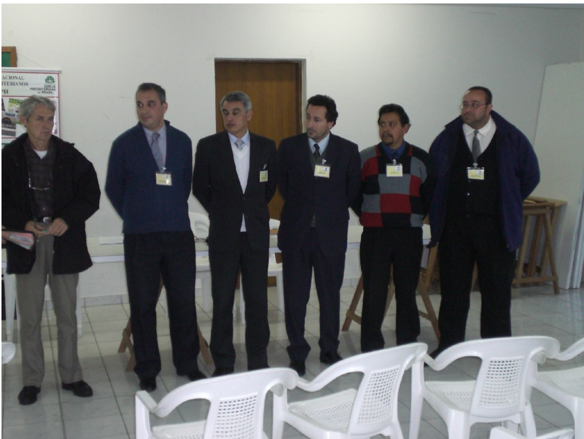
A Diretoria eleita, para o Biênio 05 /2007 a 05 /2009