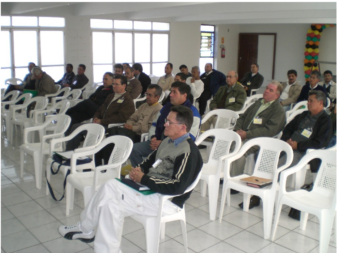
Congressistas presentes. Total de 35 delegados.