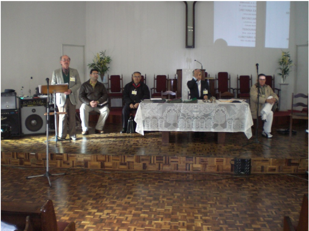
A Diretoria, antes das eleições