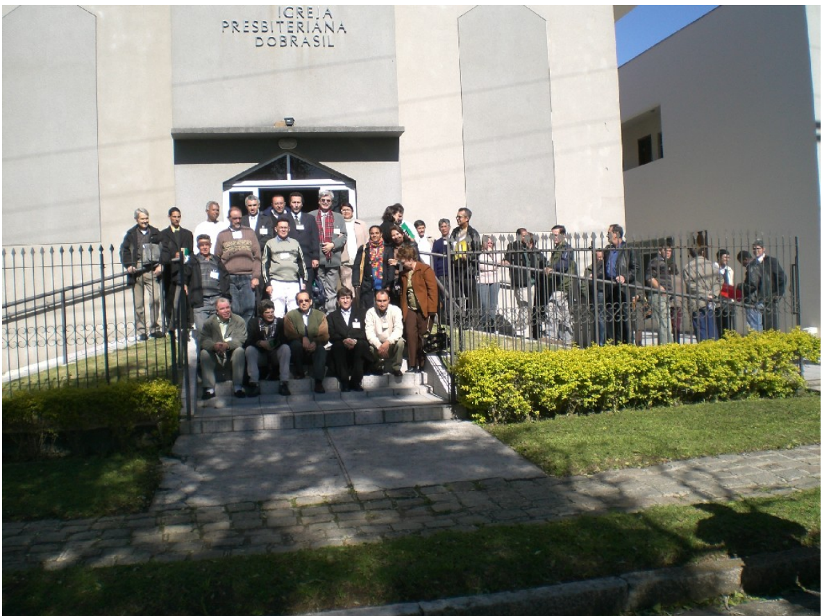
Parte dos Congressistas, logo após o almoço