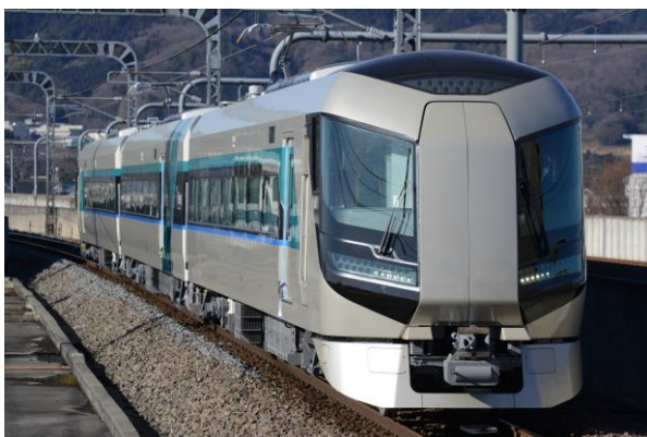
△特急車両「リバティ」