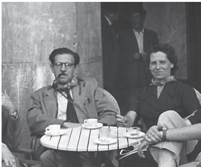
Figura 7. Cursos d'estiu a Navarra. Estella, agost de 1956.

la vida y por doquier veía la muerte —refereix—, lentamente me paseaba por las calles, si tal se puede decir, mientras la emoción me agarraba atenazando mi cuello como una terrible garra de acero que me impedía respirar. Quería gritar y no podía. Haciendo un gran esfuerzo me salí de la ciudad. Conforme me alejaba iba serenándome pero no dejaba de mirar hacia atrás. Me parecía que «algo» me llamaba, que la muerte me llamaba. (...) Tu saps quantes runes no he visitat però mai havia tingut l'emoció d'avui. Les runes d'avui eren runes vivents”. 35