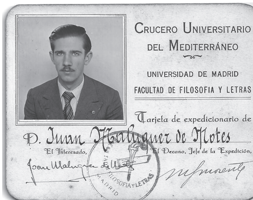
Figura 1. Targeta del Creuer pel Mediterrani 1933.

alumnes sense qualificacions específiques per assignatures i es varen incorporar una gran quantitat dels més il·lustres intel·lectuals catalans a la Universitat, fins aleshores tancada a un estol de funcionaris de carrera no sempre prou competents o prou motivats.