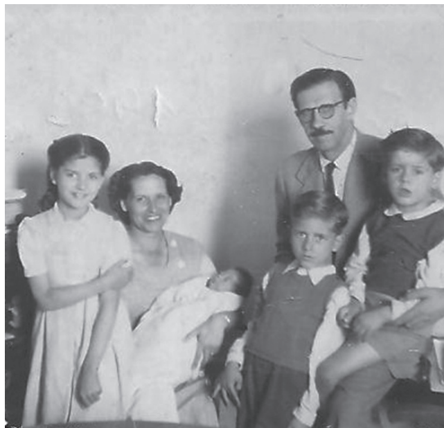
Figura 6. Amb la família. Salamanca, juny de 1953.