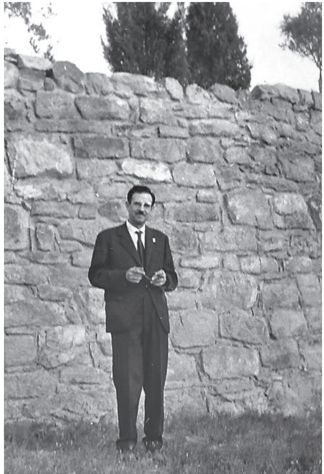
Figura 8. Ullastret, 1964.

No gaire després, Maluquer contacta de nou amb Pericot: “m'he enterat que l'amic Almagro ha substituït en Bosch [a la Universitat de Barcelona] i realment encara no he sortit de l'estupor que m'ha produït aquesta notícia”. 47 Almagro, comunista d'abans de la guerra, ha aparegut a Barcelona d'alferes provisional, lluint la camisa blava de Falange i amb tota la força de la nova filiació política (Gracia i Fullola 2006). Una història gens original de la qual poden trobar-se exemples innombrables a tots els àmbits de la vida catalana i espanyola de la postguerra. S'ha escrit erròniament que Maluquer va ésser deixeble d'Almagro i que es va formar amb ell (Gracia 2012: 370 i 377). Res més lluny de la veritat. No va ésser alumne del seu presumpte mestre, del qual no va reconèixer mai deute científic de cap tipus, i va començar a publicar abans que ell. Es va formar amb Bosch Gimpera, de qui va rebre diversos cursos en forma gairebé monogràfica, fins al punt que sovint