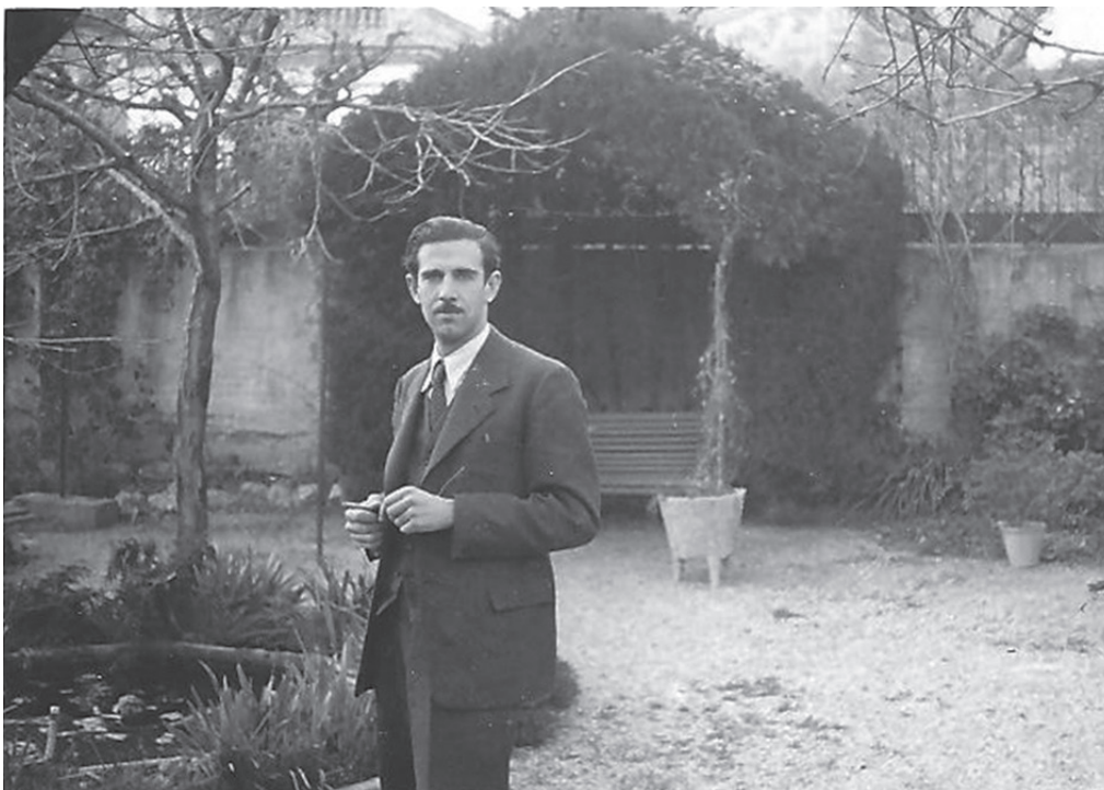
Figura 5. Setembre de 1942.

tenia rituals, com escoltar a la penombra la veu de Marlène Dietrich cantant des d'ultratomba "Lorsque tout est fini", amb el nas dintre una gran copa plena de conyac o simplement els diumenges a la tarda, jugar al pòquer a can Pidelaserra.