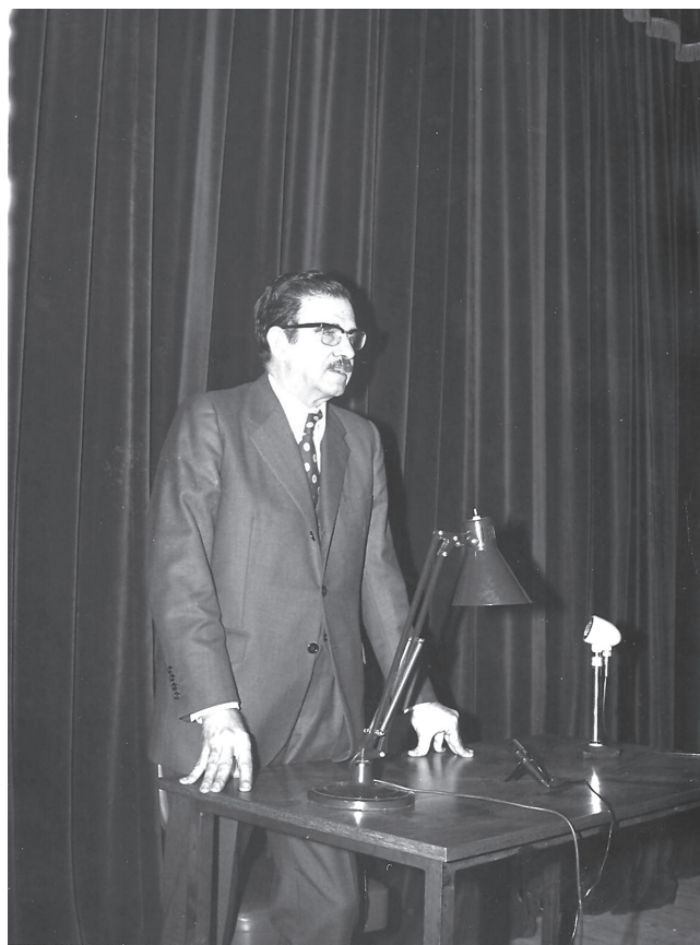
Figura 10. Conferència a Tarragona 1972.

No gaire temps després d'haver-se instal·lat a Salamanca, Maluquer es va assabentar, perplex i atònit, del text d'Almagro (1952: 52) en què el fa "discípulo nuestro después de haberlo sido de Bosch Gimpera i