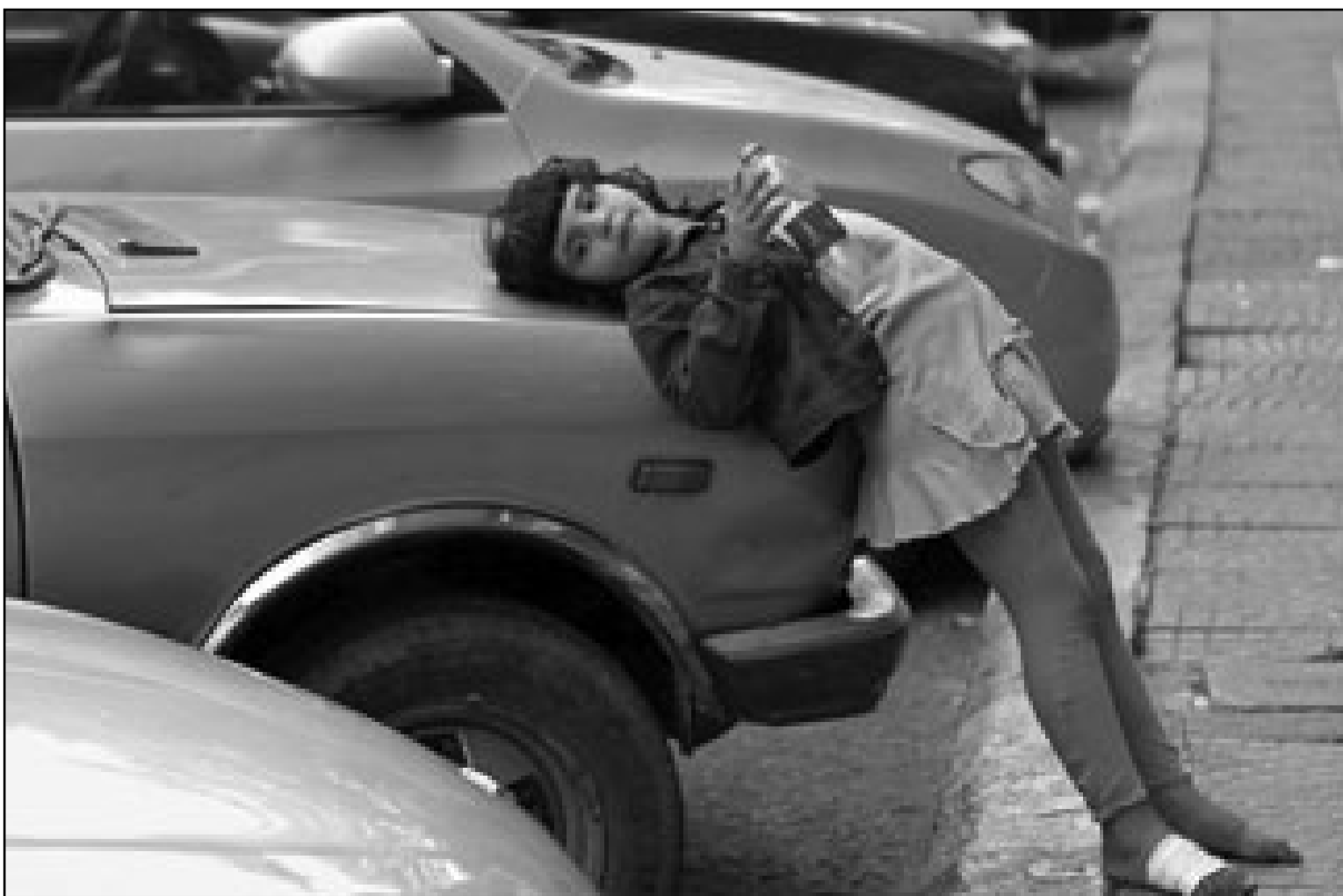
طفلة مصرية تتسول في احد شوارع القاهرة الجمعة (1 ف ب)

التعليم بتعمد صعوبة الامتحانات لمنع الطلاب من الحصول على مجاميع مرتفعة وتحجيم أعداد الناجحين في الثانوية العامة وتقييد وعده بان الحاصل على 90 % سيزوره في المنزل، وأوضح الطلاب ان الفقرة ب، من السؤالين الرابع والخامس غير موجودة بالمنهج ولم يستطع أحد التوصل إلى الاجابة الصحيحة لها، عمت الشكوى من صعوبة الأسئلة مختلف المحافظات وتحول المشهد أمام لجان الامتحانات إلى سدادق للعزاء واعتلت علامات الحزن وجوه أولياء الأمور والطلاب، انخرط الطلاب في البكاء عقب خروجهم من اللجان وتعلت الأصوات بالدعاء على المسؤولين عن صعوبة الأسئلة، أكد أولياء الأمور ان الأسئلة تعد انتقاما من الطلاب ولا تقيس مستويات التحصيل التي يديها الوزير. التزمت وزارة التربية والتعليم بالعادة الصمت ولم تتخذ أي اجراء لعلاج شكوى الطلاب من صعوبة الأسئلة متلما حدث في مادة اللغة الأجنبية الأولى، ضربت الوزارة باستياء الطلاب وأولياء الأمور من صعوبة الامتحان عرض الحائط ولم تصدر أي بيانات حول مستوى