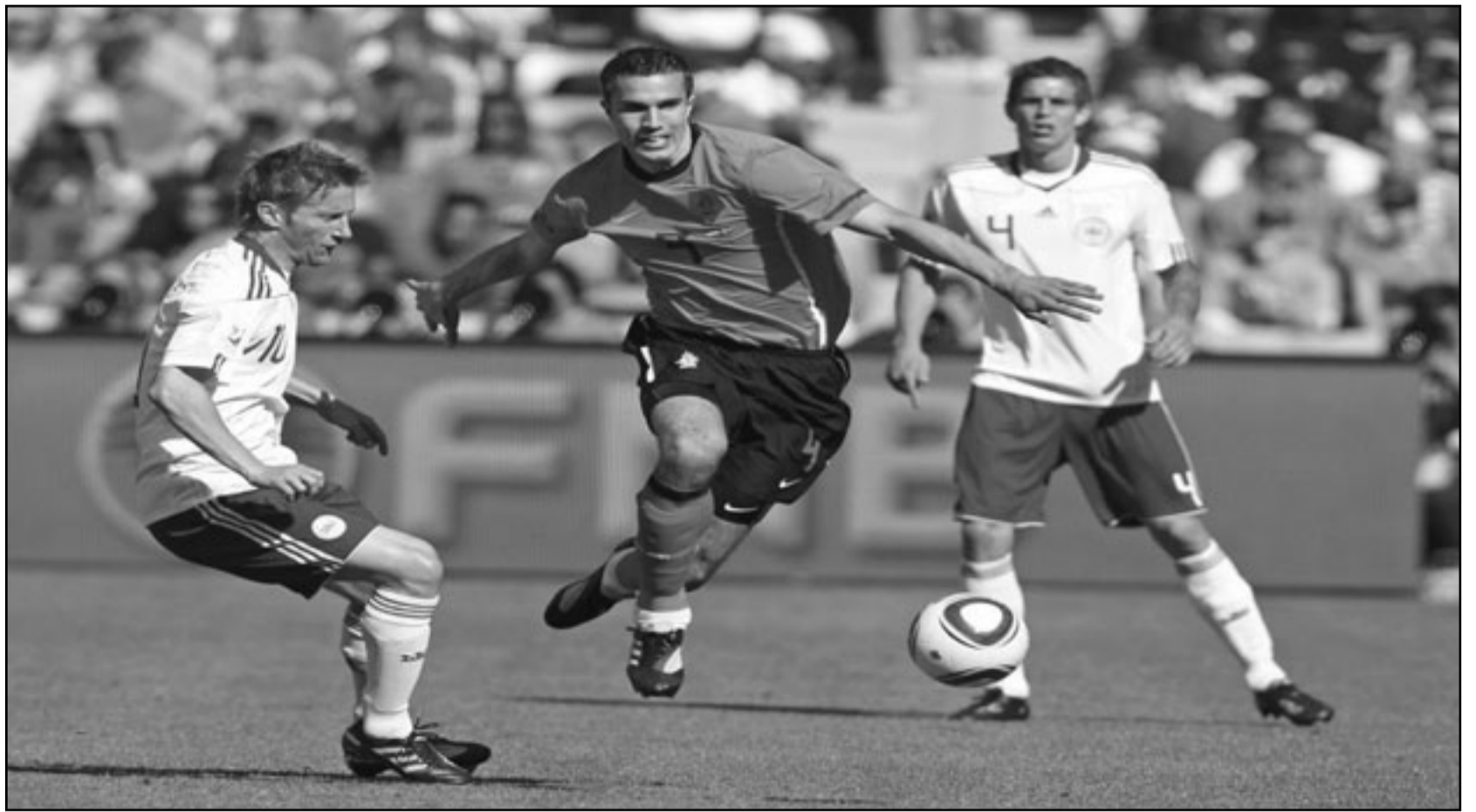
جوريس ماثيجسن نجم هولندا (وسط) يتفرد بالكرة خلال المباراة مع الدنمارك

بريتوريا - د ب أ: يحارب المنتخب الدنماركي الزمن من أجل استعادة مهاجمه نيكلاس بيندتر ويون دال توماسون فيما طلب لاعب المنتخب الكاميروني من مدربهم بول لوغوين بإحداث الفارق خلال مباراة اسود الكاميرون مع البارود الدنماركي السبت في بريوتوريا في الجولة الثانية من مباريات المجموعة الخامسة لنهائيات كأس العالم لكرة القدم بجنوب أفريقيا. ويسعى كلا الفريقين لوضع الهزيمة الأولى خلف ظهرهما والحفاظ على آمالهما في مونديال جنوب أفريقيا.