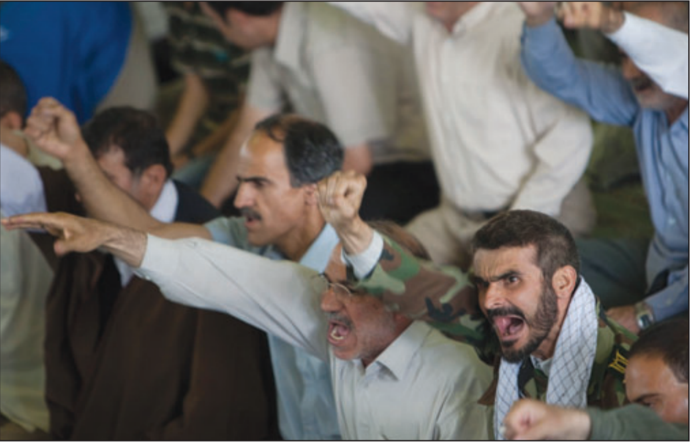
إيرانيون يهتفون ضد الولايات المتحدة وإسرائيل خلال صلاة الجمعة في طهران أمس