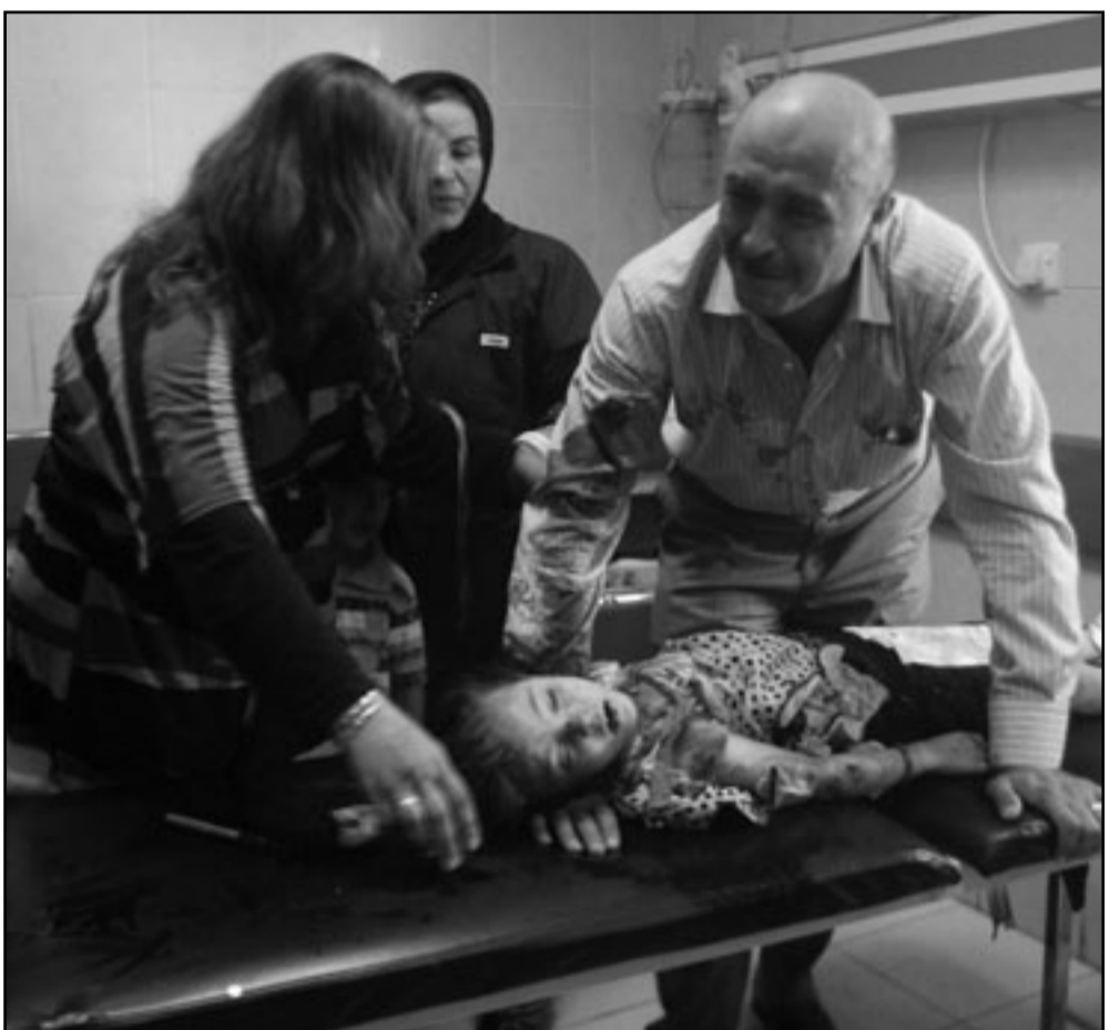
مواطن عراقي يبكي بالقرب من جثمان طفلة في إحدى مستشفيات العاصمة بغداد

بغداد- وكالات: حذر المرجع الديني الكبير آية الله علي السيستاني الجمعة من حدوث أزمة سياسية كبيرة «تستدعي تدخل المرجعية لحلها»، مجددا في الوقت ذاته وقوفه على الحياد أمام جميع الكتل السياسية، وقال حامد الخفاف المتحدث الرسمي باسم السيستاني للصحافيين ان «المرجعية لن تدعم احدا من المرشحين إلى منصب رئاسة الوزراء كما انها لا تضع فيقو على أي منهم». وأكد ان المرجعية «تأمل التوصل إلى تشكيل حكومة كفاءة قادرة على حل مشاكل البلاد في وقت قريب، وان تدخل أزمة سياسية كبيرة تستدعي تدخل المرجعية الدينية لحلها». وأضاف ان المرجع «أكد على مسامح جميع زواره من السياسيين ومنهم وفد العراقية، الذي كان اللقاء بهم طيبا للغاية، ان تشكيل الحكومة يخضع للحوار بين الكتل السياسية ووفقا للأليات الدستورية»، وما تزال المحادثات لتشكيل حكومة جديدة تراوح مكانها بعد أكثر من مئة يوم على الانتخابات