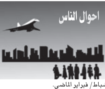
شباط/ فبراير الماضي.

لوس أنجليس- د ب أ: واجهت المثلة الأمريكية أنجلينا جولي انتقادات شديدة بسبب عزمها أداء دور الملكة المصرية كليوباترا حتى قبل البدء في التصوير. وذكرت مجلة «يو إس ويكلي» أن الانتقادات تتوالى في لوس أنجليس على اختيار الممثلة البيضاء لأداء دور الملكة المصرية. ويرى النقاد أن أداء دور كليوباترا اقتصر في الماضي على