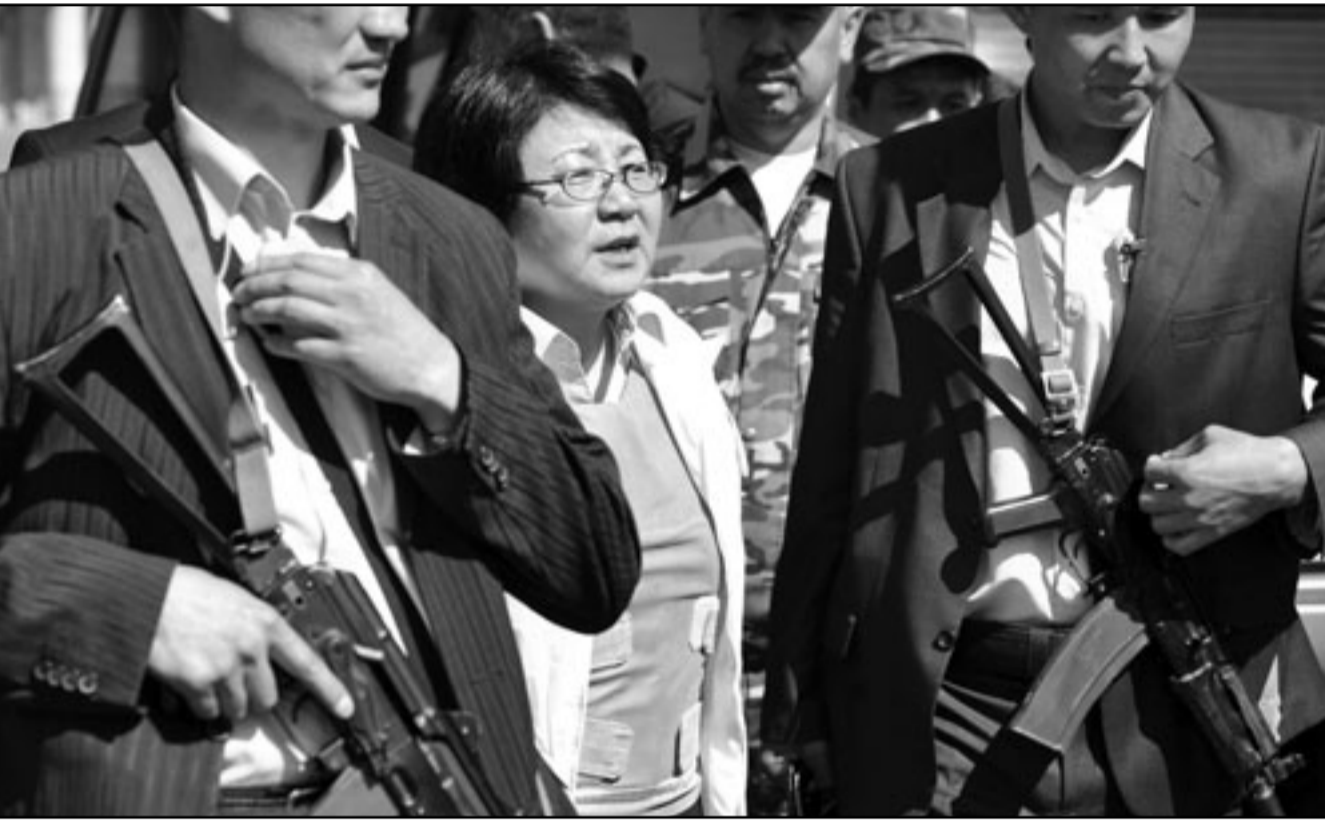
رئيسة قرغيزستان المؤقتة روزا أوتونباييفا خلال زيارة لمدينة أوش الجنوبية المضطربة

وتكر الرئيس الروسي بيان المجتمع الدولي تمكن من تسويق موقف مشترك وبناء مع إيران، موحيا انتقادات إلى الولايات المتحدة والاتحاد الأوروبي اللذين اقرا مؤخرا حزمة من العقوبات الأحادية الجانب ضد إيران، وأضاف الرئيس الروسي في المقابلة التي نشرتها وسائل الاعلام الروسية الجمعة ان مثل هذه العقوبات ستلحق ضررا بالاتفاقيات الموجودة بين الدول الكبرى لأنها في نهاية الامر قد تشمل دولا أخرى مذكرا ان هذا الأمر لم تتم مناقشته في أثناء صياغة مشروع القرار الدولي حول العقوبات ضد إيران والموافقة عليه في مجلس الامن الدولي.