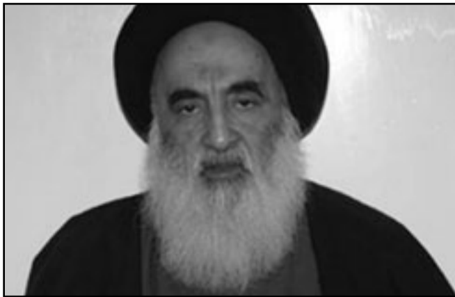
اية الله علي السيستاني

الذي يتزعمه بملك حق تشكيل الحكومة لكن دولة القانون اندمج بعد الانتخابات مع الائتلاف الشيعي الرئيسي الآخر الائتلاف الوطني العراقي ولا تفصلهما الآن عن الأغلبية المطلقة سوى أربعة مقاعد فقط. ومن شأن أي محاولة