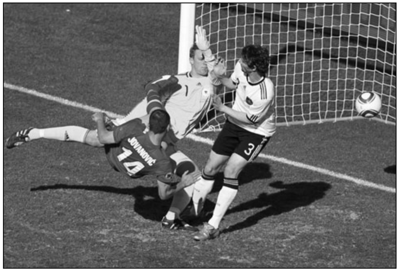
ميلان يوفانو فيتش نجم منتخب صربيا (يسار) يسددها في مرمى المانيا

وتلقى ميلان يوفانو فيتش تمريرة بالراس من