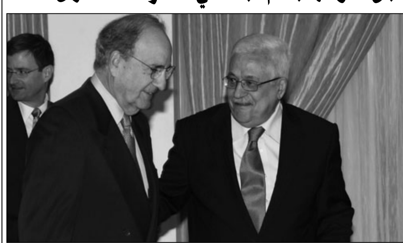
الرئيس الفلسطيني محمود عباس لدى لقائه المبعوث الأمريكي الخاص جورج ميتشل في رام الله

وتابع الزعنون «أن هذه المحاولات هي لإيجاد الفجوة بين الدول العربية الشقيقة، وهي محاولات كذلك لزرع الفتنة التي ستؤدي بالمنطقة إلى عواقب وخيمة في الوقت الذي تزدل فيه الجهود من أجل إحلال السلام العادل والشامل في المنطقة على أساس عودة اللاجئين الفلسطينيين من جميع مناطق الشتات في البلاد الأخرى إلى فلسطين أرضهم وأرض آبائهم التي طردوا منها بالقوة الجبرية العسكرية، وإقامة دولتهم المستقلة ذات السيادة على ترابهم الوطني وعاصمتها القدس، وأنهم يصرون على عدم قبول أي بديل عن أرضهم وممتلكاتهم ويؤكدون استقلال وسيادة الدول التي تضم مؤقتاً أبناء فلسطين الذين عانوا الكثير نتيجة تهجيرهم القسري الشهر الجاري».