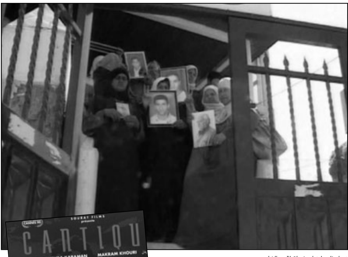
نساء فلسطينيات في لقطة من الفيلم

ويوما، كانت القطيعة شبه كاملة بين من هم خارج الوطن المحتل، وتفاصيل ما يجري على أرض الوطن، فقد كان ما هو داخل الوطن المحتل بمثابة ما يتبني على كوكب آخر، وعلى هذا فقد أخذت الثورة تتبني عالمها الخاص، المنجج بالأقوال والبروز والافتراضات، التي تبين فيما بعد أن لا علاقة لها بالواقع المنجس داخل الوطن المحتل..