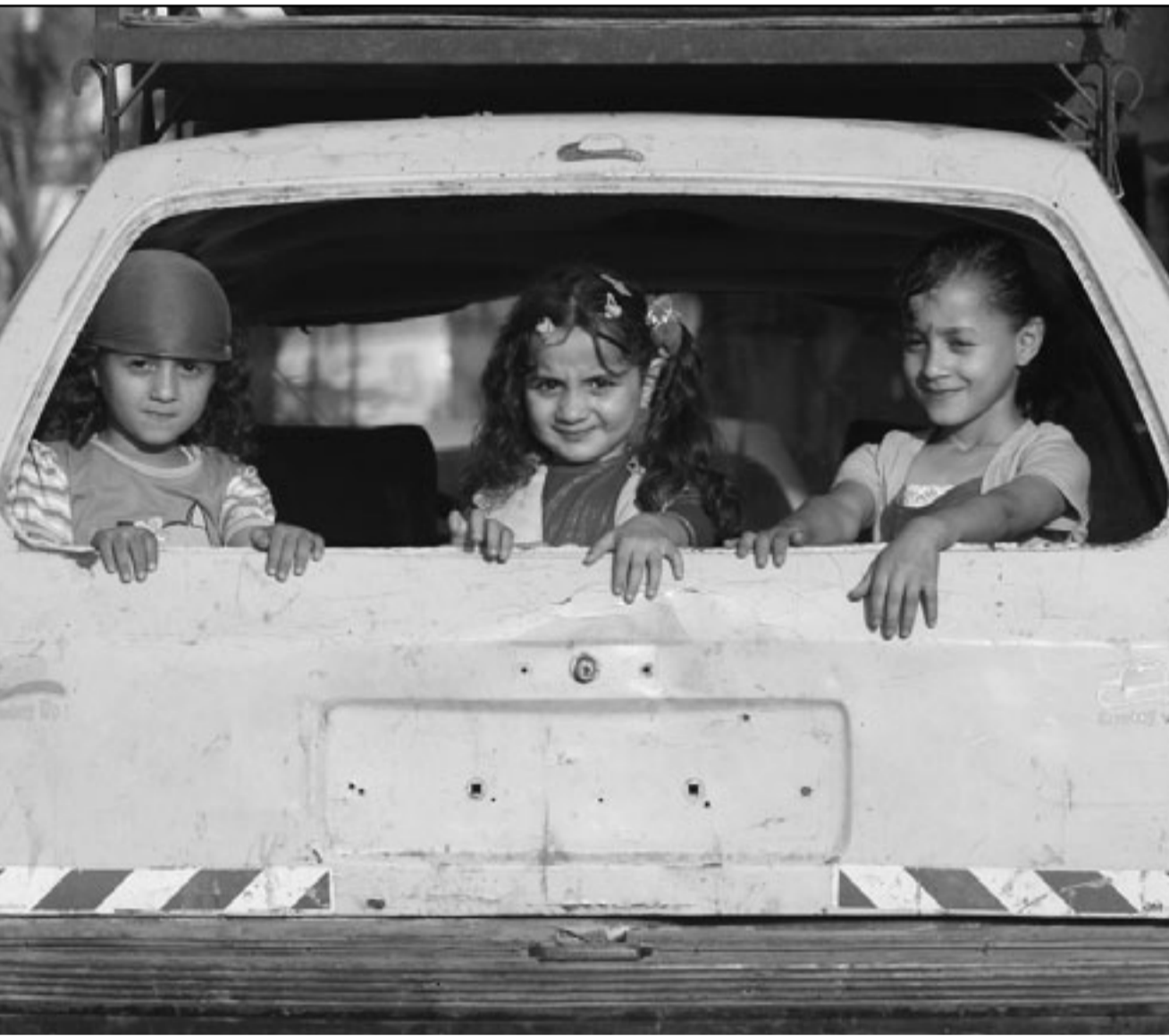
فتيات فلسطينيات في سيارة والدهن بعد انباء عن تخفيف الحصار عن غزة

وأعلنت إسرائيل بعد أشهر من الضغوط الخارجية أنها تعزّم السماح بمرور المزيد من البضائع المسموح بمرورها حالياً للقطاع والتي يبلغ عددها نحو 114 بضاعة. ولكن إسرائيل لم تقدم حتى الآن قائمة بالبضائع المسموح بها مستقبلاً.