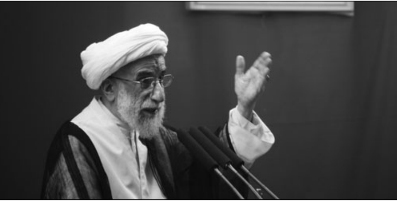
إمام جمعة طهران المؤقت آية الله جنتي خلال خطبة صلاة الجمعة

العشرات بجروح، وانتقد جنتي مجلس الأمن الدولي «الذي ألزم الصمت حيال هذه الجريمة ولم يندد بها حتى قيل أن مجلس الأمن الدولي شكّل لسلب الأمن وليس لإرساء الأمن».