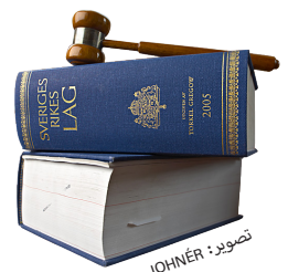
القانون السويدي يستهدف مُشتري الجنس وليس المومسات

في عام 1999، أصدرت السويد قانونها الذي يحرم شراء الخدمات الجنسية، وهو الأول من نوعه. فقد قضى القانون بأنه من غير القانوني شراء الخدمات الجنسية في السويد - جنبًا إلى جنب مع توريد تلك الخدمات الذي كان محظورًا من ذي قبل- دون معاقبة العاهرة. وفي عام 2005، أدرجت هذه الجريمة في القانون الجنائي العام. وقد اعتمد هذا النهج القانوني للسويد الذي يستهدف المشتريين بدلاً من العاملين في الجنس من النرويج وأيسلندا وكندا وأيرلندا الشمالية حتى يومنا هذا.