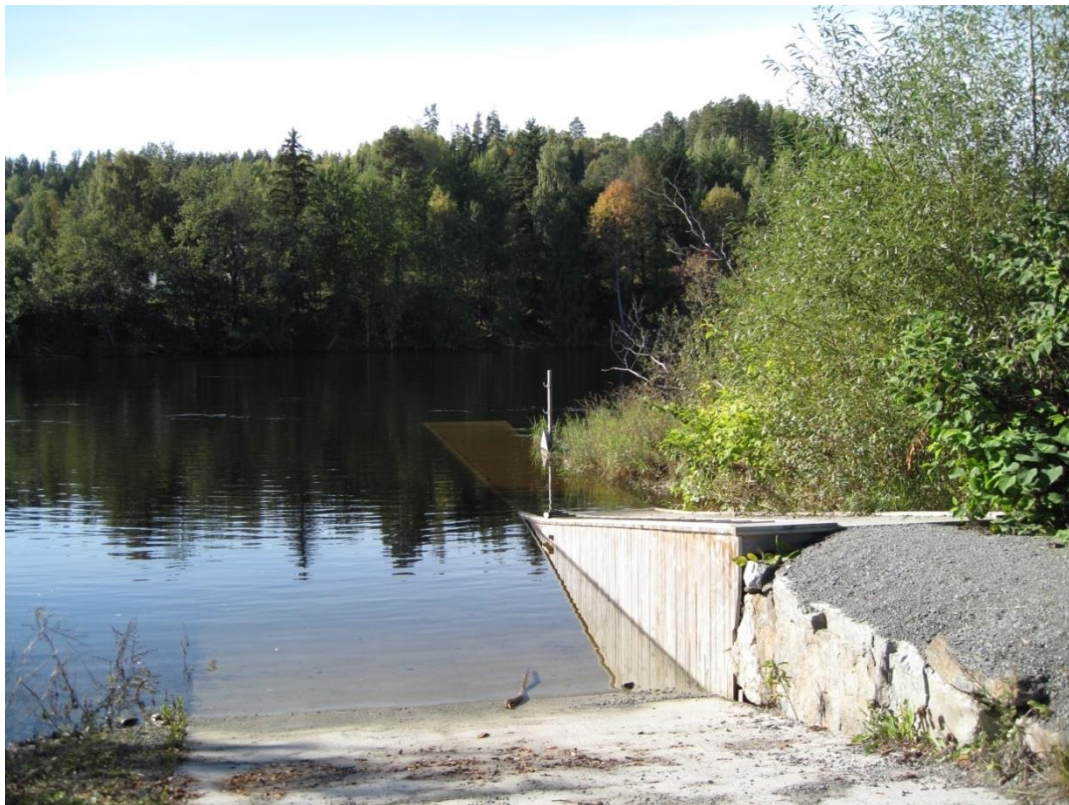
Bilde 1 Brygge ved båtutsettingsplassen er oversvømt ved flom i Storelva

Elvebreddene er påvirket av vannstanden i elva og blir oversvømt under vanlige flomsituasjoner i elvene. Elvebreddene er erosjonsutsatt. Kartleggingen er relatert til lav vannstand i elva.