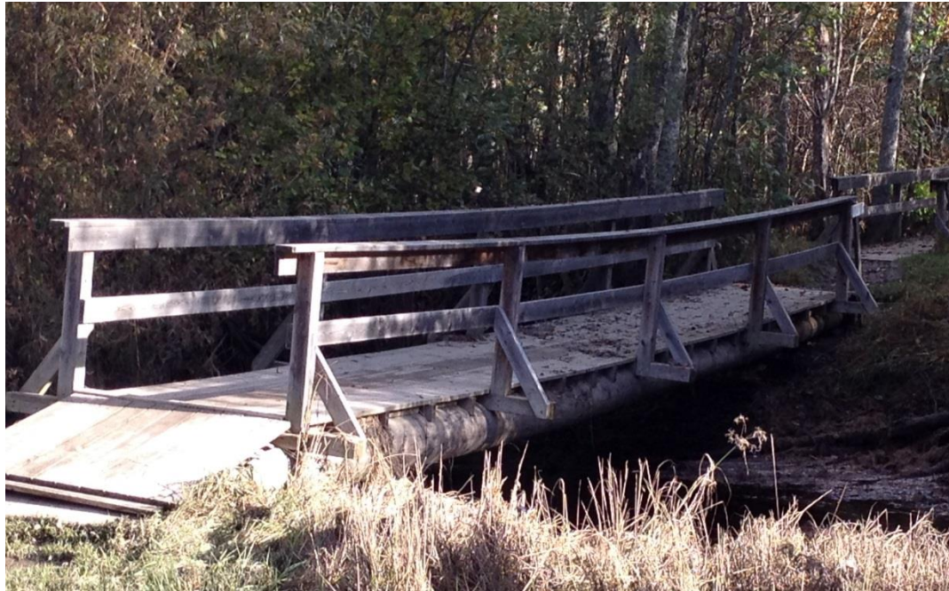
Bilde 4 Trebruer i Hovsenga

Stien fortsetter over to trebruer med høye terskler og store ujevnheter mellom. Bruene er ikke tilgjengelig for rullestolbrukere og vanskelig tilgjengelig for synshemmede med ledsagere.