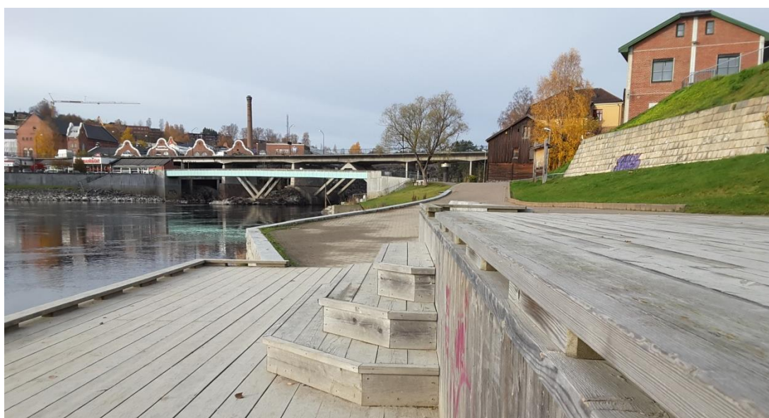
Bilde 3 Glatved brygge

Grøntområdet har flere sittegrupper i skråningen mot elva. Grøntområdet er ikke tilgjengelig med manuell rullestol og vanskelig tilgjengelig for synshemmede. En fiskeplass med sittegruppe i elvekrysset mellom Begna og Randselva har atkomst via trapp i terrenget. Fiskeplassen er vanskelig tilgjengelig for synshemmede.