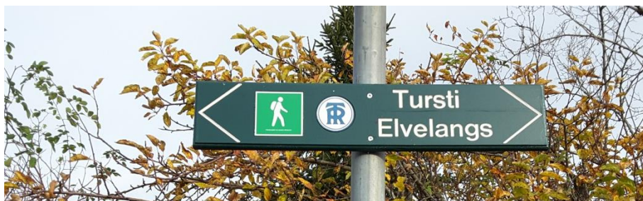
Bilde 1 DNT Ringerikes turskilt

Traséen «Elvelangs» følger gang- og sykkelveier der de finns og går ellers i rolige bolig-gater mellom friluftsområdene. Stien er skiltet med DNT Ringerikes turskilt.