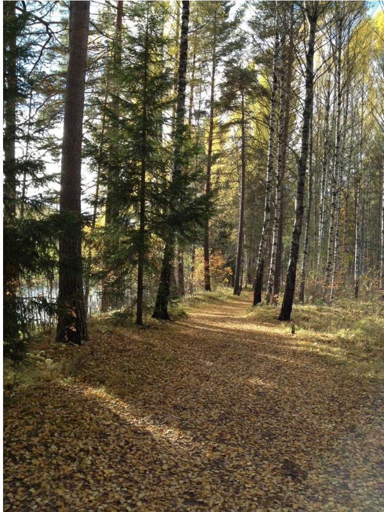
Bilde 2 Turstien i Schjongslunden

Turstiene i Schjongslunden er tilgjengelig med rullestol på deler av strekningene, men vanskelig tilgjengelig for svaksynte med ledsagere.