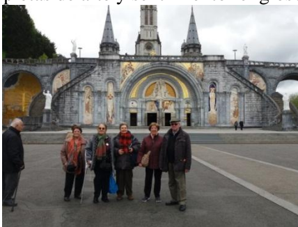
Ante la Basílica Ntra. Sra. del Rosario

El día 4 de mayo, salimos para LOURDES (Francia) . Tras el largo viaje por los maravillosos paisajes del pirineo, tuvimos el tiempo libre para visitar el conjunto de edificios y lugares dedicados al culto de la Virgen María. La Gruta, el corazón del Santuario, donde cada uno pidió la gracia más íntima y necesaria, la Basílica de Nuestra Sra. del Rosario y la Basílica de la Inmaculada Concepción, todas ellas, cada una en su género, repletas de arte y sentimiento religioso.