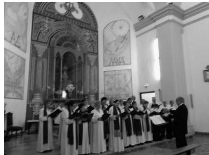
Concierto en la Iglesia Parroquial de Fuensanta (Albacete)