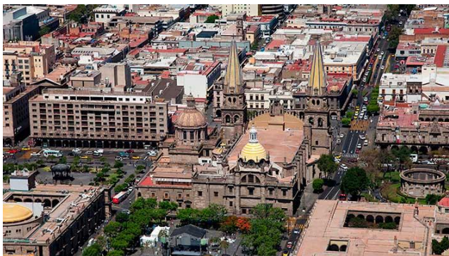
Panorámica de Guadalajara

Sobre tu intacta geografía de aroma de lunas y de escarcha Se elevan como versos dirigibles.