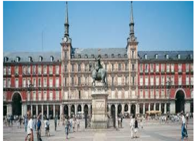
Estado actual de la Plaza Mayor

No siempre fue su fisonomía como actualmente la vemos, ya que en épocas anteriores tuvo hasta jardines y árboles, y en otras, fue comienzo y término de algunas líneas de tranvías como, por ejemplo, la que iba a los Carabancheles.