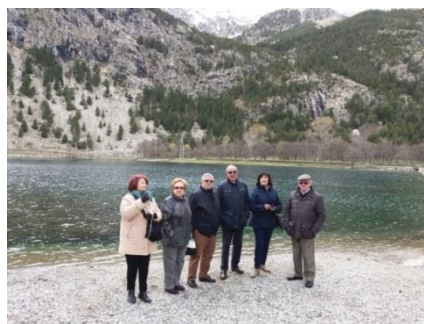
Varios excursionistas ante el lago

El autocar nos dejó junto al Lago, precioso con las cascadas vertiendo sus aguas cristalinas.