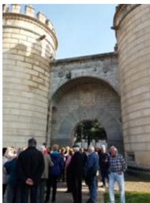
Puerta de Palmas

Comenzamos el año con una excursión a los carnavales de Badajoz, del 25 al 28 de febrero, que ocupan el lugar tercero de España en importancia.