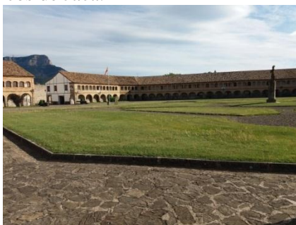
Patio de Armas de la Ciudadela

Del 1 al 6 de Mayo realizamos una estupenda EXCURSION A JACA-LOURDES . Después del reparto de habitaciones y la comida, salimos a visitar, en primer lugar, la Ciudadela uno de los sitios más emblemáticos de Jaca.