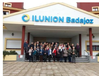
El grupo posando en la entrada al Hotel antes del regreso

El día 28, bajamos al centro de Badajoz para ver el Entierro de la Sardina en el Barrio de San Roque y el desfile de Comparsas.