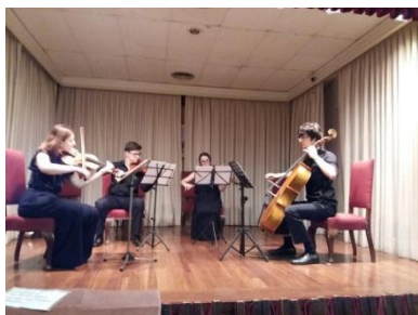
Un momento de la interpretación

El día 18 de marzo, el aula nos ofreció un concierto que corrió a cargo de dos grupos de alumnos del Conservatorio Teresa Berganza. El primer lugar intervino un cuarteto de cuerda que interpretó una exquisita sinfonía.