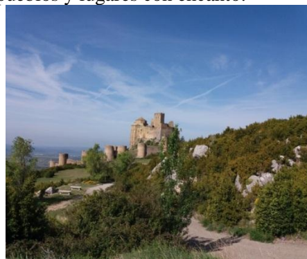
Castillo de Loarre

Al día siguiente, visitamos el CASTILLO DE LOARRE , uno de los mejores conservados, ubicado en un entorno excepcional y desde el que se divisan varios pueblos y lugares con encanto.