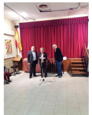
Un momento de la inauguración

La exposición pudo visitarse en horario de mañana y tarde por espacio de 25 días.