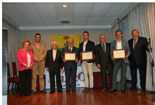
Los galardonados como tomelloseros del año 2016, con el presidente y directivos de la Peña de Tomelloso

Presidente de la Peña de Tomelloso en Madrid