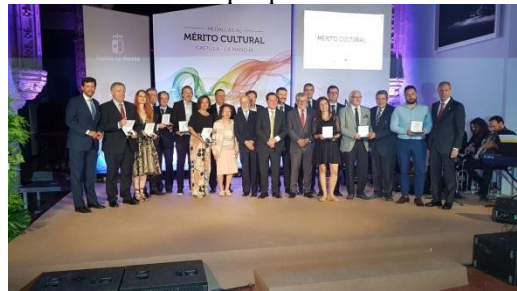
Foto de familia con todos los homenajeados

Terminó diciendo: “Descubriendo juntos. Juntos aprendiendo, por lo que a ella le pertenece la mitad de la medalla. La otra mitad se la entrego yo para no tener que partirla”.