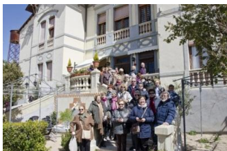
El grupo en la escalera de Villa Manolita

Seguidamente, nos acompañaron para visitar el lavadero público, el Arco Árabe, Villa Manolita y la Cruz del Humilladero.