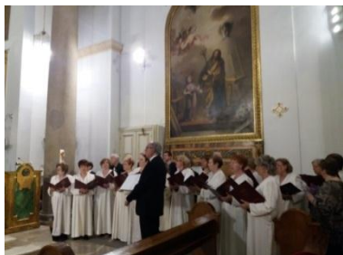
La Coral durante la misa