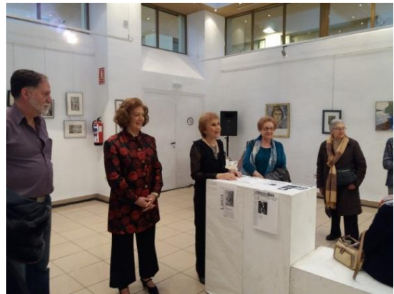
Un momento de la inauguración

En ella recoge una colección de obras que reflejan los distintos estilos que ha trabajado a través de su larga y fructífera vida pictórica.