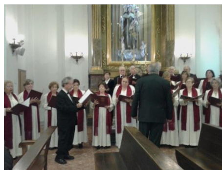
La coral cantando el Himno a San Julián, al final de la misa

El 28 de Enero tuvo lugar la Misa Concelebrada en Honor de San Julián Patrón de Cuenca, organizada por la Real e Ilustre Congregación de San Julián, a la que asistieron diversos miembros de la Junta Directiva de la Casa. Participó en la Misa nuestra coral “Jacinto Guerrero”