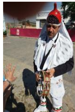
Detalle de un traje de los Danzantes, con la pandereta y máscara, en la cabeza

La historia y personajes podrían remontarse a los s. XVI y XVII, cuando las danzas optaron la argumentación de Auto Sacramental. En él se confrontan el bien y el mal representados en los Danzantes y los Pecados, respectivamente. Fiesta muy peculiar de gran colorido, belleza y mímica, acompañada de gritos, música y pólvora.