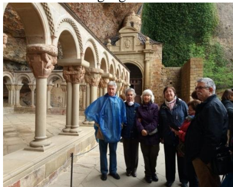
En el claustro

Al día siguiente , tras el desayuno, nos dirigimos al Monasterio de SAN JUAN DE LA PEÑA , allí nos esperaba un guía oficial, que nos condujo por este lugar emblemático de nuestra geografía e historia.