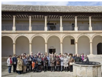
El Grupo en el Claustro del Monasterio de la Virgen de los Remedios