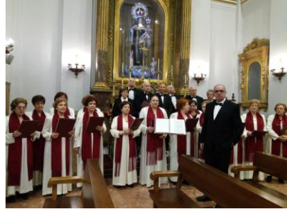
Misa en la Iglesia de Santiago y San Juan

*En Real Oratorio del Caballero de Gracia, Misa a las Vírgenes de la Casa de Castilla-La Mancha.