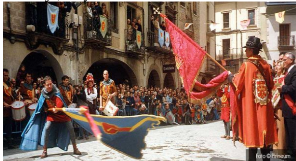
Bailando las banderas

A continuación visitamos el Valle de Hecho , igualmente de gran belleza que conserva, entre sus bienes culturales, la lengua “chesa”, que aún hablan sus habitantes y, además de su iglesia visitamos un Museo del Traje, muy interesante.