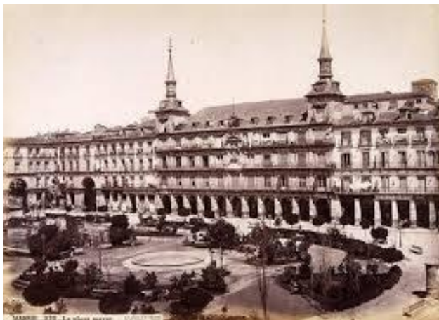
La Plaza Mayor con jardines

La Plaza Mayor sirvió de marco para corridas de toros, bodas reales, canonizaciones y autos de fe. En la actualidad se celebran actos como la Feria Nacional del Sello, en el mes de Abril, conciertos de música y el Festival Folclórico de las Casas Regionales ubicadas en Madrid, en las fiestas de San Isidro, patrón de la Villa. Misa concelebrada el día 9 de noviembre festividad de Nuestra Señora de la Almudena, patrona de Madrid. Y finaliza el año en el mes de diciembre con el tradicional Mercado Navideño.