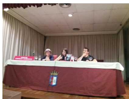
Un momento del acto