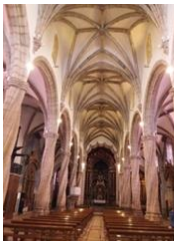
Iglesia de María

Al día siguiente, después del desayuno salimos en el autocar hasta OLIVENZA , ciudad que fue portuguesa y actualmente española, que a todos encantó por su limpieza y silencio. El guía nos condujo por los monumentos más importantes como fueron: Magdalena, gótico Manuelino, Iglesia de Ntra. Sra. del Monte y la Alcazaba.