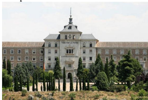
Fachada principal y uno de los patios