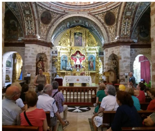
El grupo escuchando las explicaciones de la guía

Como el día era muy caluroso, fuimos a visitar la Ermita del Santo Cristo de Santa Ana, cubierta de frescos y altar barrocos.