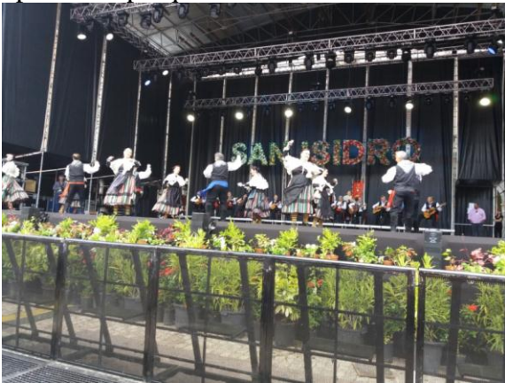
Actuación del Grupo Hidalguía en la Plaza Mayor el 14 de Mayo de 2017, en honor a San Isidro

Y es que para poder mostrar una pieza en un escenario, hay detrás un trabajo arduo de investigación y conservación, no sólo en el baile y en la música. Investigar todo lo que rodea al folklore (períodos agrícolas, momentos festivos, vestuario,...) y, sobre todo, conservarlo, de la forma más autóctona para que se pueda mostrar tal y como se hacía antiguamente. Y ha sido gracias a esta labor de conservación, por lo que gente de mi generación (y por supuesto, de las venideras) hemos podido conocer muchas cosas que sin el folklore no hubiéramos podido saber, simplemente porque no nos tocó vivirlas.