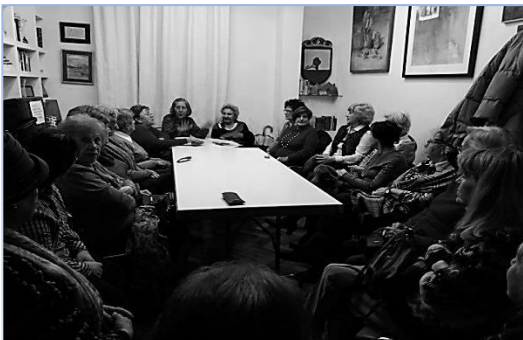
Una de las reuniones

En el mes de Octubre comenzamos el nuevo Curso con el tema “ Madrid en el siglo XIX y su Museo del Romanticismo, un viaje en el tiempo ” que nos dio ocasión para repasar la historia y los acontecimientos de esta época. Y para completar este tema, en Noviembre tuvimos nuestra sesión de Poesía , dedicada a poetas románticos. Ya en época navideña, organizamos una merienda, amenizada con Villancicos . Comenzamos el nuevo año 2017, poniendo nuestra memoria a pleno rendimiento, repasando y recordando muy variados temas y hay que destacar lo bien documentado y preparado que está nuestro grupo para contestar con rapidez y buenos reflejos.