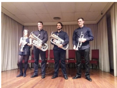
Saludando tras la actuación

En segundo lugar, nos deleitó con varias obras un cuarteto de viento.