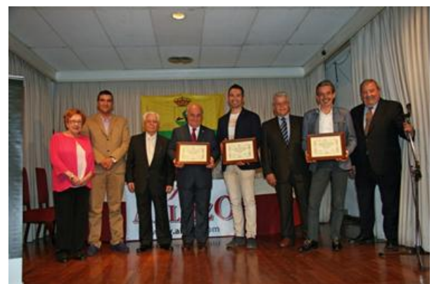
Los galardonados como tomelloseros del año 2016, con el presidente y directivos de la Peña de Tomelloso

Presidente de la Peña de Tomelloso en Madrid