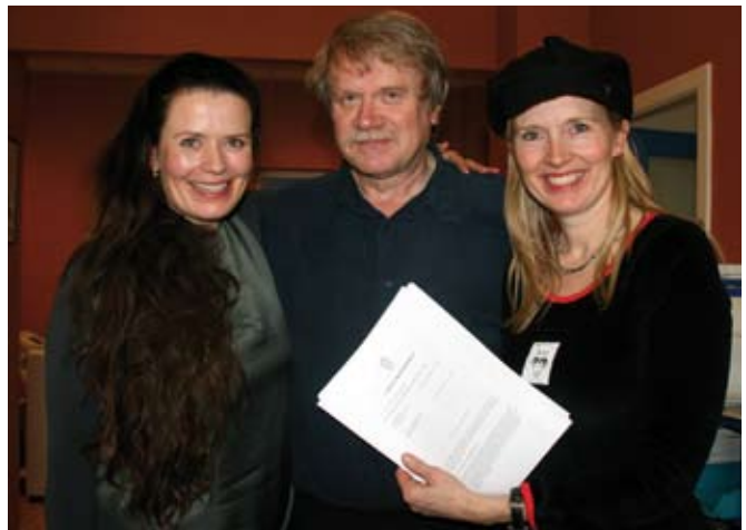
En blid gjeng med Høyesteretts dom i mars 2010.