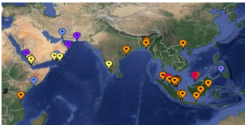
Slika 1 – Raspodela piratskih napada i oružanih pljački oko Somalije, Kineskog južnog mora i moreuza Malaka (Piracy & Armed Robbery Map 2014)

Međutim, moreuz Malaka i povezana pomorska zona koja je deo Kineskog južnog mora, bili su poznati po piratskim aktivnostima mnogo pre nego što su postojali somalijski pirati. U 2004. godini bilo je prijavljeno 169 piratskih napada, što je činilo 60% od ukupnog broja piratskih napada u svetu te godine (news.sohu.com). Danas se u ovoj pomorskoj zoni još češće dešavaju piratske otmice i teroristički napadi na moru, što ovu oblast čini jednom od najopasnijih pomorskih zona na svetu. U 2011. godini u ovoj zoni je zabeleženo 70 piratskih napada, što je 24 % više nego u 2010. godini (www.chinanews.com). Na slici 1. prikazana je raspodela piratskih napada i oružanih pljački na moru u toku 2014. godine, gde je uočljivo da je gustina napada, osim oko Somalije, najveća u oblasti Kineskog južnog mora i moreuza Malaka.