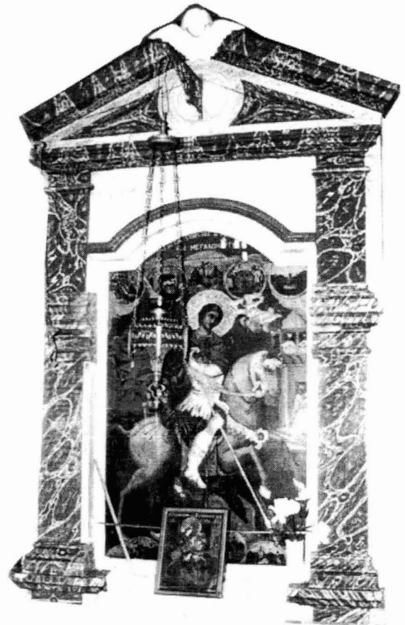
Το προσκυνητάρι με τον Άγιο Γεώργιο

Η επόμενη εικόνα του τέμπλου είναι αφιερωμένη στο πρόσωπο του Αγίου Κλήμη αρχιεπισκόπου Οχριδών του Θαυματουργού. Ο Άγιος με πλήρη αρχιερατική στολή (μούσσο) με το δεξί του χέρι ευλογεί, ενώ με το αριστερό κρατά κλειστό ιερό Ευαγγέλιο. Το εξώφυλλο του Ευαγγελίου είναι διακοσμημένο με την ολόσωμη μορφή του ευλογούντα Χριστού. Παράλληλα με το δεξί του χέρι ο Άγιος συγκρατεί την αρχιερατική ποιμαντική του ράβδο.