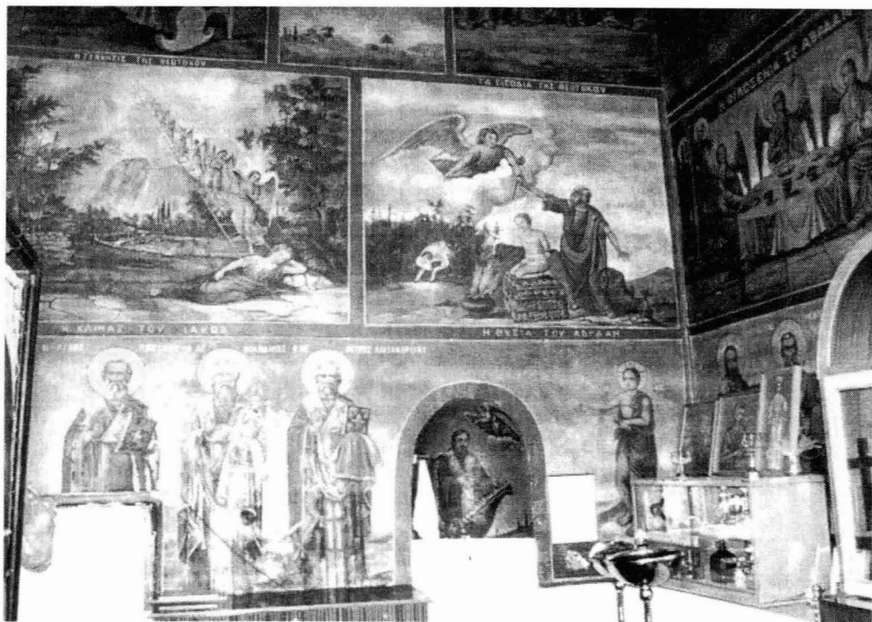
Τοιχογραφίες στο εσωτερικό του Ιερού Βήματος

3. Επιμέλεια Γ. Τουσίμη "Εκθέσεις προξένου Βατικιότη προς Υπουργό Εξωτερικών" - Νο 1/2.1.1868 και Νο 14/8.1.1868 - Ιστορικό Αρχείο Υπουργείου Εξωτερικών - Φάκελος 1868 Προξενίου της Ελλάδος στη Θεσσαλονίκη.