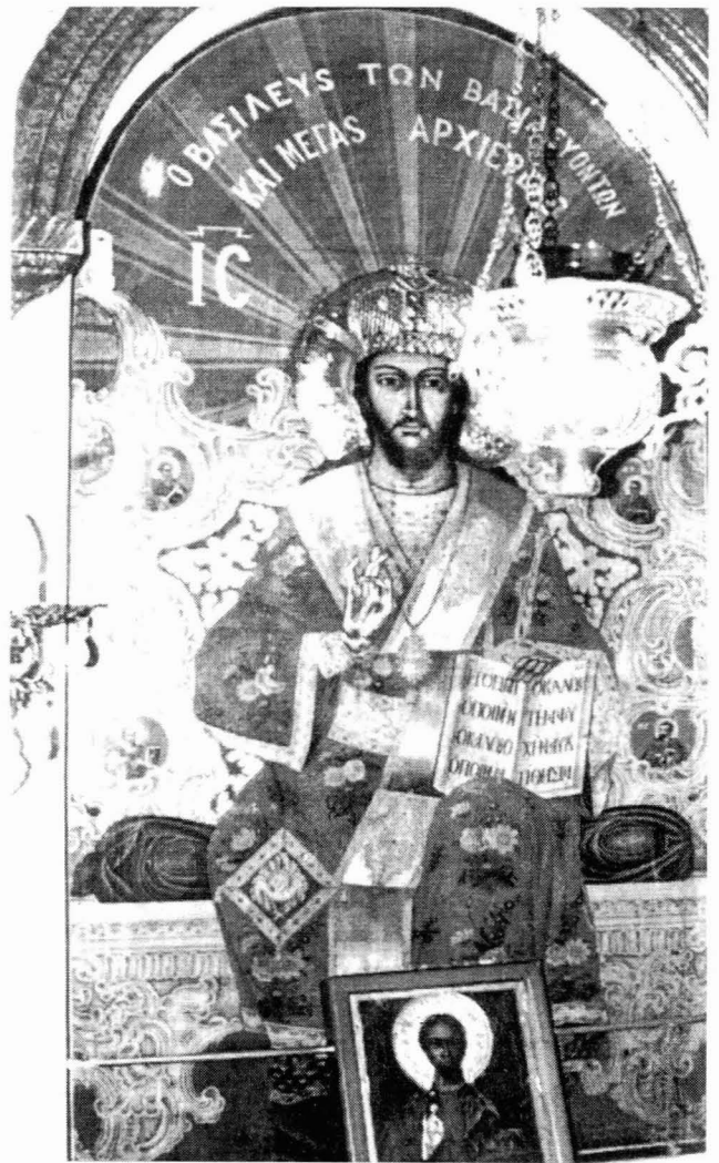
Ο Βασιλεύς των Βασιλέων και μέγας Αρχιερεύς