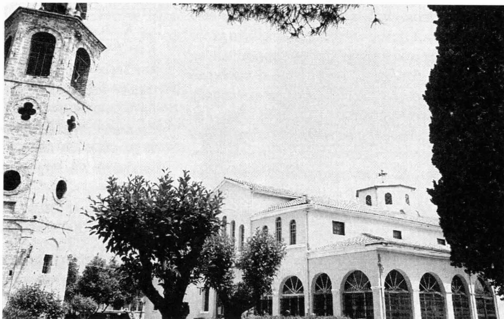
Γενική άποψη του Ναού και του καμπαναριού από τα νοτιοδυτικά

Να πως περιγράφει στο μνημειώδες έργο του Ε. Στουγιαννάκης τα γεγονότα των πρώτων ω-