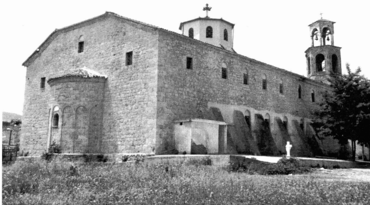
Βορειανατολική άποψη του ναού

περιουσιακά στοιχεία, δεν διαθέτουμε πολλές πληροφορίες σχετικά με τη διαχείρισή τους. Ενδεικτικά αναφέρουμε Πωλητήριο - έγγραφο του 1868 με το οποίο ο Ναός πωλεί κτήμα του στη θέση Παπαράντος. Διαβάζουμε σχετικά: