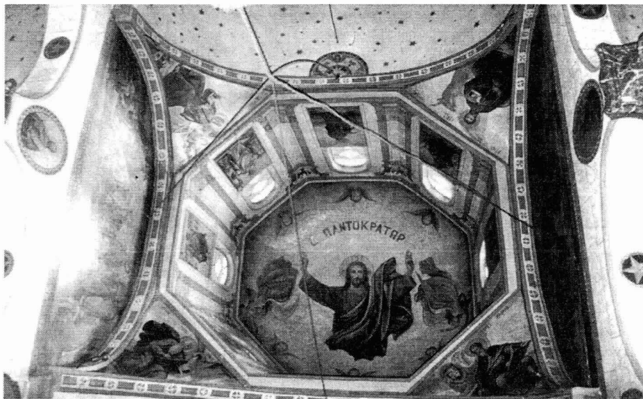
Ο τρούλος του του ναού (μεταγενέστερη προσθήκη)

ΕΓΩ ΕΙΜΙ / Ο ΠΟΙ- ΜΗΝ / Ο ΚΑΛΟΣ Ο / Ο ΠΟΜΗΝ Ο ΚΑΛΟΣ / ΤΗΝ ΨΥΧΗΝ ΑΥΤΟΥ / ΤΙΘΗΣΙΝ