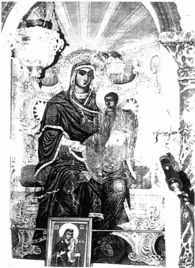
Η Παναγία Βρεφοκρατούσα