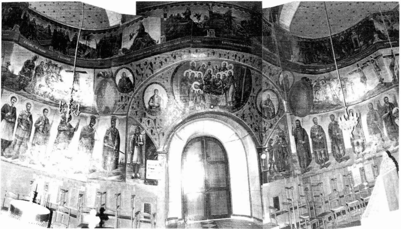
Οι τοιχογραφίες της δυτικής πλευράς του ναού γύρω και πάνω από την είσοδο

Εντιμοτάτων Κυρίων ζοσταράδων δια Γρ: 400 ων η μνήμη αιωνία 1843 Νοεμβρίου 11 χειρ αποστο- λάκη παπά Δημητρ βερροιαίου