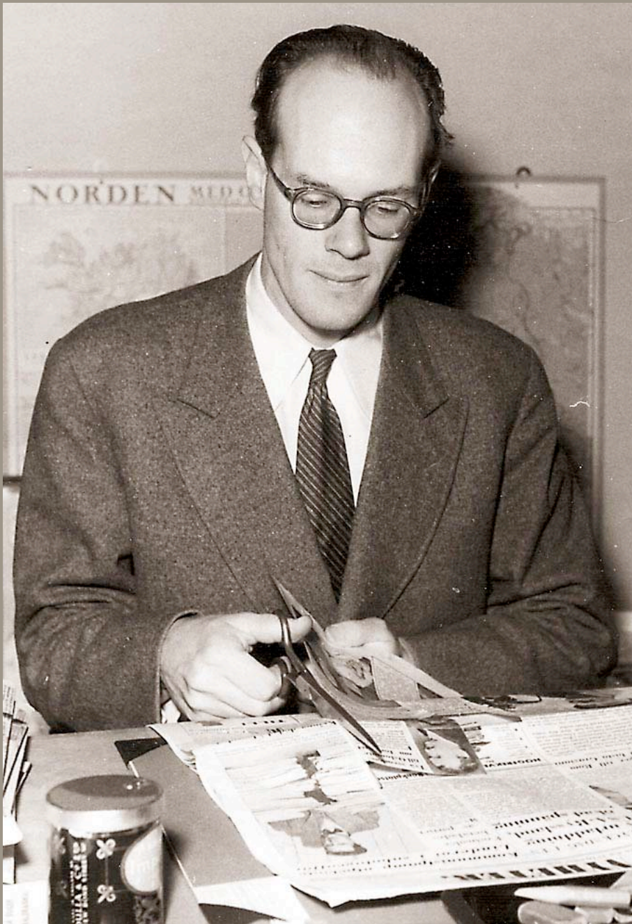
Svensk-Amerikanska Nyhetsbyrån 1948

Den 7 oktober 2002 efter lunch går pappa ut för att hämta medicin på apoteket Lejonet vid Hamngatan, mittemot NK. Han tar 62:ans buss ner till Kungsträdgården och stiger av vid Karl XII:s staty. Hunnen till Molins fontän känner han sig trött. Solen skiner, det är varmt för att vara oktober. Han sätter sig ned på en bänk och där, på ett ögonblick, dör han.