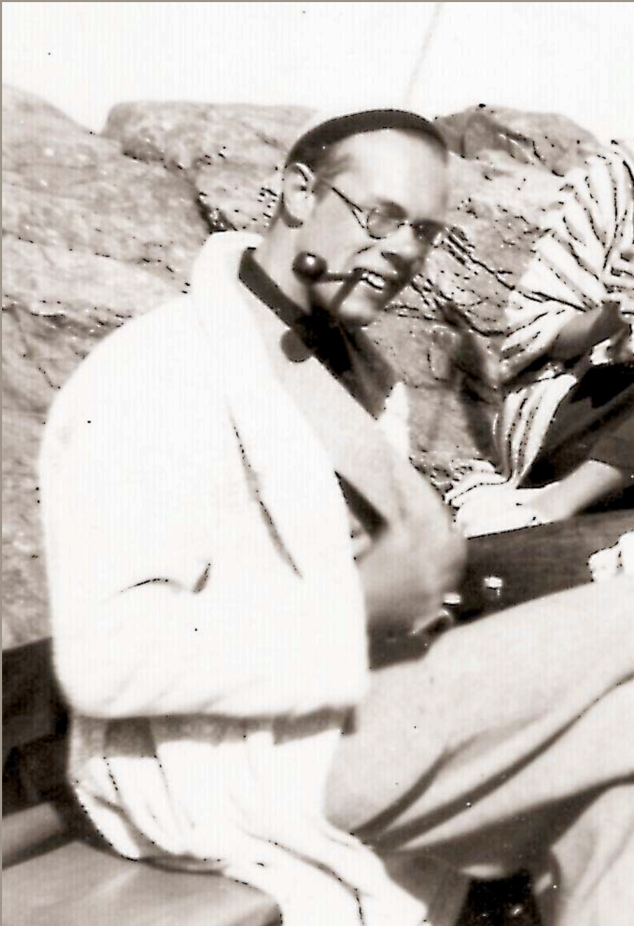
I sin motorbåt, Öregrund 1932