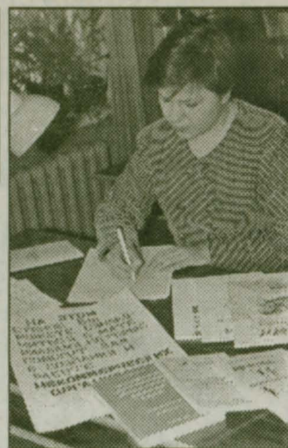
организаций в России" и другая литература по этому вопросу.

"Деньги и благотворительность", "Налоги и благотворительность". Как создать общественное объединение молодежи, "Ярмарки некоммерческих организаций", "Налогообложение и бухгалтерский учет для некоммерческих