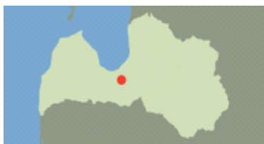
Piņņa strauts, Piņņu strauts