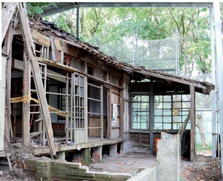
閒棄數十年、未整修前的壹號館。修繕完成後，再度開啟居民的記憶。

1994年文建會推動社區總體營造之始，大溪居民以各種身分、各種群體，逐年地被動員起來，包括文建會、經濟部、文資局、城鄉局、文化局等單位持續以計畫案進駐，調查了大溪文化資源、也凝聚居民共識；居民自發地組織了數個協會，如大溪鎮歷史街坊再造協會、大溪老城區形象商圈發展協會、大溪鎮愛鎮協會等等，它們皆持續運作，並與當地公部門、學校，建立了長久良好的合作關係。