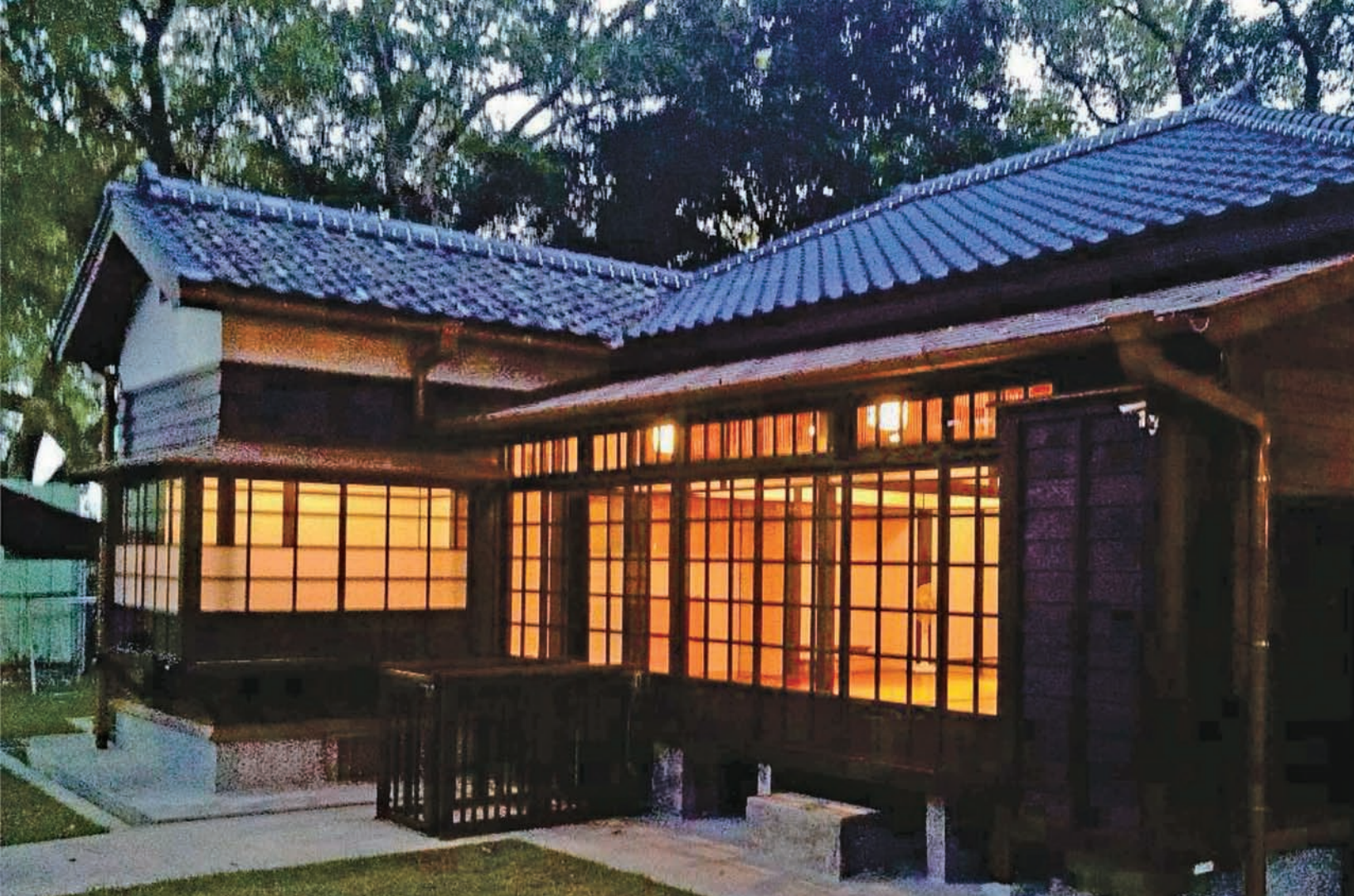
修繕完成的大溪國小日式宿舍，做為木博館第一棟公有館舍。

般，擁有如此豐富的天然資源、獨到的地方產業與飲食文化；桃園唯一一座國定古蹟「李騰芳古宅」也座落在大溪；華人音樂史閃亮的巨星，鳳飛飛，也出身和平老街的草店尾；2012年，全臺灣的人，則送給了大溪「十大觀光小城之首」的勳章。