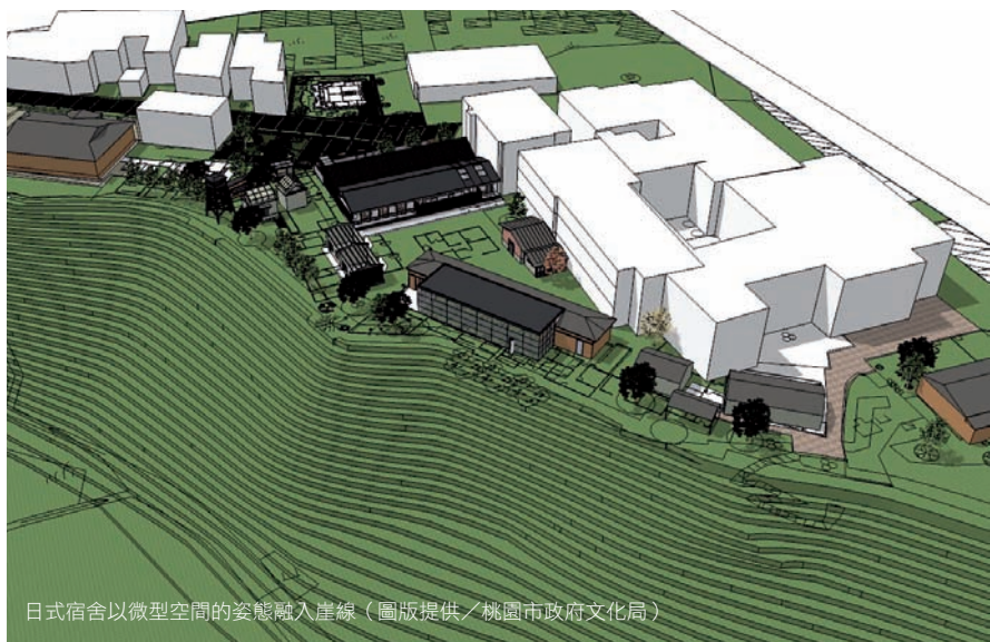
日式宿舍以微型空間的姿態融入崖線

國民政府轉進之後，大溪因為自然環境與浙江省溪口的風景頗有雷同之處，公會堂被納為蔣公行館，甚至在西南側另建新屋為起居之所，武德殿亦成為憲兵隊辦公室。公會堂在1978年改為蔣公紀念館，隨著民主解嚴，威權空間解放，2005年再更名為「大溪藝文之家」；武德殿經過2000年的大整修，也改建為提供居民申請活動展演的開放場所；武德殿周圍也出現許多水泥增建物，每一戶小房子，都述說著大時代小人物的身世故事。