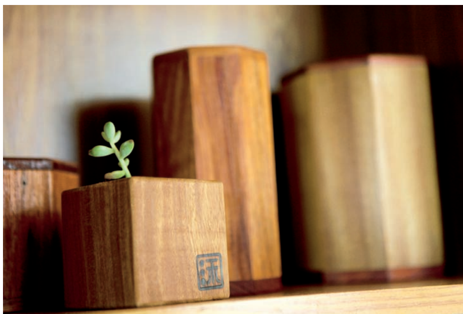
木器手作小物，展現木藝生活。