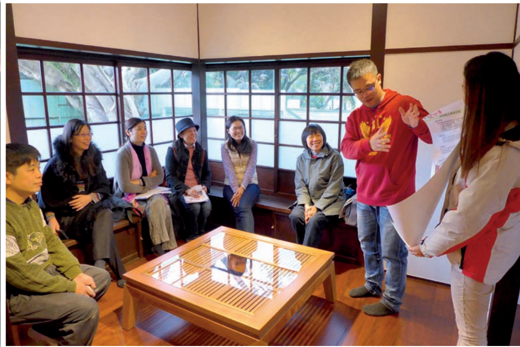
木博館內所有家具，都由大溪木藝匠師設計製作。圖為匠師正在與博物館委員分享創作理念。

數十年觀念革新的文化運動。相較於也是以「生態博物館」為理念發起的黃金博物館、蘭陽博物館，開館十年後或許因為政策變化、文化治理角度調整，漸漸又回到博物館圈內的世界，桃園以這樣的精神在大溪開展它第一座市立博物館，與大溪原來的聚落紋理共存，並以館名提醒自己在未來的發展上莫忘初衷。