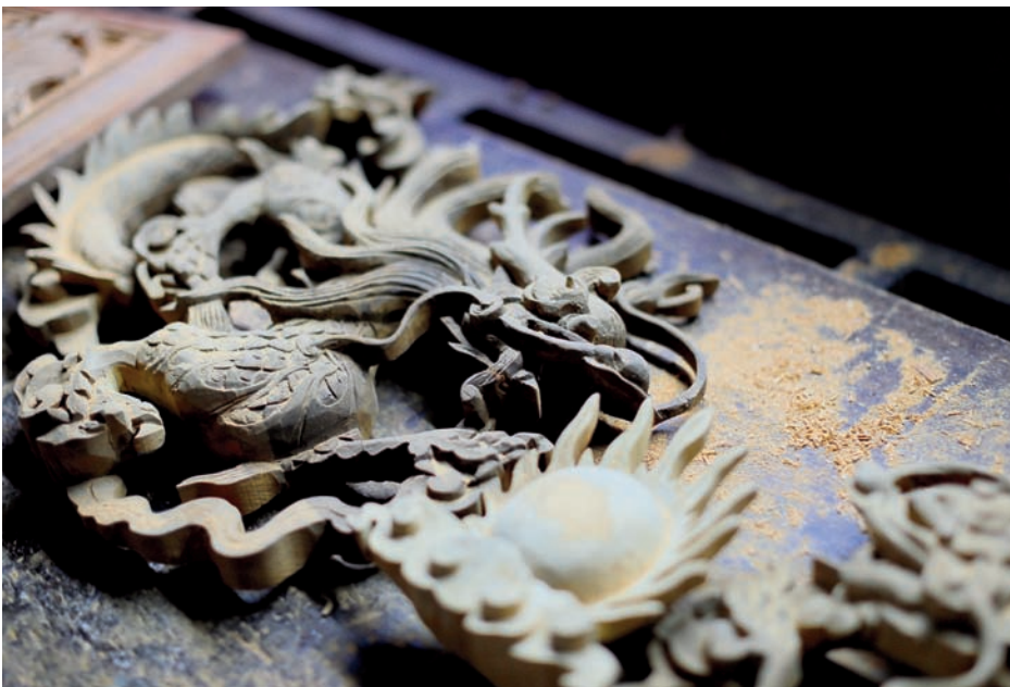
與地方知識、風土民情緊密相關的大溪木藝。