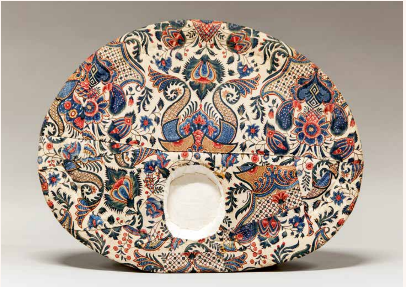
Afb. 35 (links): Kleine zonhoed met gebogen rand. Katoen, bedrukt en geveefd in sitstechniek, India 1700-1750, 39 x 45 cm. Fries Museum Leeuwarden