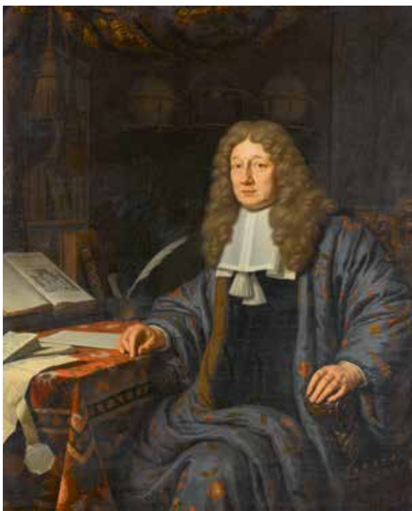
Afb. 19 (boven): Michiel van Musscher, Portret van Johannes Hudde in een japonse rok van beschilderde zijde, 1686. Rijksmuseum Amsterdam