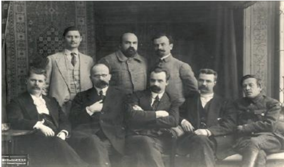
Генеральний Секретаріат УЦР. 1917 рік. Сидять справа наліво: С. Петлюра, С. Єфремов, В. Винниченко, Хр. Барановський, І. Стешенко. Стоять справа наліво: П. Матрос, М. Стасюк, П. Христюк.

Після реорганізації Генерального Секретаріату в Раду Народних Міністрів і зміни соціал-демократичного її керівництва (В. Винниченка) на есерівське (В. Голубовича) П. Христюк обійняв посаду міністра внутрішніх справ, а в лютому – Державного секретаря Ради Народних Міністрів УНР. То були важкі часи для Української Народної Республіки, її урядових інституцій. Довелось під тиском радянських військ залишати Київ і евакуюватись на Волинь, працювати під пресом австро-німецьких окупантів після повернення з ними до Києва іноземне втручання обмежувало суверенітет УНР. Недаремно П. Христюк писав, що окупаційне «військо стало вирішальним чинником для внутрішньої політики Республіки спочатку посереднім, а потім і безпосереднім» [2, с. 65].