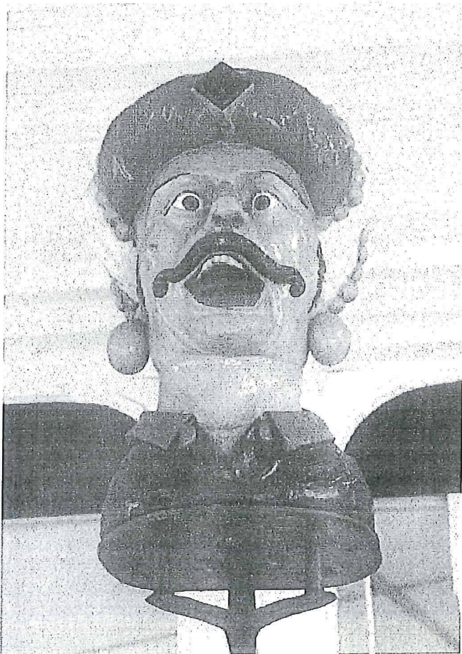
Gaper bij markt 6. Dit vormde het herkenningsteken van een drogist of apotheek.

In de negentiende eeuw was de neorenaissance populair maar ook het mengen van elementen van stijlen werd veelvuldig gedaan. Dit werd eclecticisme genoemd: men koos uit verschillende stijlen. Een fraai voorbeeld hiervan is de pui van "Koffie