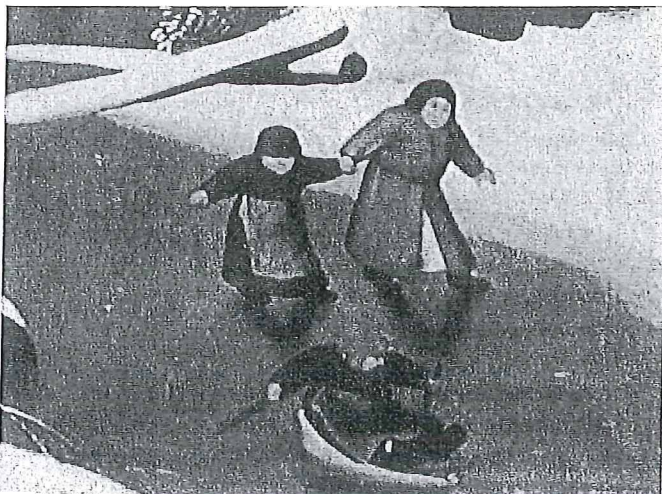
Kind op sleeje. Detail van het schilderij "Volkstelling te Bethlehem" van Pieter Breugel uit 1566 (Bonnefantennmuseum te Maastricht).

Wie door het winkelcentrum van Gouda loopt, zal zich niet realiseren dat deze manier van inkopen doen, die we "winkelen" noemen, pas een goede eeuw oud is. In de middeleeuwen kocht men dagelijkse levensbehoeften als groenten en fruit op de markt. Koopwaren werden net als nu op de weekmarkt in kramen of gewoon op straat aangeboden. Voor luxe en exotische goederen zoals zijden stoffen was men aangewezen op de internationale jaarmarkten in de grotere steden. Andere goederen werden verkocht op een speciale plaats zoals een visbank, een korenbeurs of een vleeshal. De vleeshal was in Gouda, net als in de meeste andere steden, in het raadhuis ondergebracht.