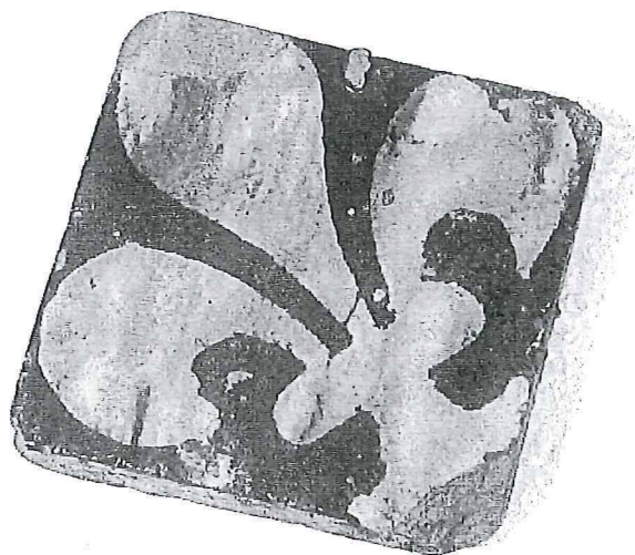
Vloertegel (rood) met witte slijbversiering (Franse lelie) uit de veertiende eeuw. Afmetingen 9 x 9 x 1,2 cm. Veel toegepast in kerken, kloosters en huizen van voorname lieden.

In 1340 was al melding gemaakt van de Jans Clerxstraat (of Jan Klerkstraat) waarmee dezelfde straat wordt bedoeld. Aannemelijk is dat het gebied al voor 1335 in cultuur is gebracht. De percelen aan de Keizerstraat zullen tussen 1335 en 1350 voor bebouwing zijn uitgegeven. Aan de westzijde, op de plaats van de opgraving, gebeurde dat rond 1350.