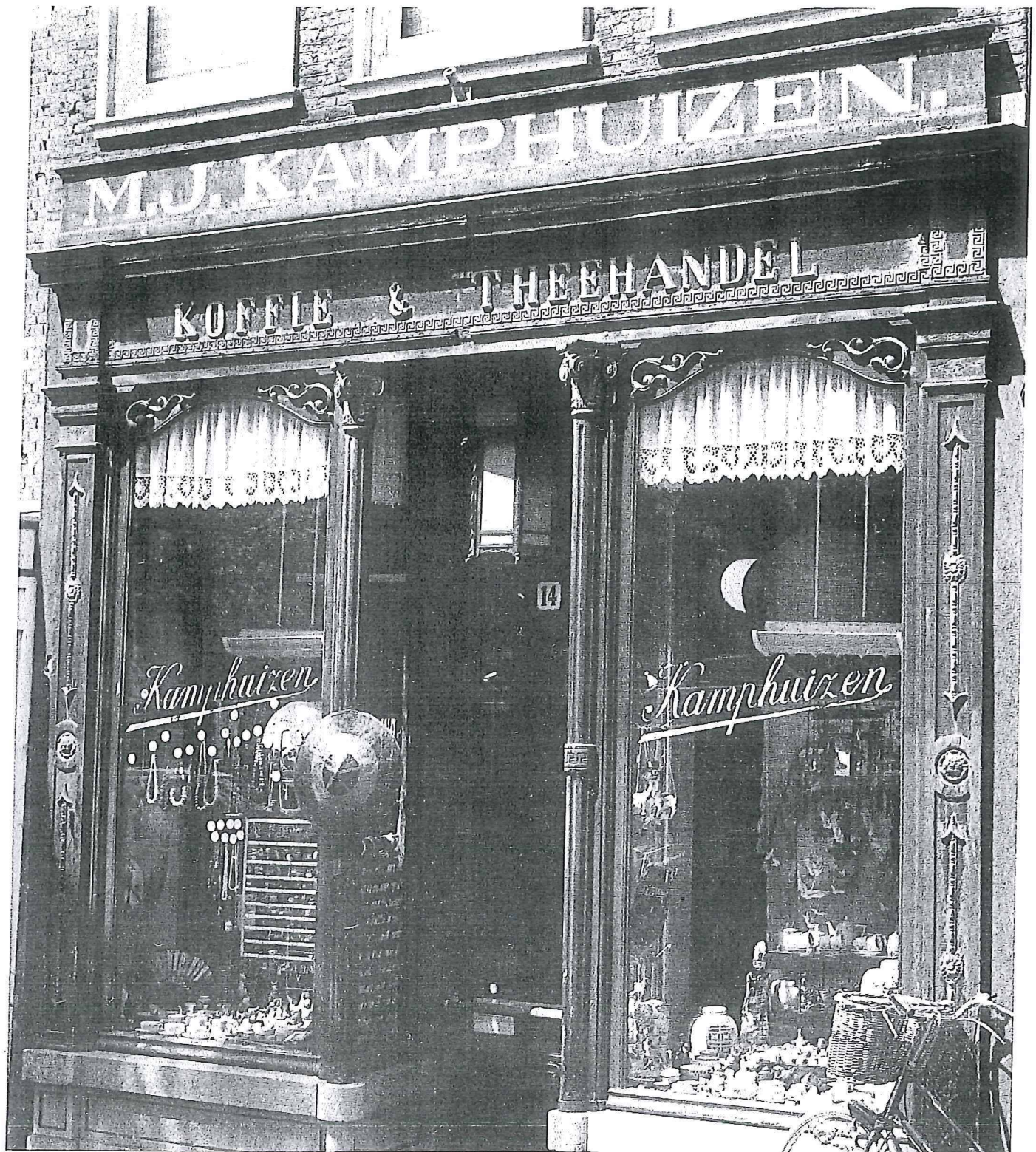
De pui van "Koffie en Theehandel Van Kamphuizen" aan de Lage Gouwe. Een goed voorbeeld van eclecticisme: elementen van verschillende stijlen zijn hier vermengd.

en Theehandel Van Kamphuizen" aan de Lage Gouwe. Het gaat hier om een eclecticismische pui voorzien van pilasters met korinthische kapitelen, een kroonlijst met meanders en gebogen ramen. Een eenvoudiger pui in deze stijl bezit Café Koen aan de Korte Groenendaal met vijf pilasters die zijn voorzien van geometrische motieven en rijk bewerkte composietkapitelen. Rond de eeuwwisseling kwam de Jugendstil op. In