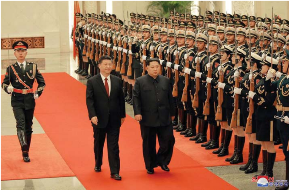
KIM DZSONGUN FOGADTATÁSA PEKINGBEN