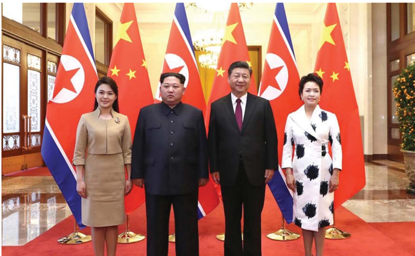
KIM ÉS HSZI FELESÉGEIK TÁRSASÁGÁBAN

Az elmúlt napok kiemelkedően fontos eseménye volt Kim Dzsongun észak-koreai vezető látogatása Pekingben. A magyar sajtó hallgatott róla. Láthatóan jót nem mertek mondani, rosszat pedig vélhetően nem akartak. Végül is a KNDK vezetőjének partnere nem más volt, mint Hszi Csin-ping, a Kínai Népköztársaság elnöke, a Kínai Kommunista Párt főtitkára.