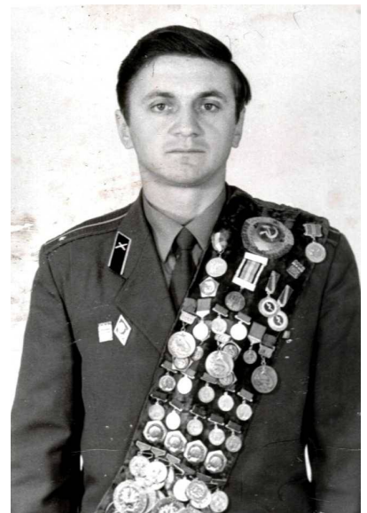
Фото 64 (зправа). Любомир Стрельбицький – бронзовий призер Чемпіонату Європи в складі команди та Чемпіон Європи 1970 року на дистанції 50 метрів

Фото 63 (зліва). Фото В.Резнікова - бронзового призера Чемпіонату Європи 1970 року на першій сторінці журналу «Спорт в СРСР».