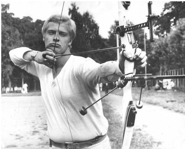
Фото 83. Ігор Прокопів - Чемпіон Європи 1986 та 1987 років

Чемпіоном Європи 1987 року у приміщенні (Франція, Parigi-Bercy) як в особистій так і в командній першості став Ігор Прокопів.