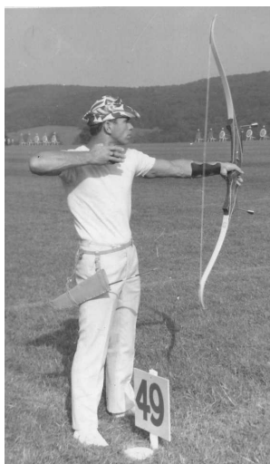
Фото 67. Стріляє Віктор Сидорук – Чемпіон Європи 1970 року, Чемпіон Світу 1973 року

таких сильних поривів вітру, що учасники змагань вимушені були виносити точки прицілювання аж у сусудні щити.