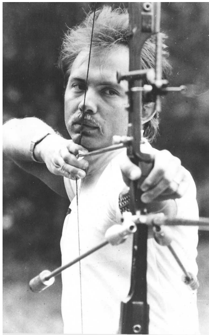
Фото 85. Костянтин Школьний – Чемпіон СРСР 1987 року