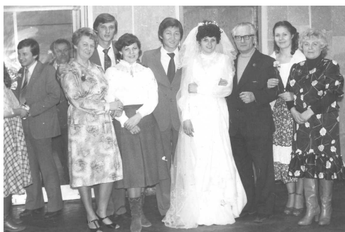
Фото 78. Львів, 1982 рік, весілля Надії Окпиш та Володимира Єшеєва

28 січня 1982 року у Львові урочисто відсвяткували весілля чудової лучної подружньої пари Надії Окпиш та Володимира Єшеєва. На весілля приїхала практично уся національна збірна команда зі стрільби з лука. На той час Надія Окпиш вже була рекордсменкою Світу, майстром спорту міжнародного класу, членом національної збірної команди. Володимир Єшеєв на той час також був вже відомим лучником, який мав низку перемог як на національних так і на міжнародних змаганнях. У 1990 році він закінчить Львівський державний інститут фізичної культури, у 1988 році стане бронзовим призером XXIV Олімпійських ігор у Сеулі, чемпіоном світу 1987 року, чемпіоном Європи 1982 та 1983 років,