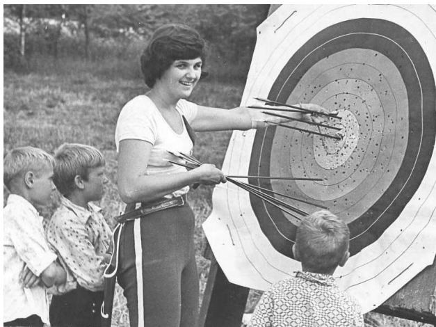
Фото 79. Надія Окниш – МСМК, Чемпіонка СРСР, рекордсменка світу у складі команди