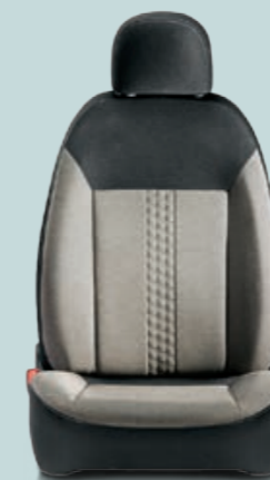
162 Melange Beige