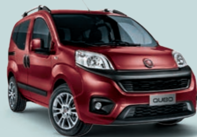
293 ROSSO AMORE