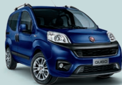
487 BLU MEDITERRANEO