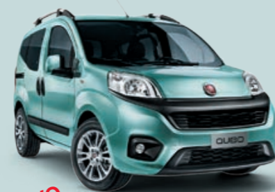
NUOVO 333 AZZURRO LIBERTÀ