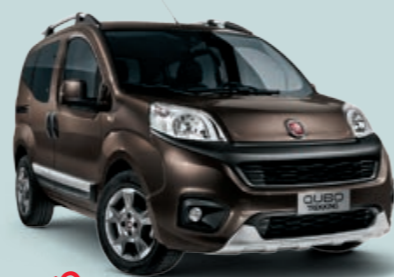
NUOVO 444 BRONZO MAGNETICO*