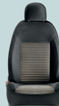
213 Sail Grigio/Nero