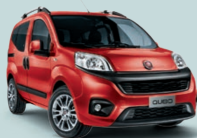
168 ROSSO PASSIONE