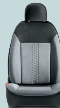
163 Melange Grigio