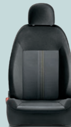
094 Jeans Nero