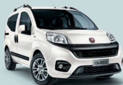
249 BIANCO GELATO