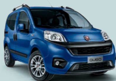
479 BLU RIVIERA