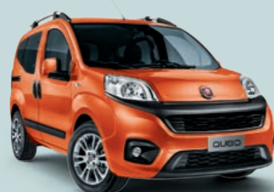
551 ARANCIO SICILIA