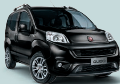
632 NERO TENORE