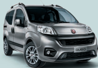
612 GRIGIO MAESTRO