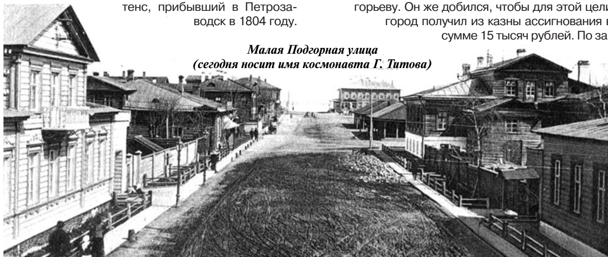
Малая Подгорная улица (сегодня носит имя космонавта Г. Титова)

Городские летописцы утверждают, что идея установки на площади памятника Петру Великому принадлежит губернатору Григорию Григорьевичу Григорьеву. Он же добился, чтобы для этой цели город получил из казны ассигнования в сумме 15 тысяч рублей. По за-