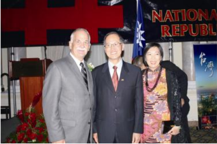
駐加拿大代表李大維夫婦於國慶酒會與加國公安部長戴維克 (Vic TOEWS) (左 1) 合影 (10 月 6 日)