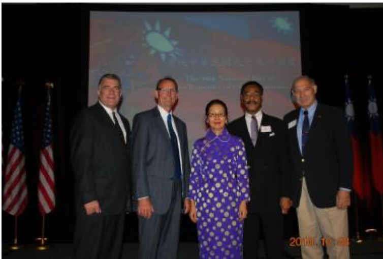
駐堪薩斯處長劉姍姍（中）於慶祝中華民國 99 年國慶酒會與堪薩斯州州務卿畢格（Chris BIGGS）（左 1）、密蘇里州聯邦眾議員克里福（Emanuel CLEAVER）（右 2）合影（10 月 8 日）