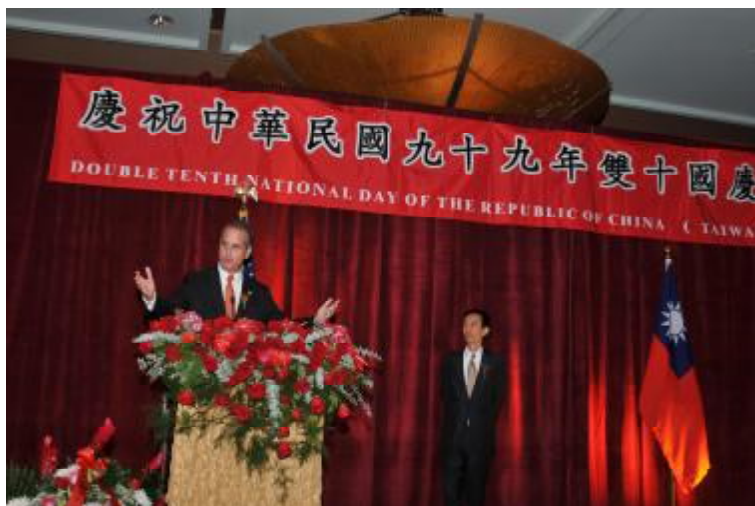
駐邁阿密辦事處舉辦國慶酒會邀請美國聯邦眾議員迪馬里 (Mario DIAZ-BALART) 致詞 (10月7日)