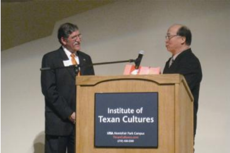
臺中市市長胡志強訪問美國德州（1月15日）