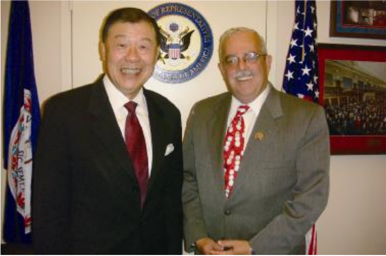
駐美國代表袁健生與美國聯邦眾議院「國會臺灣連線」共同主席康納利 (Gerald CONNOLLY) 合影 (12 月 9 日)