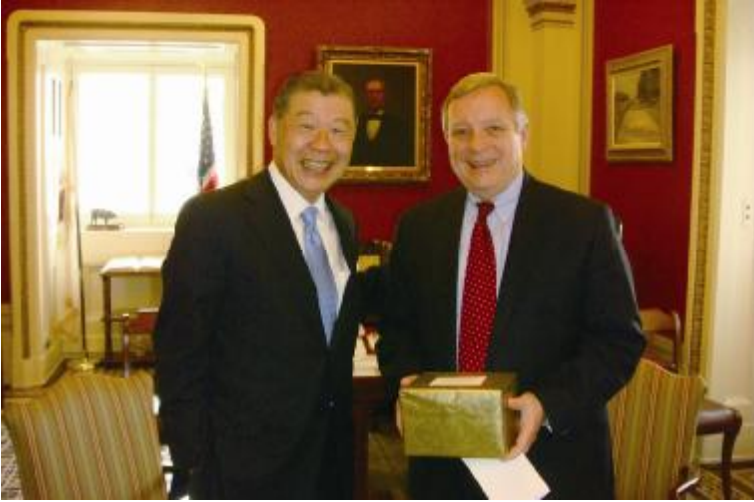
駐美國代表袁健生與聯邦參議院民主黨黨鞭杜賓（Dick DURBIN）合影（3月11日）