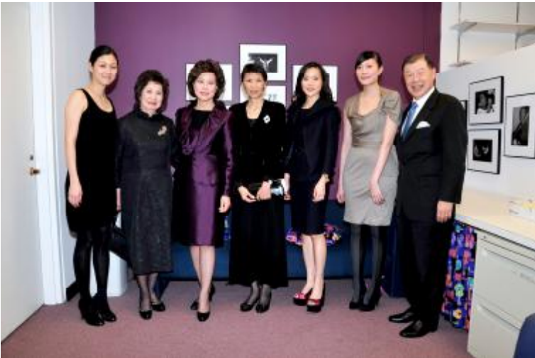
總統夫人周美青率領「雲門舞集」於美國華府甘迺迪中心演出，美國前勞工部部長趙小蘭專程前往致意（1月30日）