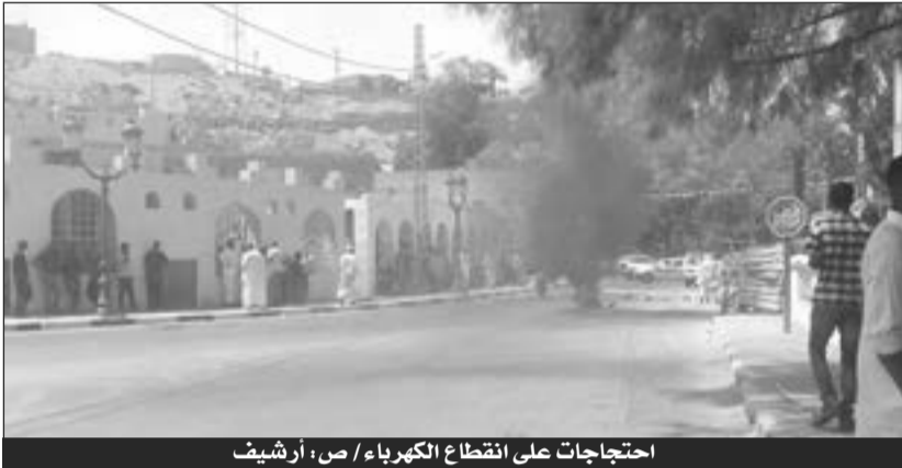
احتجاجات على انقطاع الكهرباء

أقدم العشرات من مواطني بلدية الدبيلة الواقعة على بُعد 20 كلم شرق عاصمة ولاية الوادي، على غلق الوكالة التجارية التابعة لمديرية توزيع الكهرباء والغاز في حركة احتجاجية للتبديد بما أسموه سوء المعاملة والخدمات الرديئة المقدمة من طرف وكالة الدبيلة.