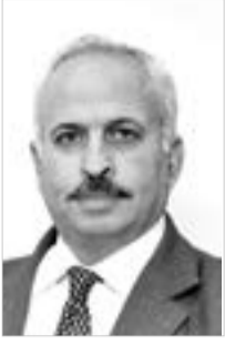
بقلم صالح عوض

عندما تتعدى قضية حدود شعبها فهي بلا شك استطاعت أن تكسر الإحصار الذي يريده عدوها، وعندما تصل إلى أن تكون قضية تتبناها شعوب أخرى وتدافع من أجلها وتدفع لها تضحيات جسيمة فإن ذلك يعني انتصارا أخلاقيا كبيرا حققته رغم عتوقه العدو وقدراتها الإعلامية.