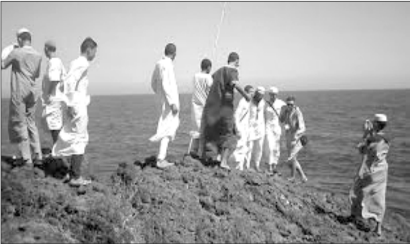
سفيان - ع

سطرت مديرية النقل بورقلة برنامجا خاصا بموسم الصيف، يتم من خلاله نقل الأشخاص باتجاه المدن الساحلية، تزامنا مع إعداد بطاقة اشتراك يستغلها المواطنون في التنقل عبر وسائل النقل المختلفة نحو الشمال لقضاء العطلة الصيفية في المناطق الساحلية.