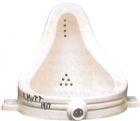
מרסל דושאן, המיורקה