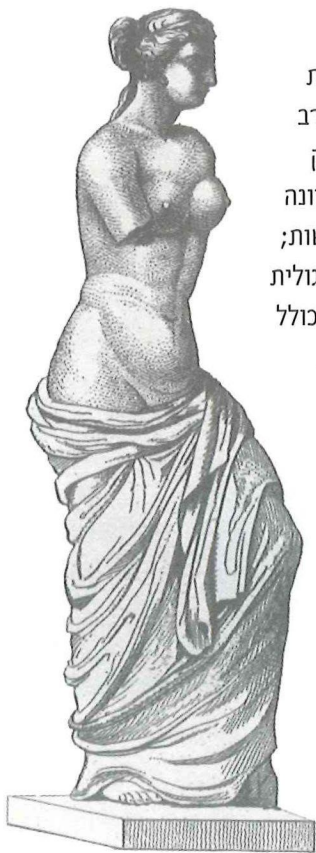
פסל אפרודיטה ממלוס, העתק רומי של מקור יווני.

מאמר זה מתאר שתי מהפכות שהתחוללו בתחום האמנות החזותית; האחת בתקופת הרנסאנס והשנייה במאה ה-20. טענת הכותב היא שהמהפכה הראשונה הנה חיובית בעיקרה ואילו זו השנייה מאיימת להרוס את כל מה שהשיגה הראשונה. התוצאה, או לחילופין המשך התהליך, ייחשפו, מן הסתם, בעתיד.