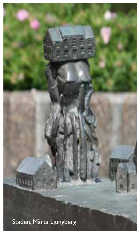
Staden, Märta Ljungberg