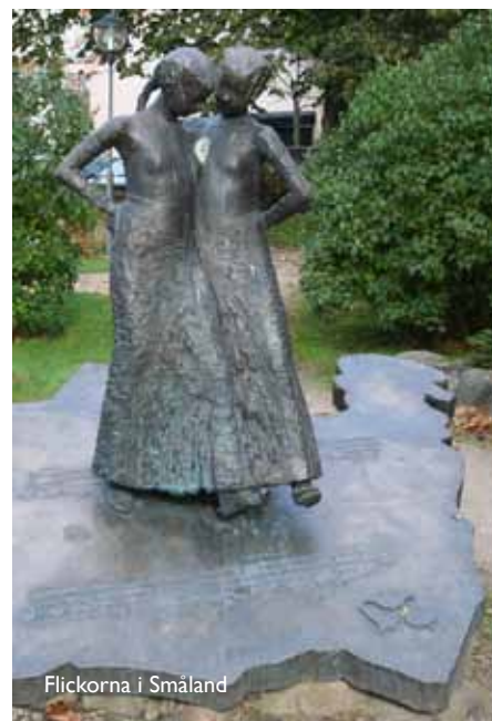
Flickorna i Småland