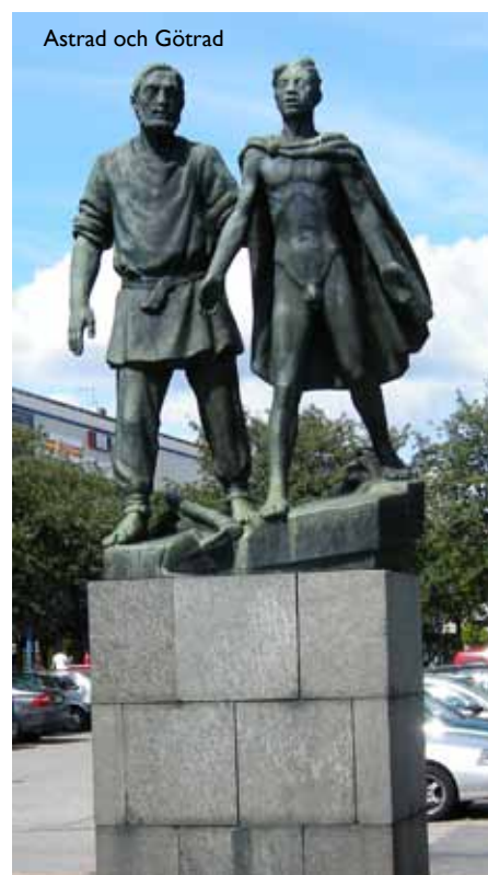
Astrad och Götrad

Statyn stod från början på den inre delen av torget. Strax efter att statyn kommit på plats drabbades Ljungby centrum av en förödande brand. Statyn förvarades i ett förråd under lång tid och placerades efter centrums ombyggnation på sin nuvarande plats vid Stora torget i Ljungby.