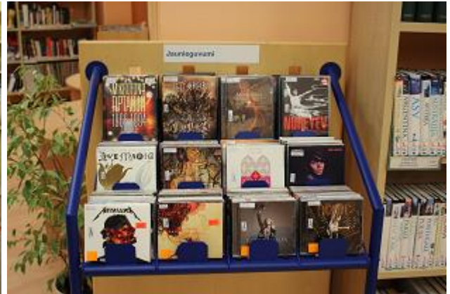
Jaunieģuvumu diena un jaunāko mūzikas ierakstu izstāde CB Pieauguģo literatūras nodaļā