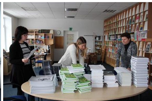
Skolu bibliotēkas lasītavā saņem centralizētos dāvinājumus