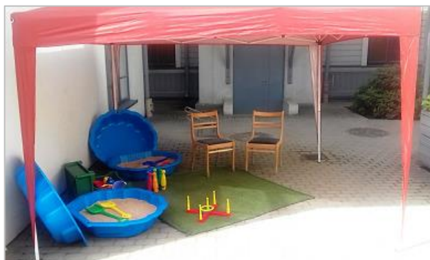
Vasaras bērnu stūrītis filiālbibliotēkas "Vidzeme" pagalmā