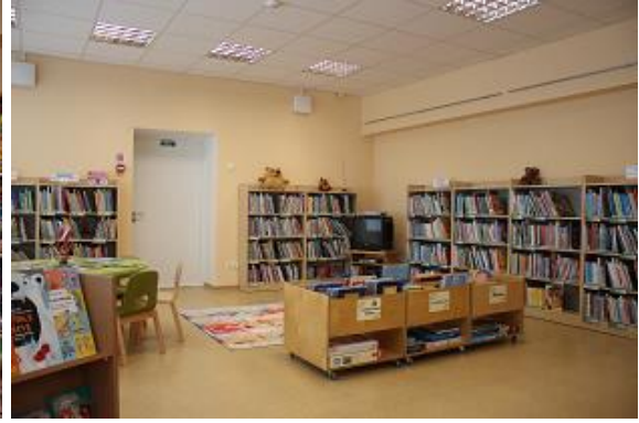
Pēc ēkas 1. stāva iekārtošanas tajā izvietota bērnu literatūras nodaļa un periodisko izdevumu lasītava