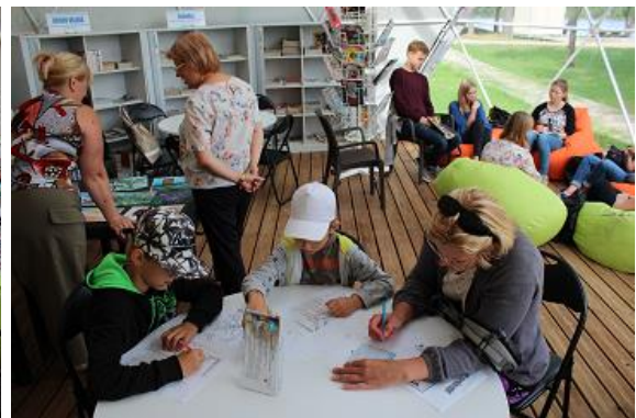
Lasītavas vajadzībām tika iegādātas mēbeles bērniem, galdi un krēsli, plaukti un sēžammaisi