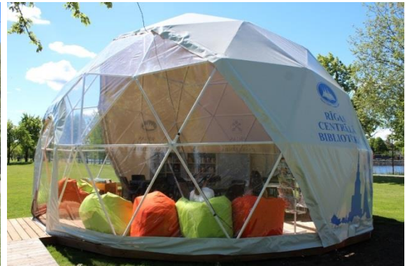
Lasītavas īpašā telts piesaistīja uzmanību jau no attāluma