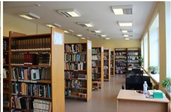
Pārkārtots arī bibliotēkas 2. stāvs