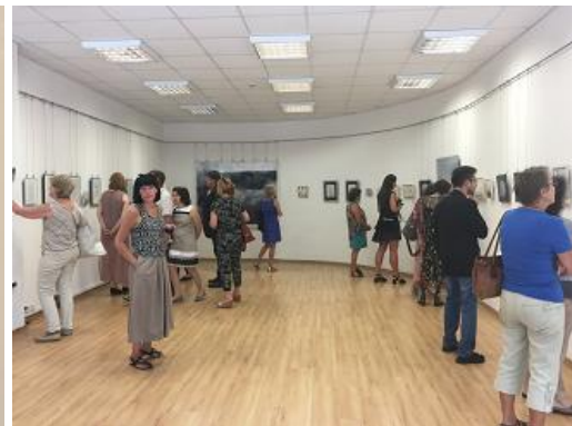
Mākslinieka Aivara Vilipsona izstādes-zibwacīnas „Čaks & V-sōns” un Justīnes Lūces izstādes atklāšana CB