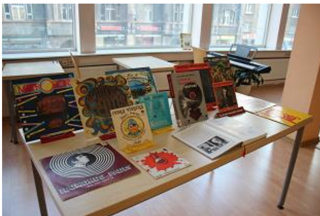
Skaņuplaģu vēsturei veltīta izstāde CB