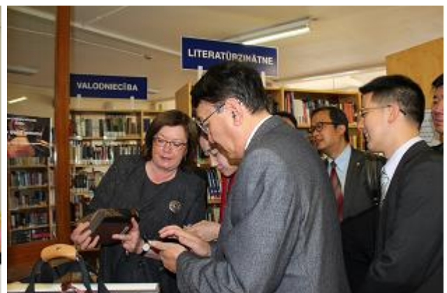
2017. gadā CB apmeklēja viesi no Uzbekistānas (attēlā pa kreisi) un ūanhajas (Ķīna)