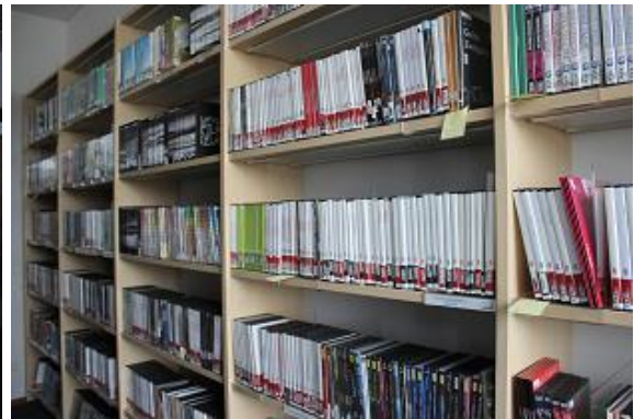
Lasītavā pieejams plašs ar pedagoģijas jautājumiem saistītu izdevumu klāsts, kā arī dažādi mācību procesā noderīgi videoieraksti