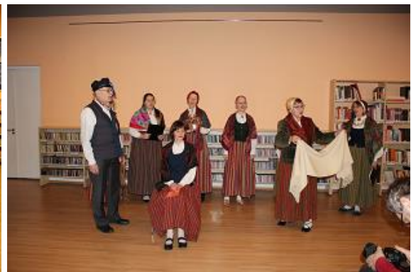
CB muzicē Miltiņu ģimene un Rīgas lībiešu dziesmu ansamblis “Līvlist”