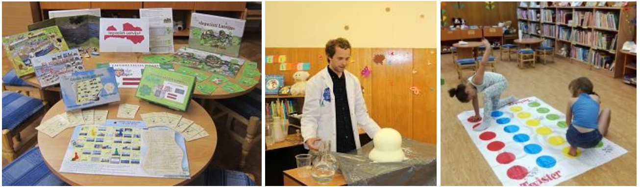
Prāta, zināšanu un kustību spēles Sarkandaugavas filiālbibliotēkā