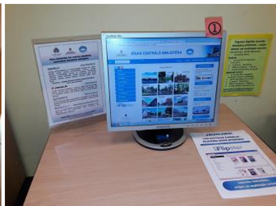
Informācija par RCB pieejamajām datubāzēm filiālbibliotēkā "Zemģale"