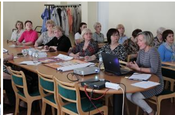
Nodarbības RCB mācību telpās Graudu ielā 59A: seminārs jaunajiem bibliotekāriem un tikšanās par aktualitātēm Latvijas publiskajās bibliotēkās