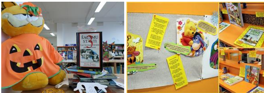
Izstādes bērniem CB Bērnu literatūras nodaļā un "Saulaino dienu bibliotēkā"