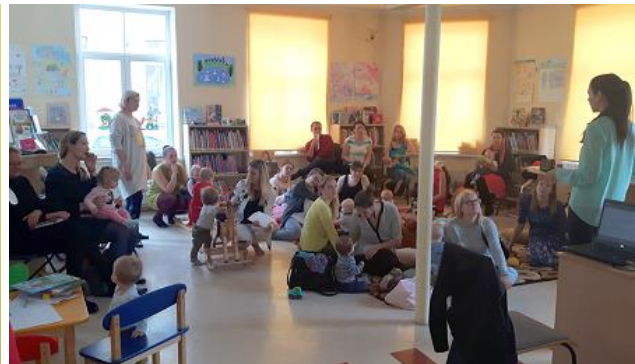
Projekta nodarbības filiālbibliotēkā "Stražs" un "Vidzeme"