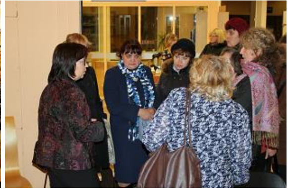
RCB organizētās profesionālās pilveides nodarbības apmeklēja arī skolu bibliotēku darbinieki