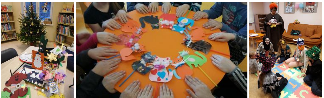
Radošās darbnīcas un aktivitātes filiālbibliotēkā "Vidzeme", Daugavas filiālbibliotēkā un filiālbibliotēkā "Zemgale"