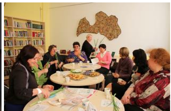
Projekta "elpa" Daugavas filiālbibliotēkā un noslēguma pasākumā