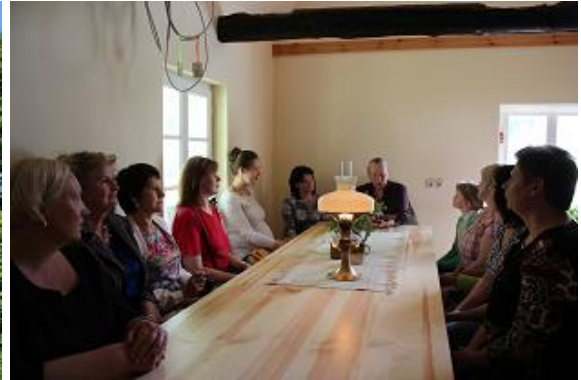
15. jūnijā grupa RCB darbinieku apmeklēja Lizuma pagasta Kalaņģus – pirmā RCB direktora Apsīšu Jēkaba dzimtās mājas