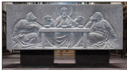
Het centrale altaar in de O.-L.-Vrouwekerk te Dendermonde